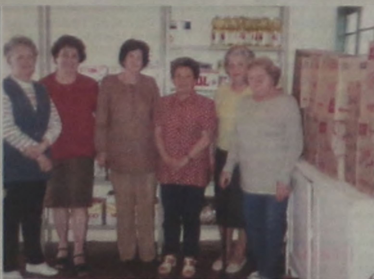
Voluntárias e diretoria da Rede do Câncer

Este pequeno grande exemplo de amor à humanidade é realizado pela diretoria da Rede do Câncer e 15 voluntárias encarregadas. A direto-