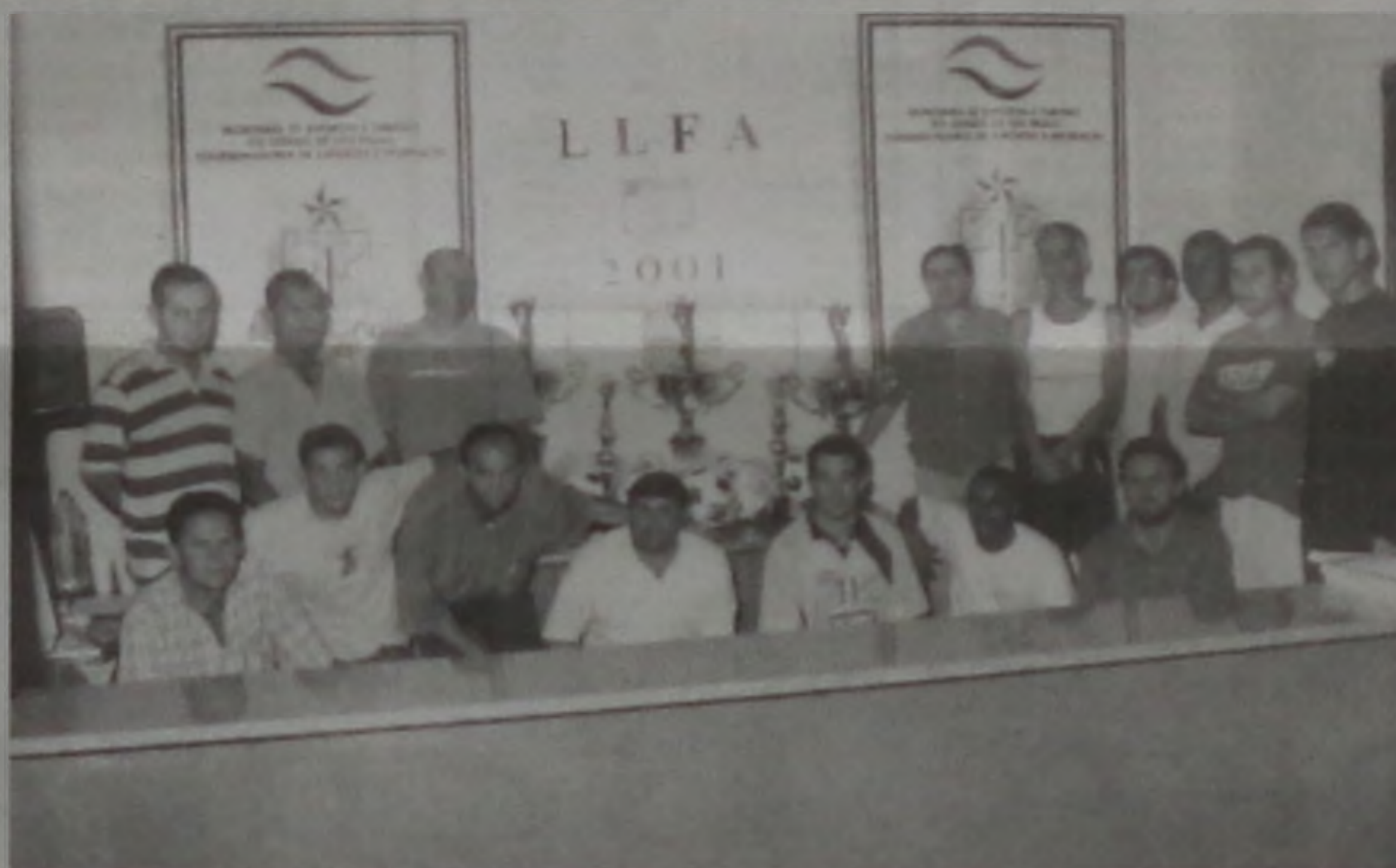
Representantes das equipes durante reunião com a diretoria da Liga