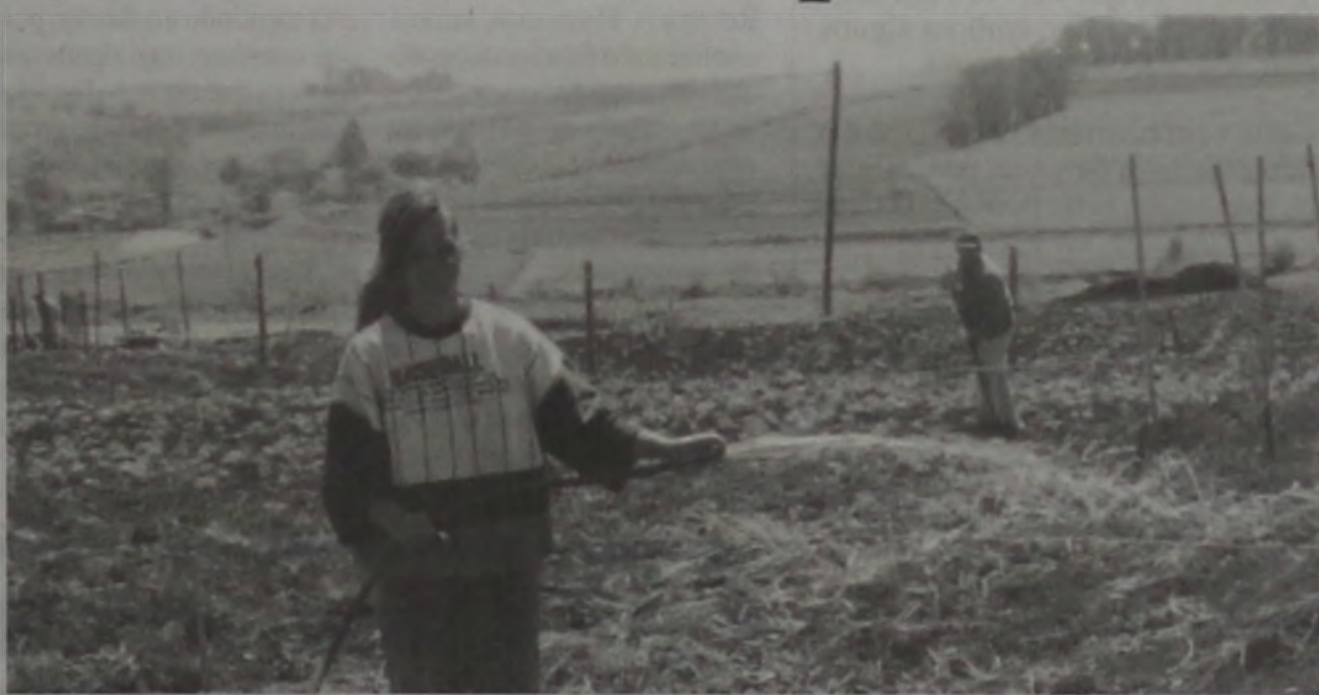
Dezesseis famílias cuidam do plantio na horta

ta comunitária começaram a ser cultivados há 2 meses e a expectativa é grande; a produção será dividida ao meio, 50% da associação e 50% para as famílias que cuidam do plantio na horta. Da parte que cabe às famílias, elas que sabem o destino que devem dar as verduras, legumes etc. A associação vai destinar a sua