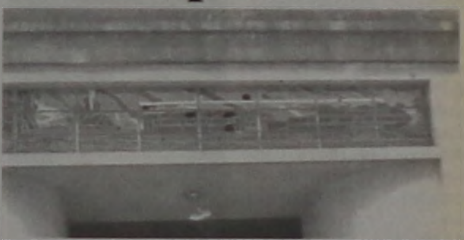
danificado por vândalos. Pela foto, observa-se os sinais dos danos no vitral "Maria Fumaça", símbolo da antiga estrada de ferro Sorocabana.

Entretanto, o velho prédio da Estação FEPASA, que é um patrimônio que precisa de recuperação, teve, dias atrás, seu centenário vitral