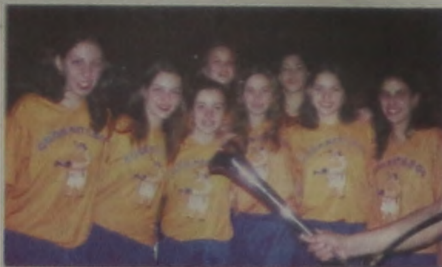
Equipe vencedora da I Gincana Cooperelp 2000

Competições, jogos de futebol, música, brincadeiras, perna-de-pau, cachorro quente, refrigerantes, sorvetes, algodão doce, pipoca e caixinha de doces: as crianças estão animadas.