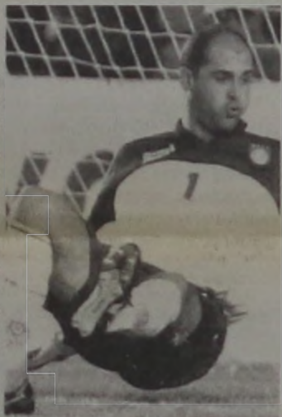
Marcos revelado pelo CAL, goleiro da seleção e do Palmeiras

Mas, numa cidade tão pequena, com um esquadron formidável, de poucos recursos, não foi possível manter aquela "máquina" de jogar bola. E, aos poucos, o time foi se diluindo, onde o mestre Didi