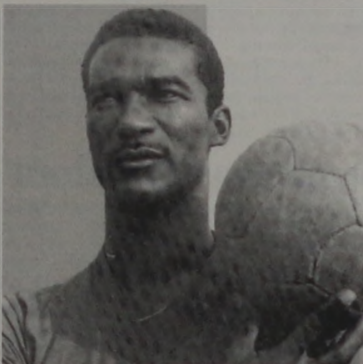
Didi: bi-campeão mundial, revelado pelo CAL em 45/46