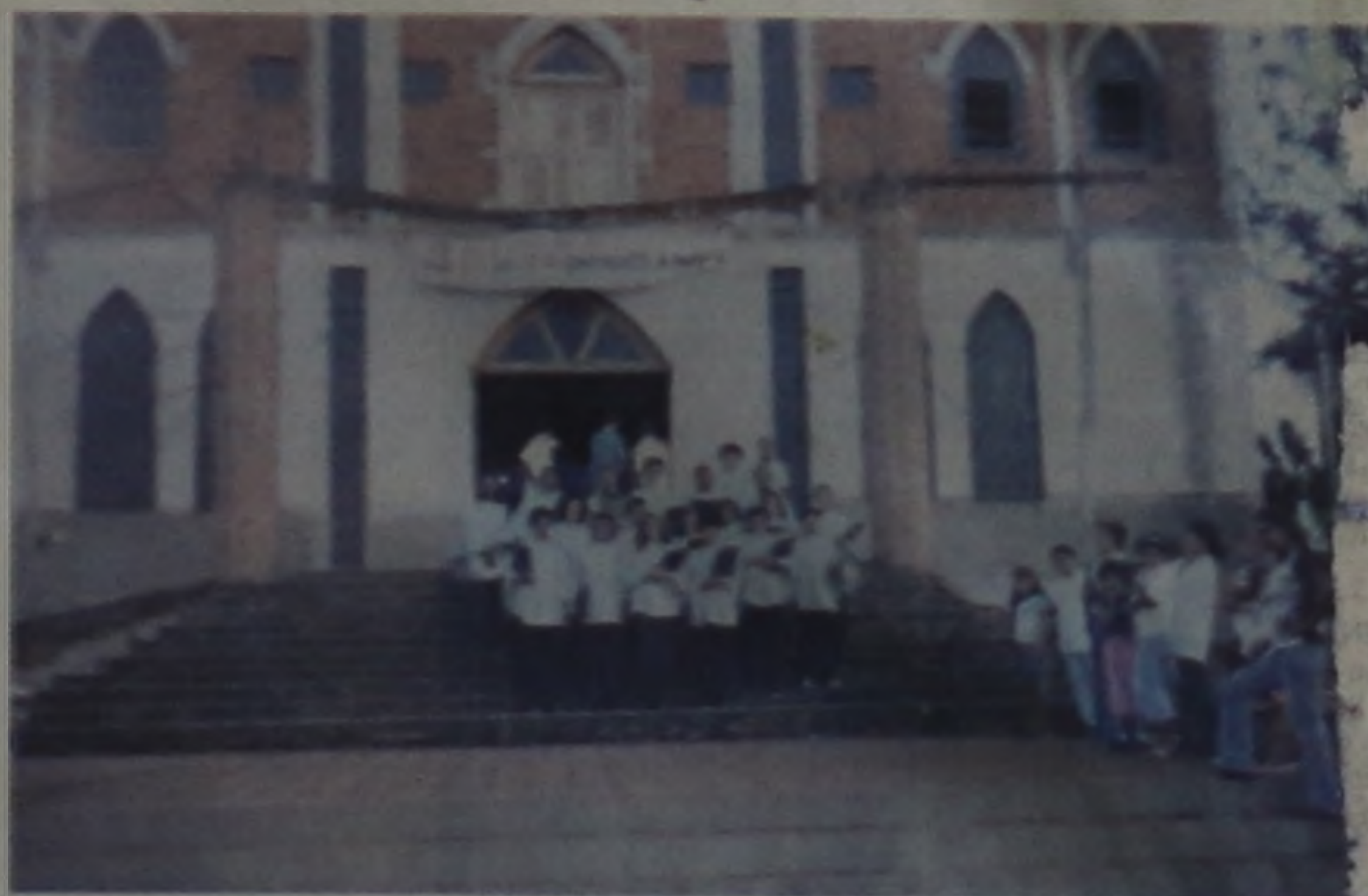
O Coral de Lençóis Paulista se apresentou em Igarapu do Tietê

Lençóis Paulista é uma cidade conhecida pelo seu apurado gosto musical. Lençóis Paulista é uma cidade reconhecida, também, pelos seus cantos de coral. Desde o coral de Bach aos nossos, há o São Vicente de Paula, do bairro "Maestro Júlio Ferrari".