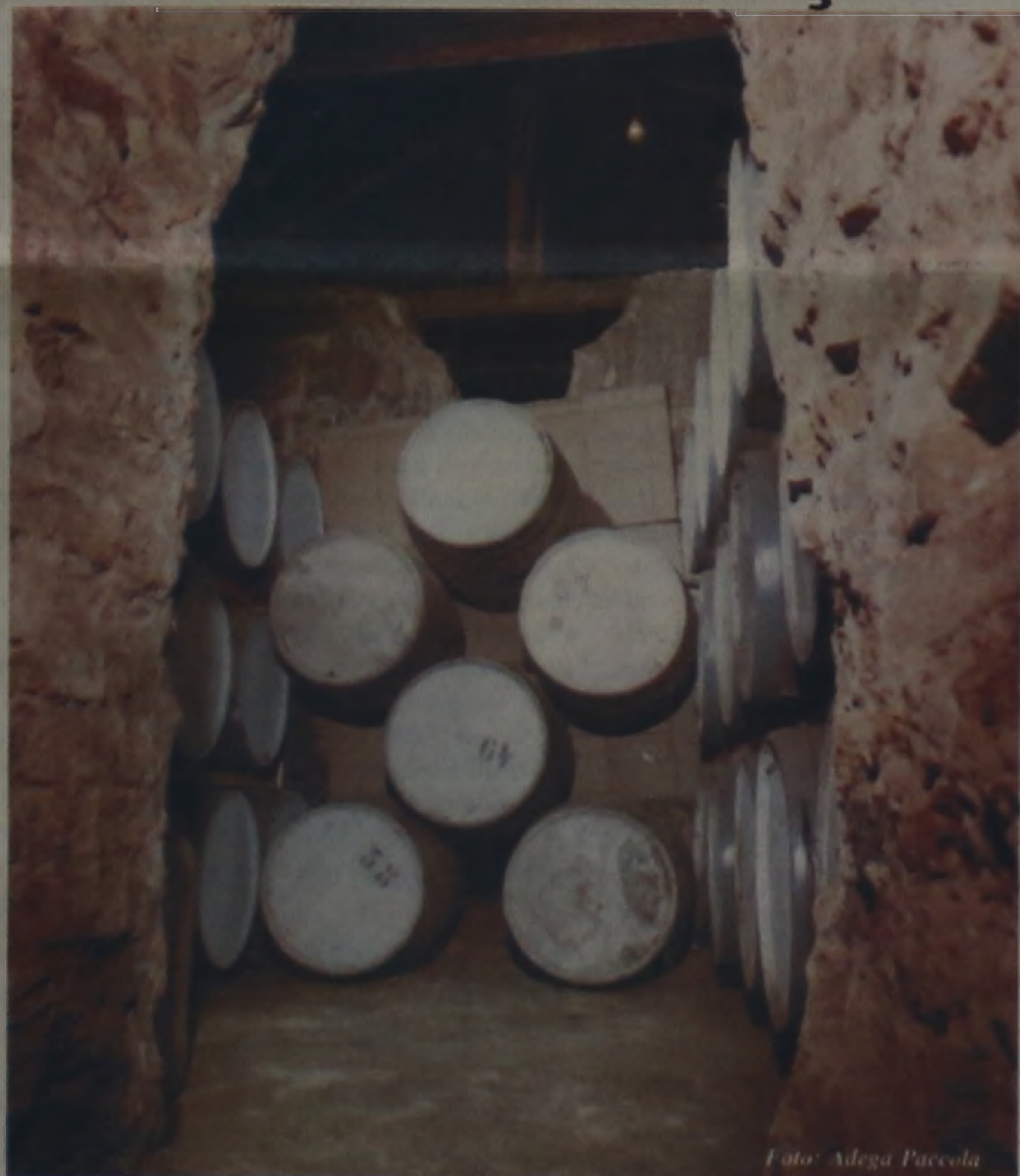
Barris de cachaça em processo de envelhecimento na Adega Paccola

O presidente Fernando Henrique Cardoso colocou em vigor na última quarta-feira o decreto nº 4062, que oficializa o nome "cachaça" para definir a aguardente brasileira. Com isso, a nossa boa e velha pinga ganha o