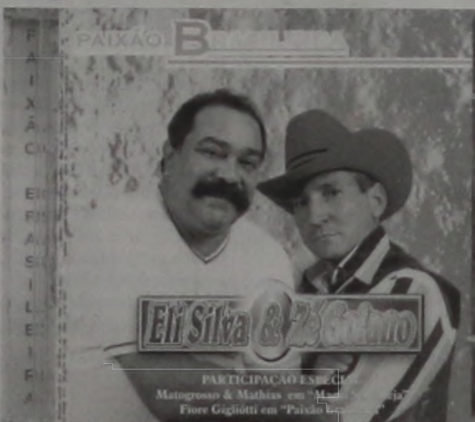
Paixão Brasileira, 11º trabalho da dupla

Para os fãs que ainda não encontraram o Paixão Brasileira, é só procurar os cantos dos cantos do cantador desta terra; desde o Pica-Pau até o Toninho Egüera, passando pelo Aduato, Bigo-