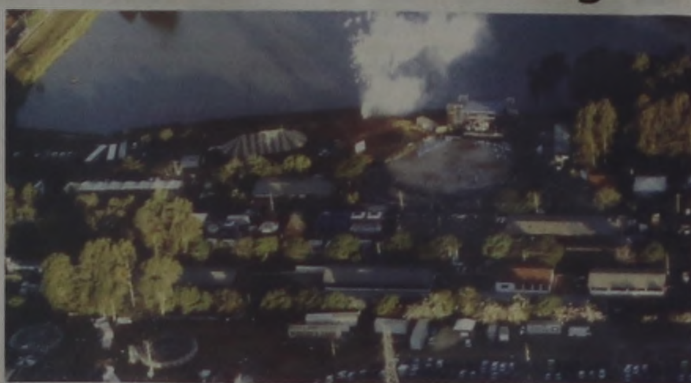
Os organizadores esperam 200 mil pessoas na Facilpa

Além dos rodeios e shows, a maior festa popular apresenta algumas mudanças. O pavilhão Aldo Trecenti terá uma nova empresa montando as lojas, com novas divisórias e outra organização. Para a área comercial, as tendas-pirâmides são novas, haverá tendas-pirâmides com coberturas coloridas, dando um efeito à noite. Foram reformadas as barracas filantrópicas, as cozinhas estão de acordo com as normas da vigilância sanitária. Também