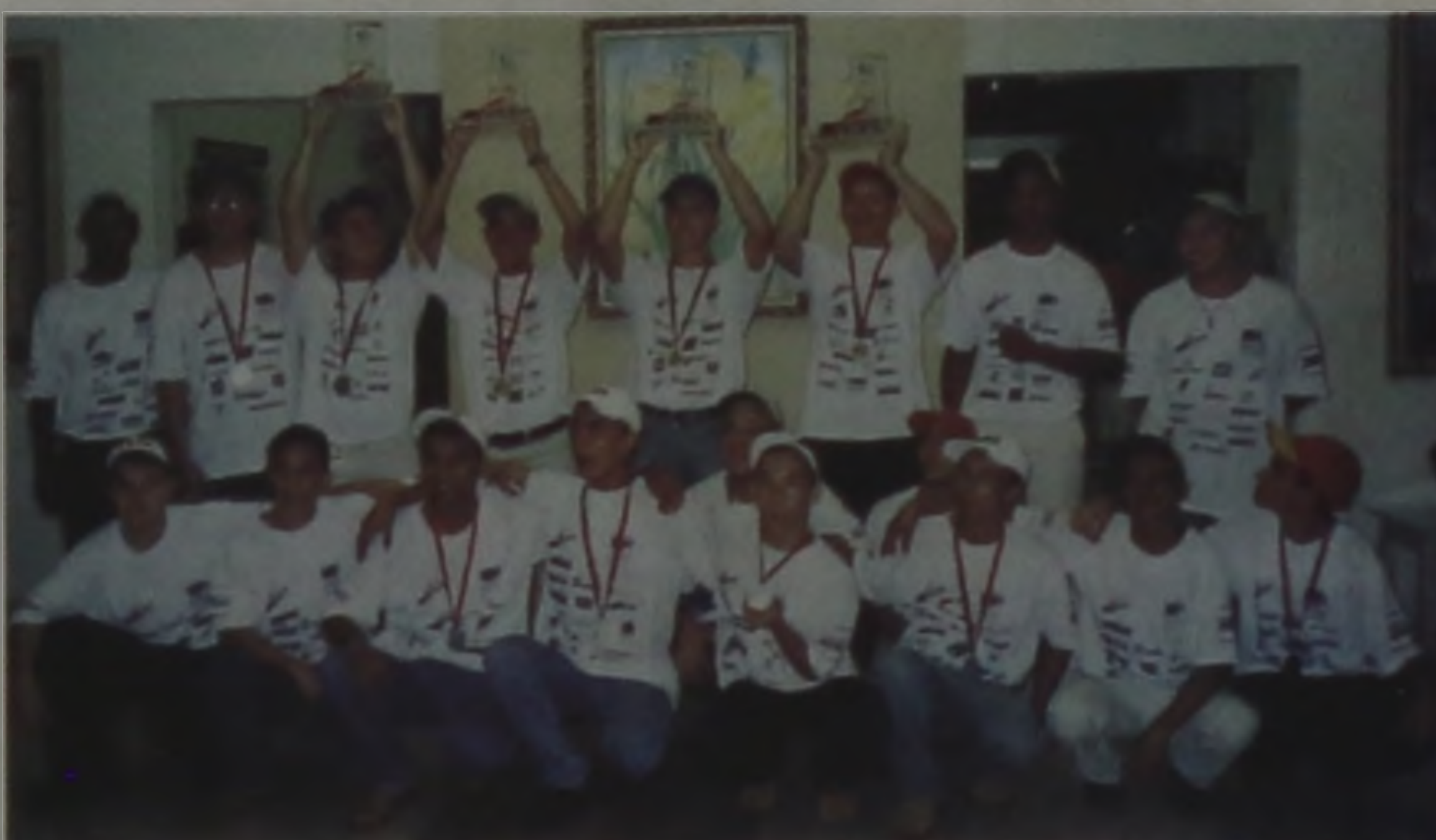
Alunos do Senai Lençóis são competitivos e capacitados para representar o Brasil

Participando em 18 modalidades das 24 existentes na Olimpíada do Conhecimento, realizada em Americana e Limeira, de 06 a 12 de abril, alunos do Centro Municipal de Formação Profissional "Prefeito Ideval Paccola" SENAI Lençóis Paulista conquistaram quatro medalhas de ouro, oito de prata e duas de bronze, representando, respectivamente o primeiro, segundo e terceiro lugares em 10 modalidades.