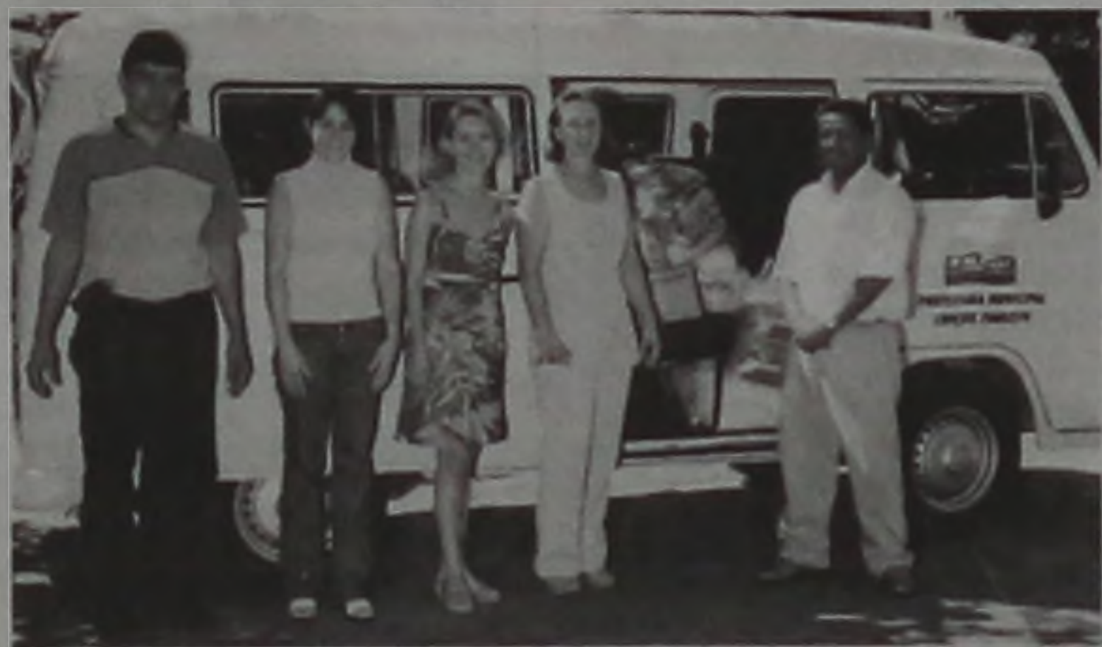
Momento da entrega das cestas básicas