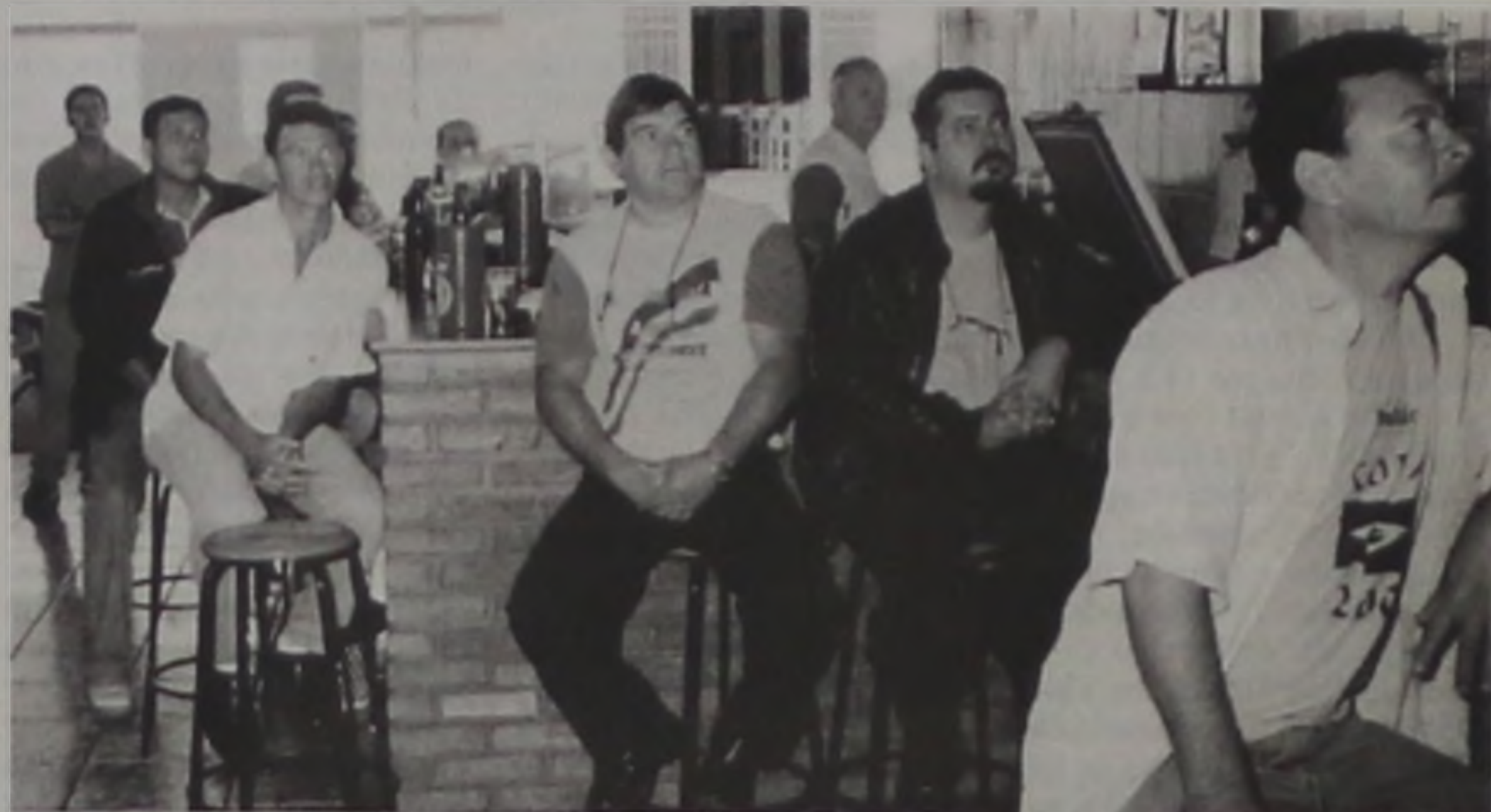
A torcida para o Brasil ir para a final parou o país das 8h às 11h, os bares ficaram lotados; para domingo a expectativa é grande, e se ganhar, a festa será maior