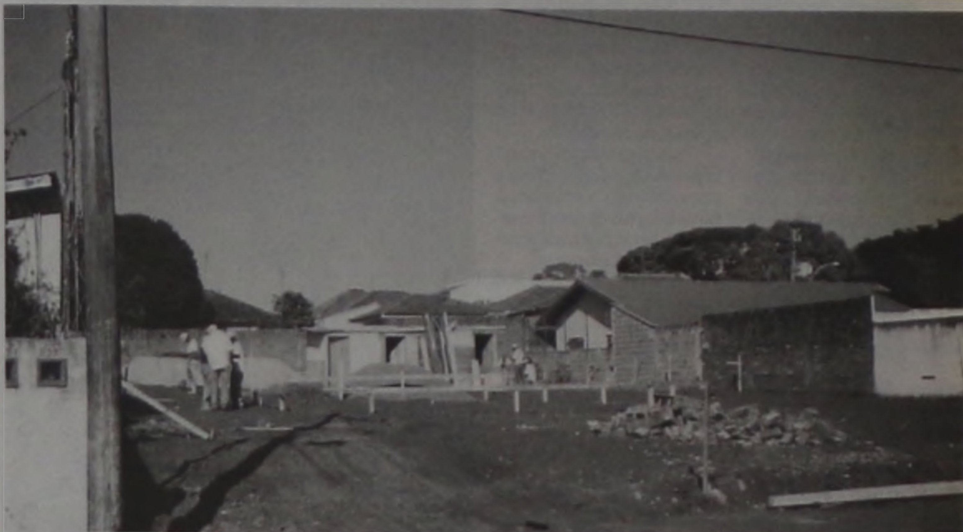
Em diversas cidades são proibidas instalações de antena de telefonia celular em lugares de concentração; em Lencóis está autorizado a instalação de uma bem no centro