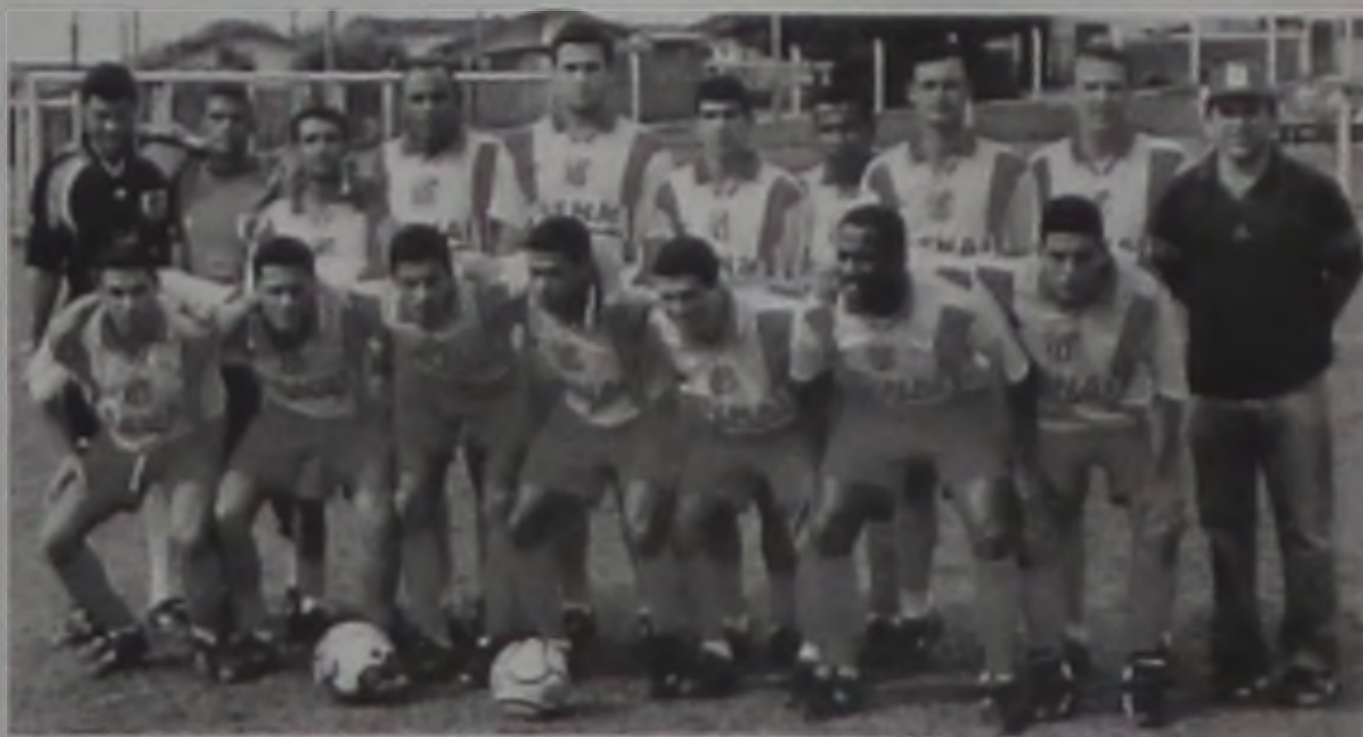
Expressinho, vice-campeão do ano passado, é o primeiro time para garantir vaga a final