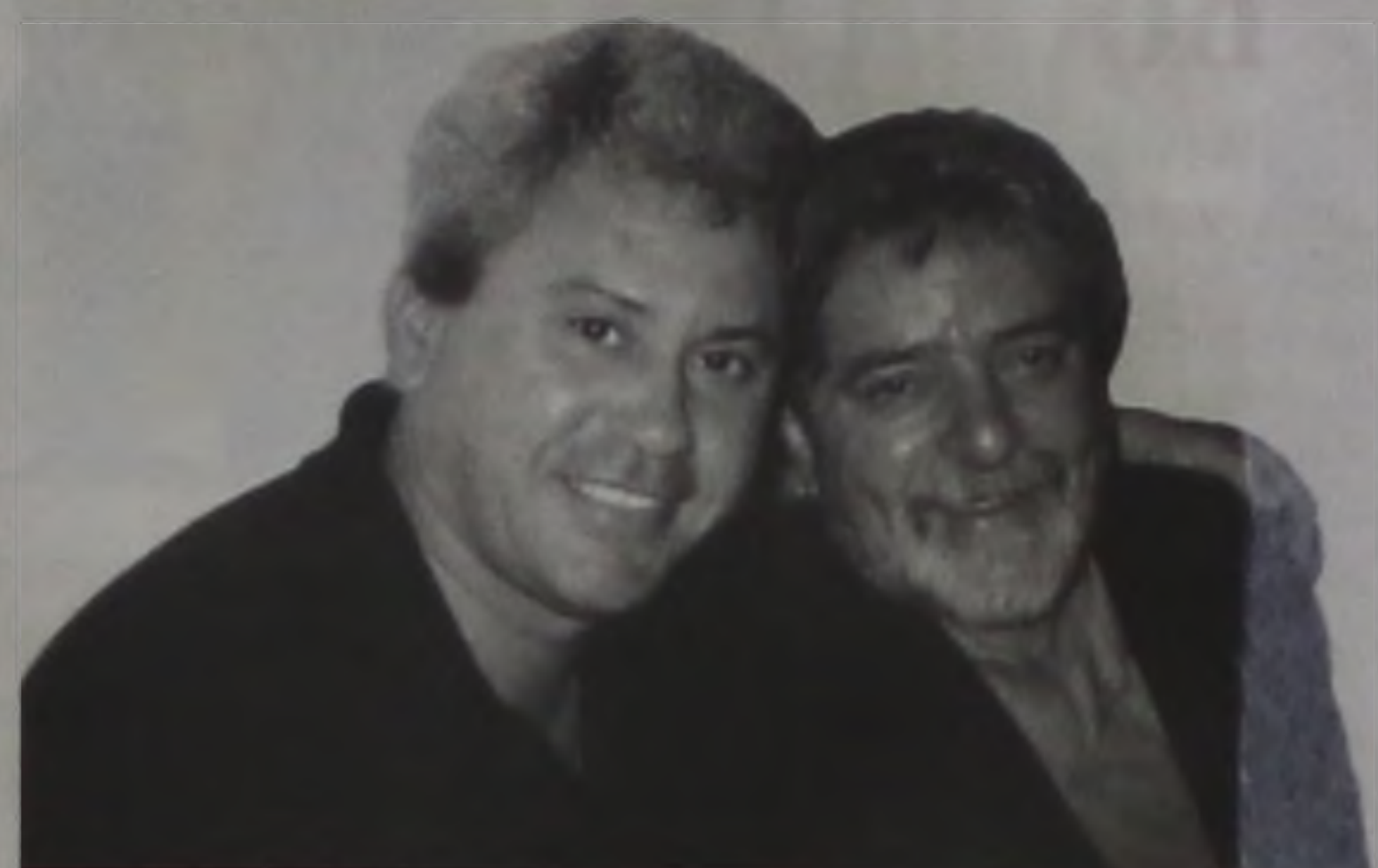
Alcimir com Lula num dos momentos da campanha

E é por causa dessa militância, na sua qualidade de trabalho de conscientização e convencimento dos eleitores que Marinho acredita firmemente na vitória para o governo de São Paulo, e em outros estados, e também para a presidência da República.