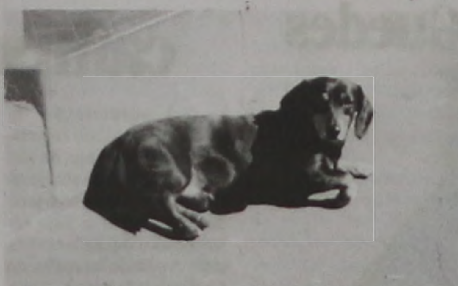
Leve seu cão ou gato num dos postos de vacinação mais próximo de sua residência

São Roque, Colônia do Campo, Pessina II, Duraflores, Tununas, Fatura, Bocaina, San-