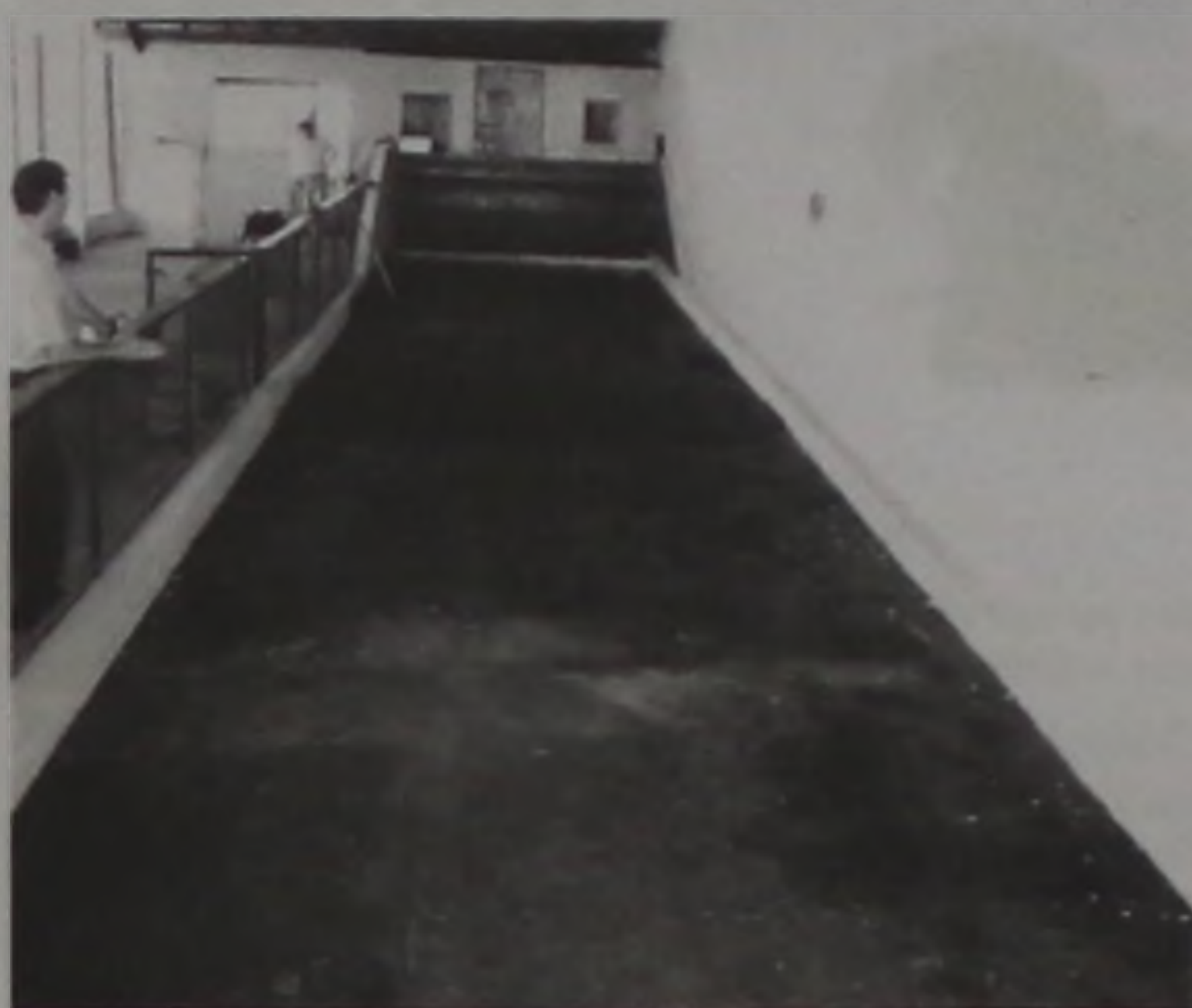
Além da pintura e recuperação das peças de madeira da quadra, o piso foi substituído

Além da pintura e recuperação das peças de madeira da quadra, o piso foi substituído por uma mistura de emulsão asfáltica com cimento e areia. A mistura permite que o piso tenha uma durabilidade maior. A entrega da obra será feita em solenidade agendada para amanhã, 11 de agosto, às 11h, ao lado do Estádio Municipal de Alfredo Guedes.