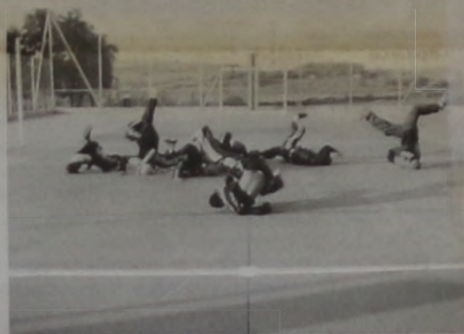
Grupo de hip-hop se apresentou na quadra

O prefeito Marise agradeceu Élio Busch e o governador Geraldo Alckmin por mais esta obra para a nossa cidade. Marise disse ainda que se tudo ocorrer dentro do previsto, na próxima semana o bairro estará recebendo a pavimentação asfáltica, conseguida graças ao empenho do deputado estadual Milton Flávio e do vereador Manezinho. Hélio Busch disse que a construção da quadra poliesportiva é um remédio contra as drogas e que a mesma está visando o desenvolvimento social das famílias dos mutuários.