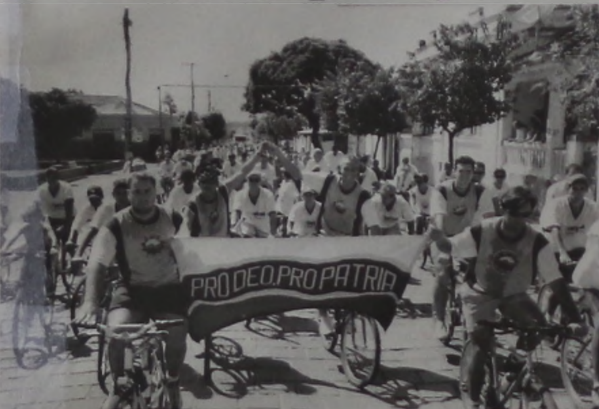
Participantes do passaio ciclístico na chegada em Borebi

Com o apoio da Unidade Municipal de Esportes - UME - 182 ciclistas de Lençóis e 25 da cidade de Borebi percorreram os 27 quilômetros que separam as duas cidades. O passaio que teve início às 9h do último domingo 27, e durou duas horas e meia, aconteceu em comemoração aos 145 anos de Lençóis Paulista. Os ciclistas, com idade entre sete e 70 anos, fizeram três paradas técnicas para recuperar as energias, pois o calor muito forte extenuava os