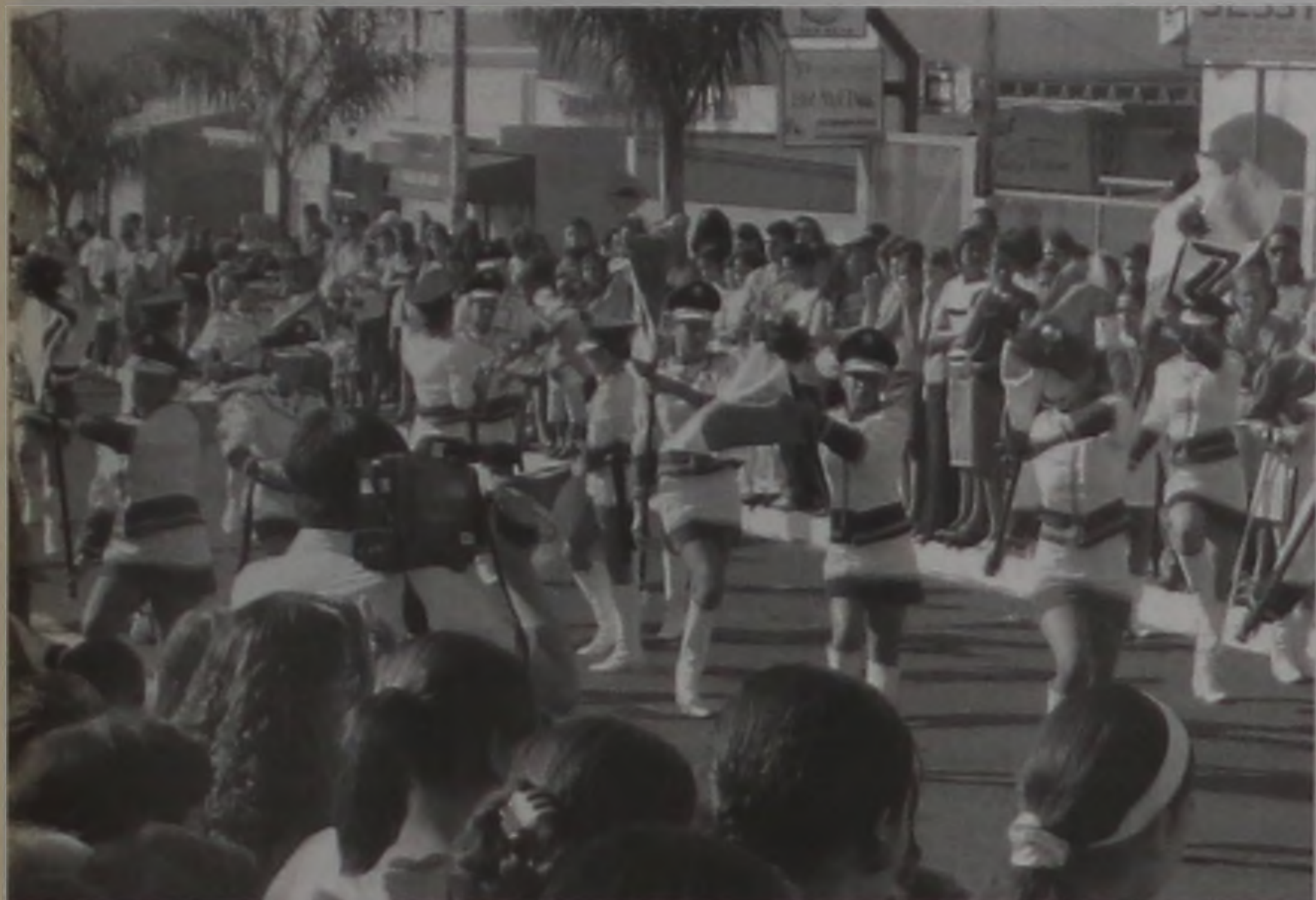
Banda Zillo Lorenzetti abriu o desfile na Av. Pe. Salústio

O desfile cívico realizado na última quinta-feira na avenida Padre Salústio, para comemorar o 145º aniversário da cidade levou grande público àquela via pública. Escolas, autoridades e povo se confraternizaram. Ali lembrou-se os feitos e personagens importantes de nossa comunidade.