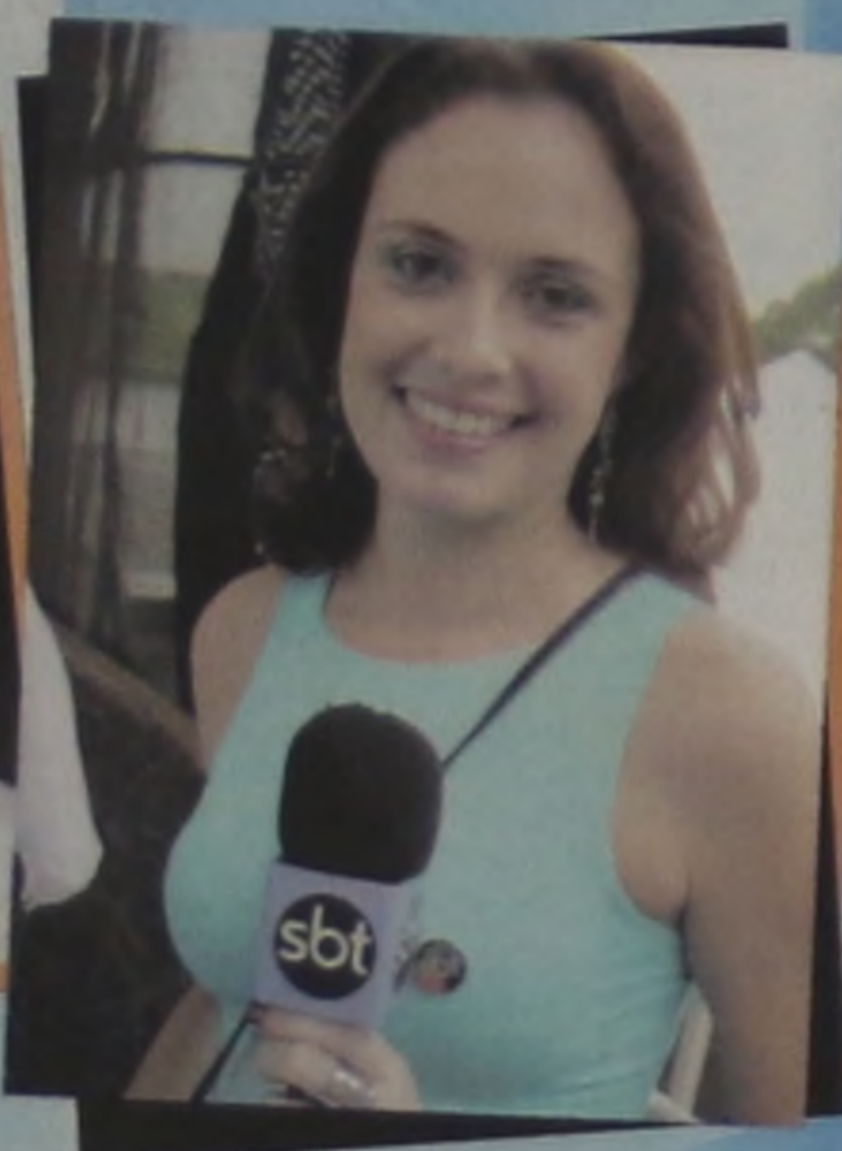
Na nossa frente só você...