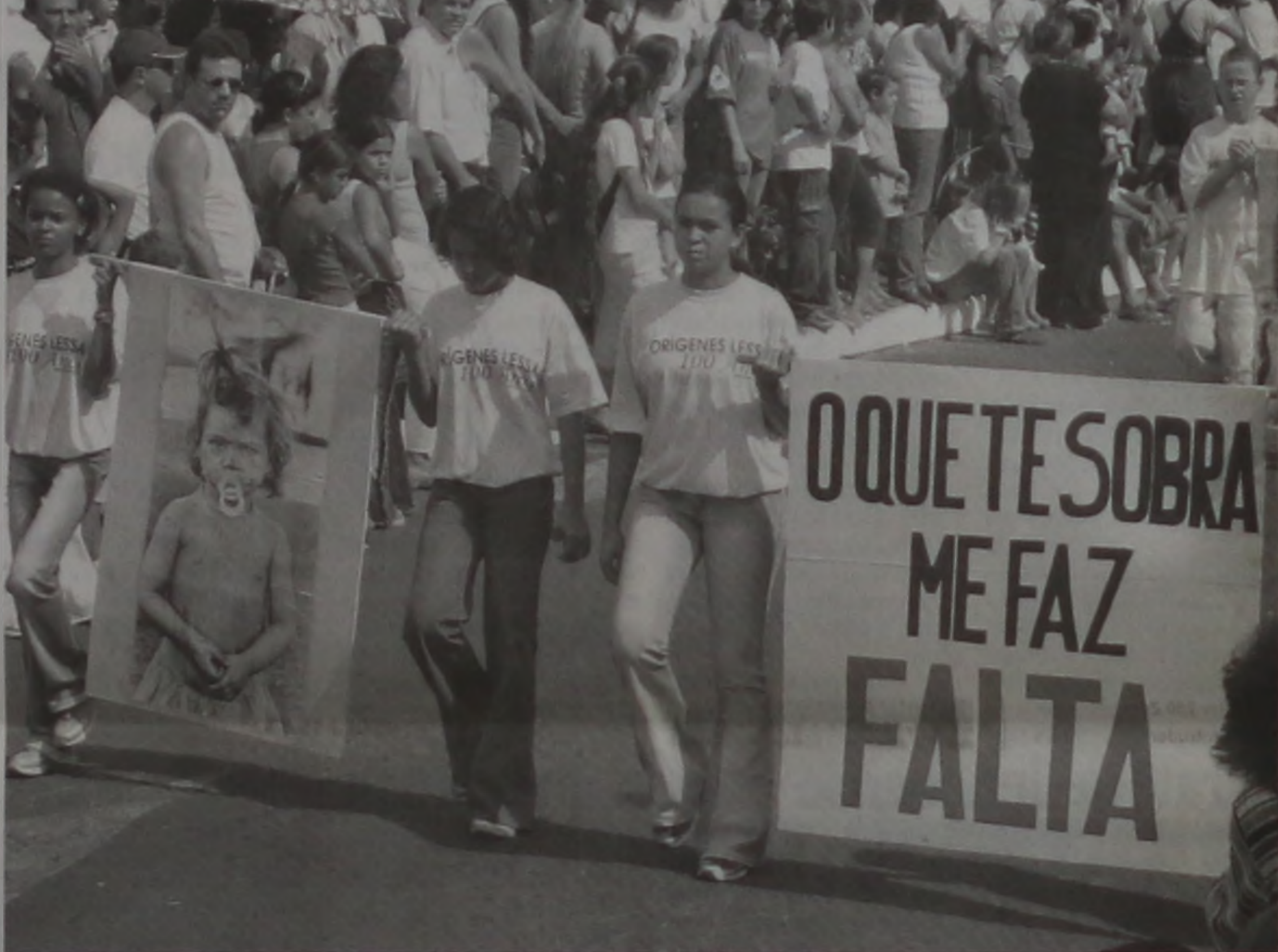
O desfile contou com a participação das escolas do município

Esta dieta é ótima para quem quer perder peso ou apenas eliminar excessos do organismo. Basta tomar líquidos, como sucos, vitaminas, sopas e caldos durante 24 horas seguidas, a partir do momento em que a Lua muda de fase. Nesse período, sempre que sentir fome, bata o alimento no liquidificador. Próxima mudança lunar: 9/05, às 08h53, Lua Crescente. Dica: Esse é o momento para delimitar melhor seus objetivos e escolher o caminho para alcançá-los.