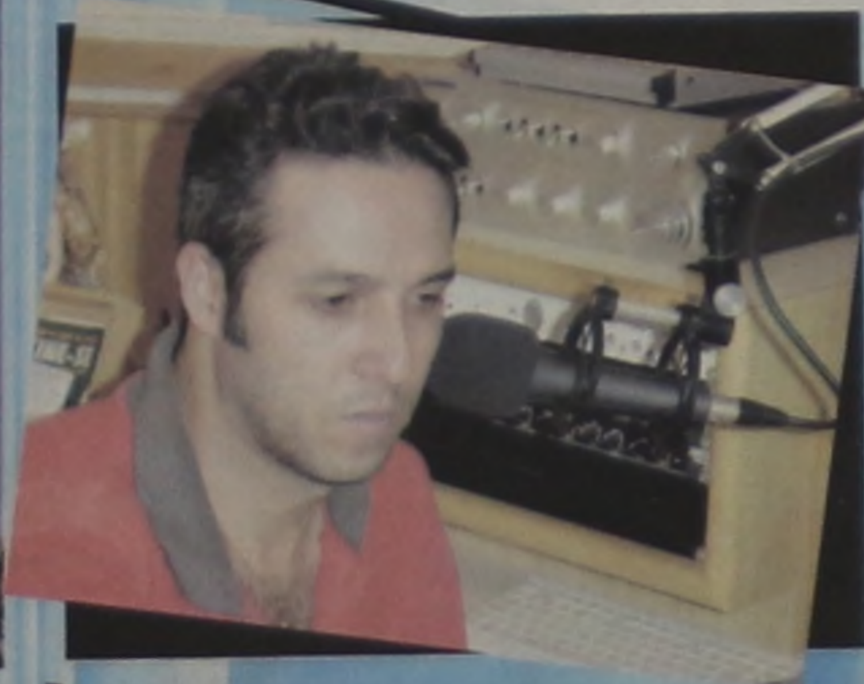
Paulista: Intercessão nas ondas da RM.