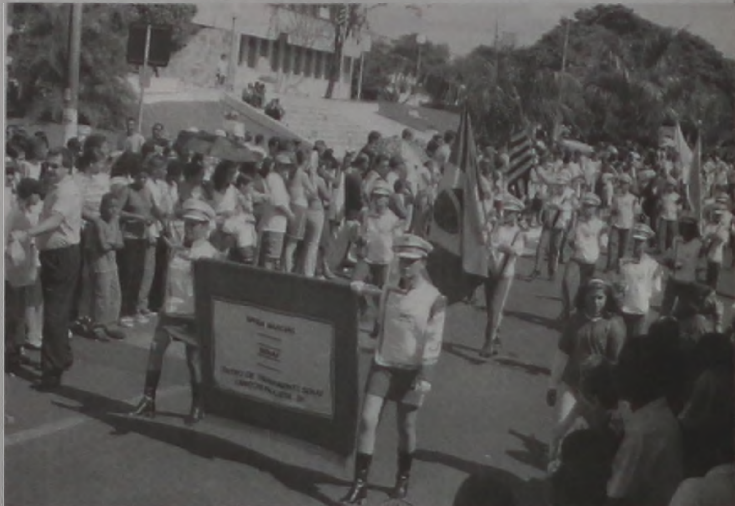
A Banda Marcial do Senai fez sua estréia no desfile cívico