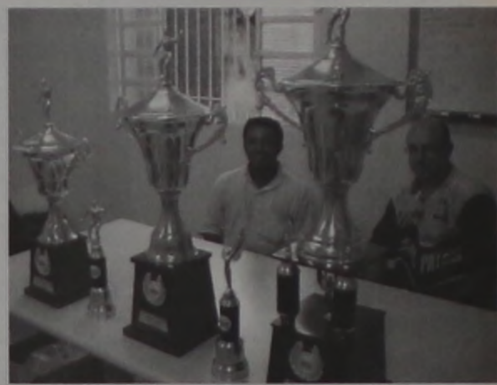
As três equipes melhores colocadas receberão medalhas e troféus