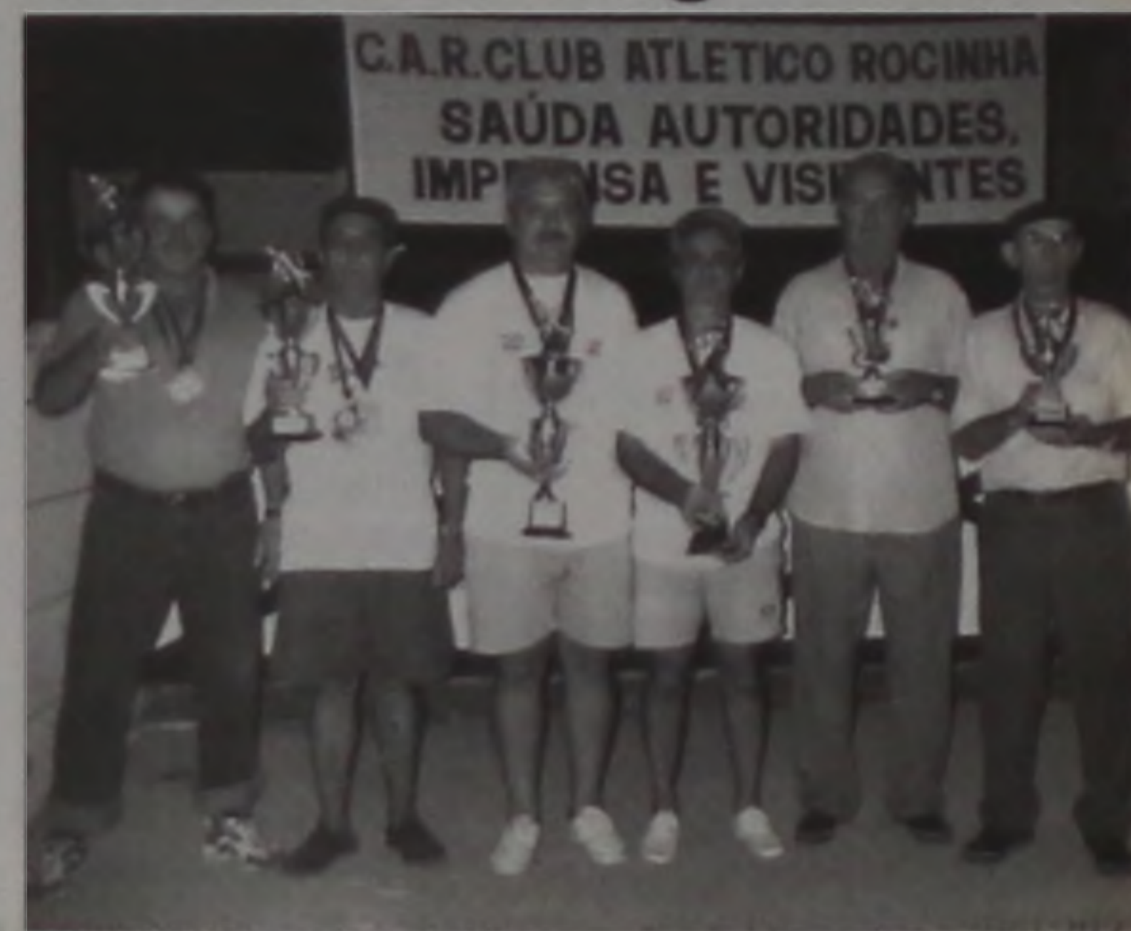
A competição é um dos eventos esportivos da programação oficial de aniversário dos 145 anos de Lençóis Paulista