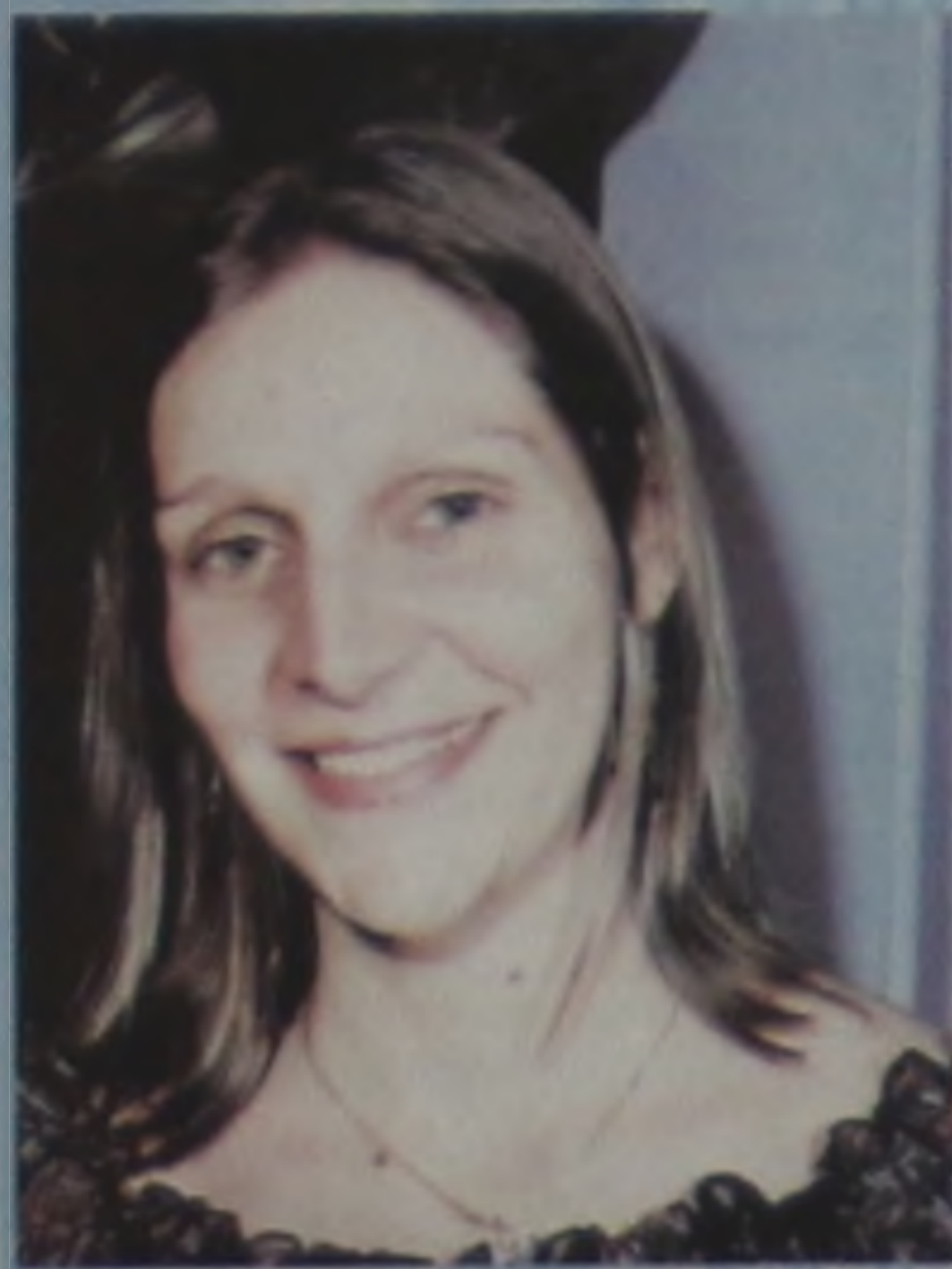
A musa do paparazzo!