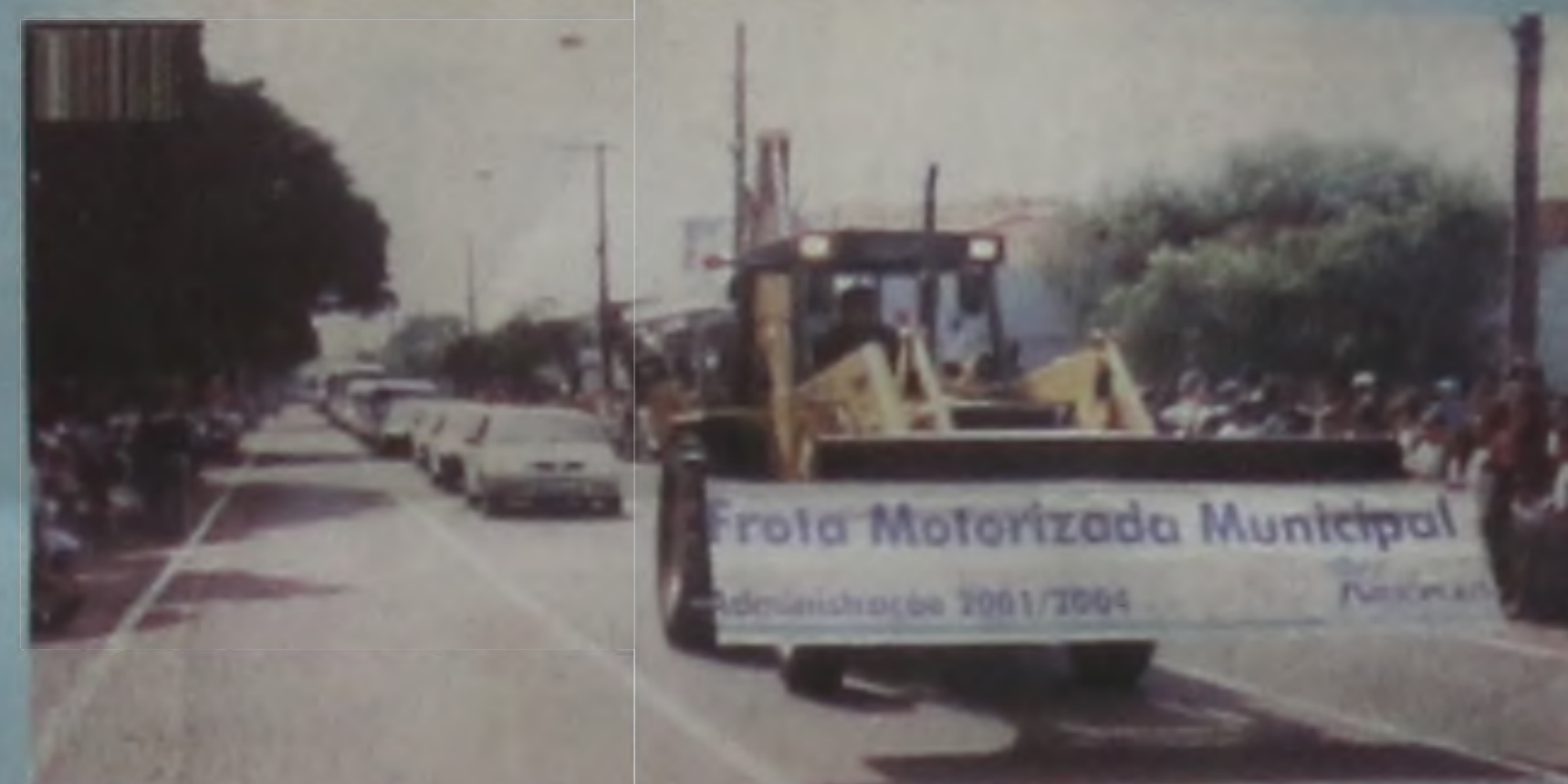
Frota motorizada municipal