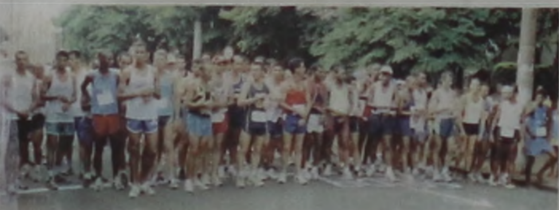
Aproximadamente 200 corredores participaram no último domingo, da 10ª edição da Prova Pedestre de Lençóis Paulista, organizada pela Prefeitura Municipal, através da Diretoria de Esportes e Recreação