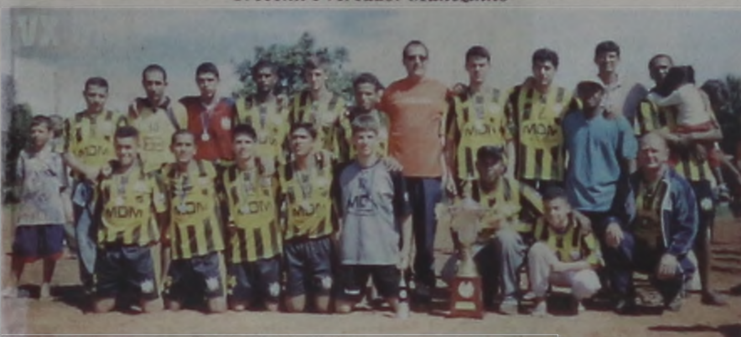
Equipe Santa Luzia, vice-campeã da copa