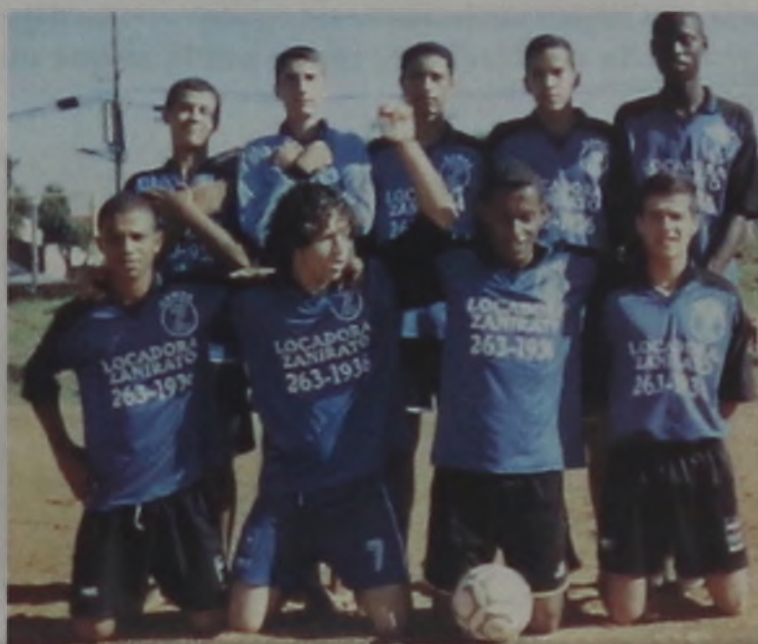
O time do São Caetano foi o 3º colocado da copa