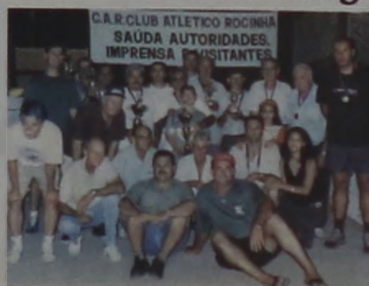
Organizado pela Prefeitura, através da Diretoria de Esportes e Recreação, as finais aconteceram no campo de bocha da Rocinha e reuniram 8 duplas, entre 22 que participaram da fase de classificação