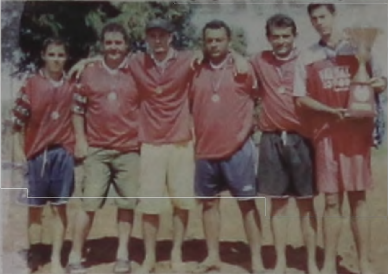
Atletas da equipe São Jorge, 3ª colocada