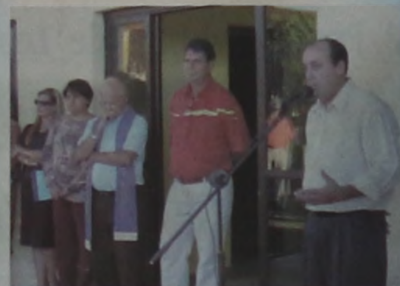
Construção da Unidade de Saúde "Benedito Barreto Sobrinho".