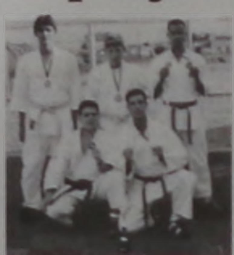
Medalhistas da Academia Zanchin

É notório que o esporte é salutar, principalmente na juventude. A promoção de eventos esportivos proporciona novos caminhos aos atletas. Entretanto, é necessário que algumas providências sejam tomadas para a realização dessas competições. Atletas de academias vindas da região para a Copa realizada