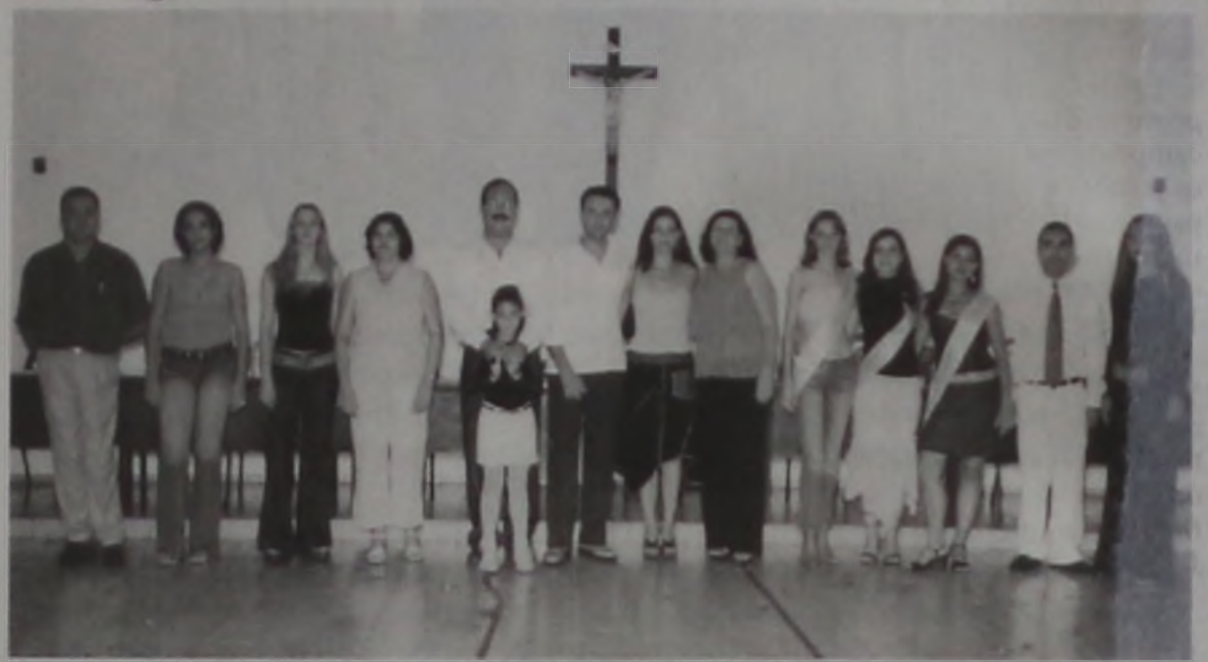
Organizadores, patrocinadores e as vencedoras do concurso

Com o apoio de empresários, comerciantes, e da população em geral, a cidade de Areiópolis realizou no dia 26 de abril na Câmara Municipal o concurso "A mais bela Estudante 2003". O evento faz parte de um projeto de incentivo e Inclusão Social promovido desde 2001 pelo bauru-