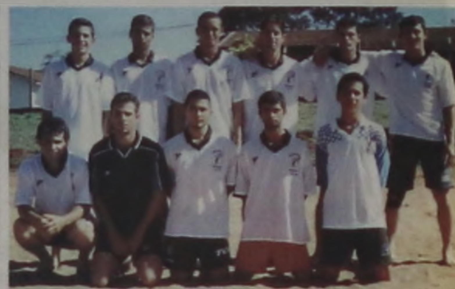
Equipe Unidos-vice campeã da copa