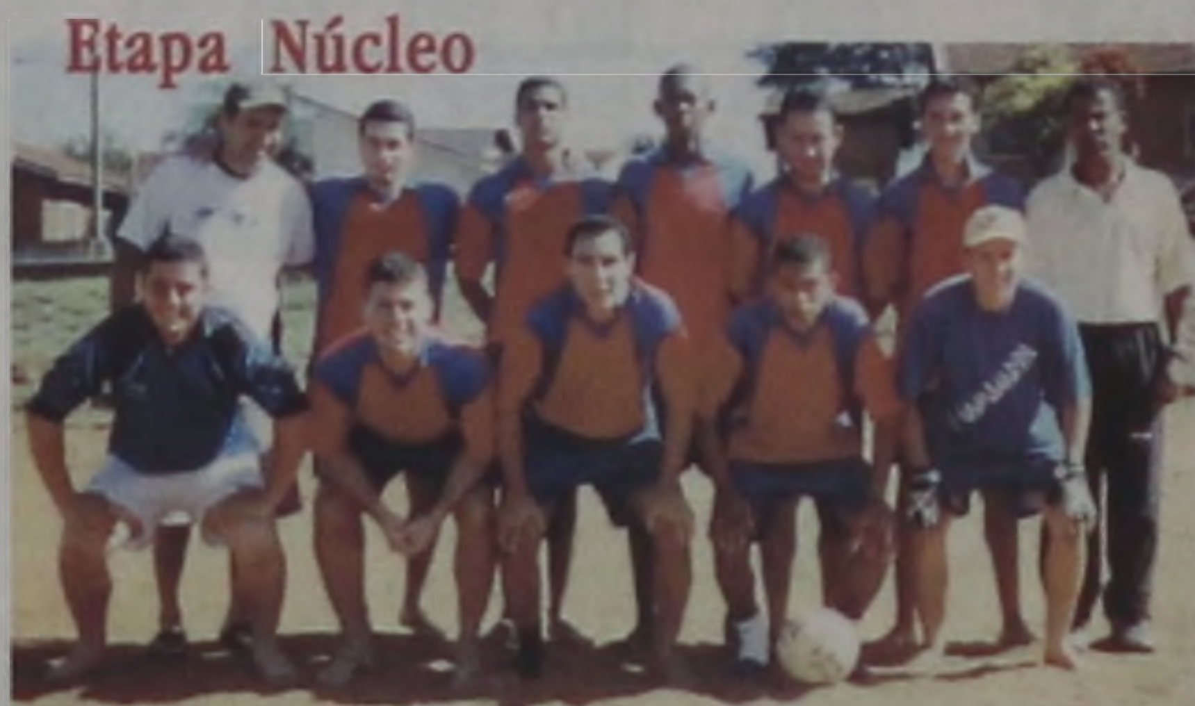
Atletas e comissão técnica da equipe Palestra-campeã da copa