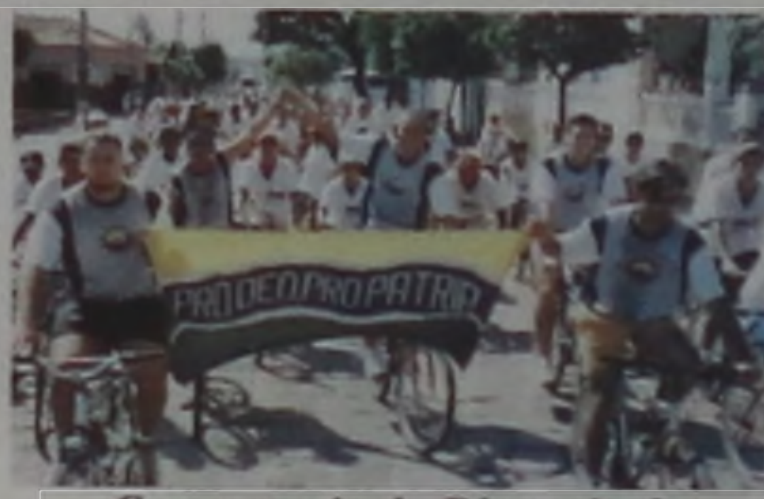
Com o apoio da Diretoria de Esportes e Recreação, cerca de 182 ciclistas de Lençóis e 25 de Borebi percorreram os 27 km que separam as duas cidades