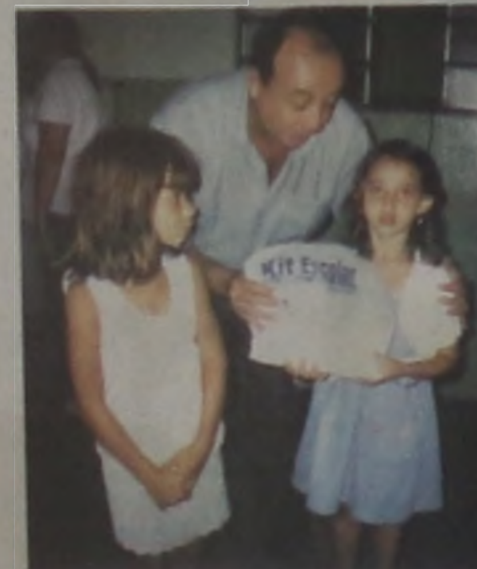
Entrega de uniforme escolar