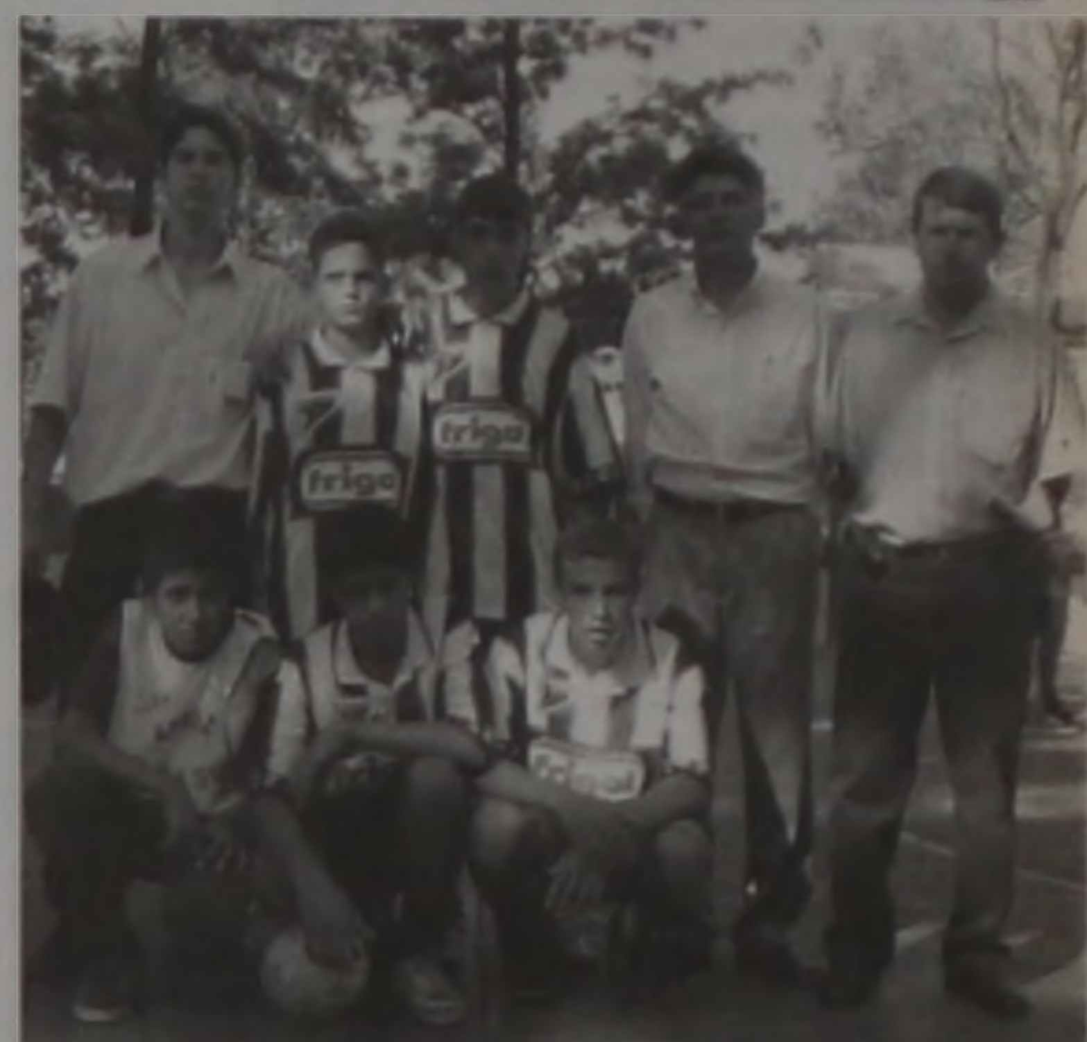
Equipe da Cecap ficou com vice-campeã no futsal

Elétrica com 1 de ouro e 1 de bronze; Larissa com 1 de ouro; Daniel com 4 de prata e 3 de bronze e em último lugar a Marcenaria sem nenhuma medalha.