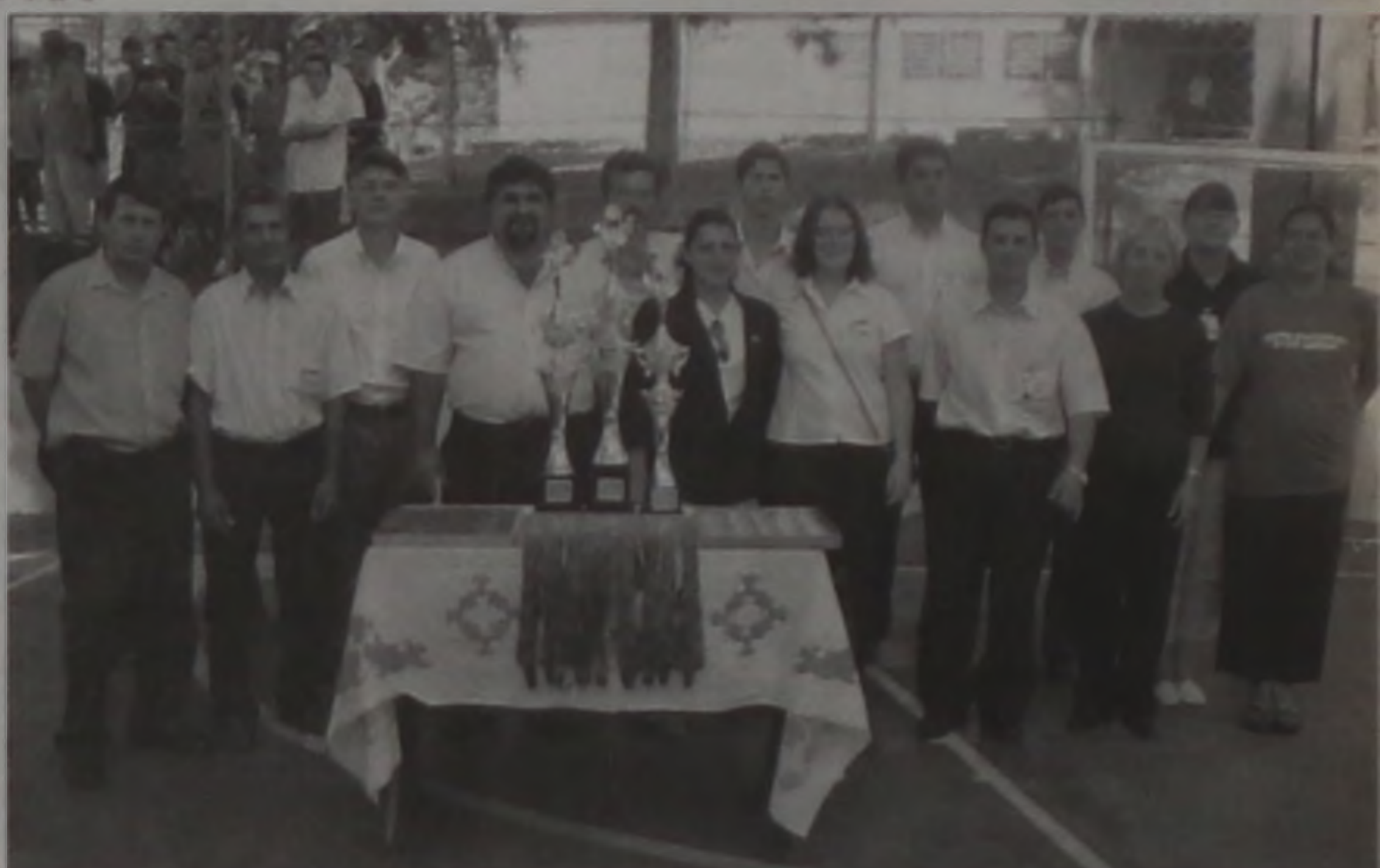
Coordenadores, monitores e organizadores da competição

As equipes Folha Popular, Grêmio Lwart, Santa Luzia, Cruzeiro e Graxaria já estão classificadas para a próxima fase da competição. A Copa/Difusora de Futebol Amador é realizada pela Liga Lençoense de Futebol Amador.