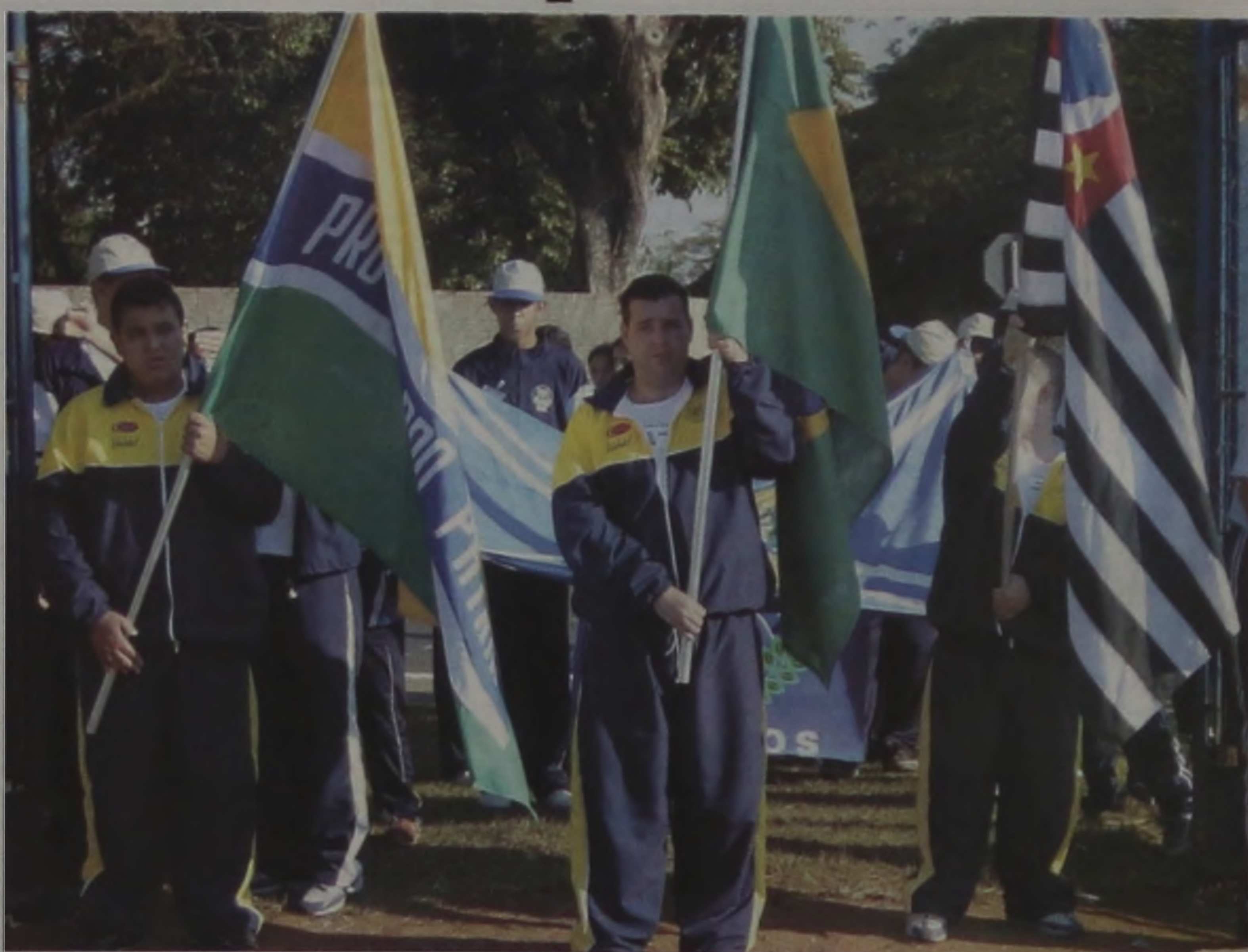
Alunos da Apae de Lençóis na cerimônia de abertura dos jogos

A procura pelo curso é grande, a assistente social da Obra explica que para o próximo semestre vão ser inscritos 15 novos alunos. Os interessados devem ter o ensino fundamental completo e idade igual ou superior de 18 anos. No local, a LBV oferece ainda os cursos de manicure, informática, costura em jornal, corte e costura, pintura, idioma japonês e desenho. O endereço do Centro Comunitário e Educacional da Legião da Boa Vontade, em Bauru, é Rua Alberto Paulovich, 2-58, Mary Dota, e o telefone para contato (14) 239-3956.