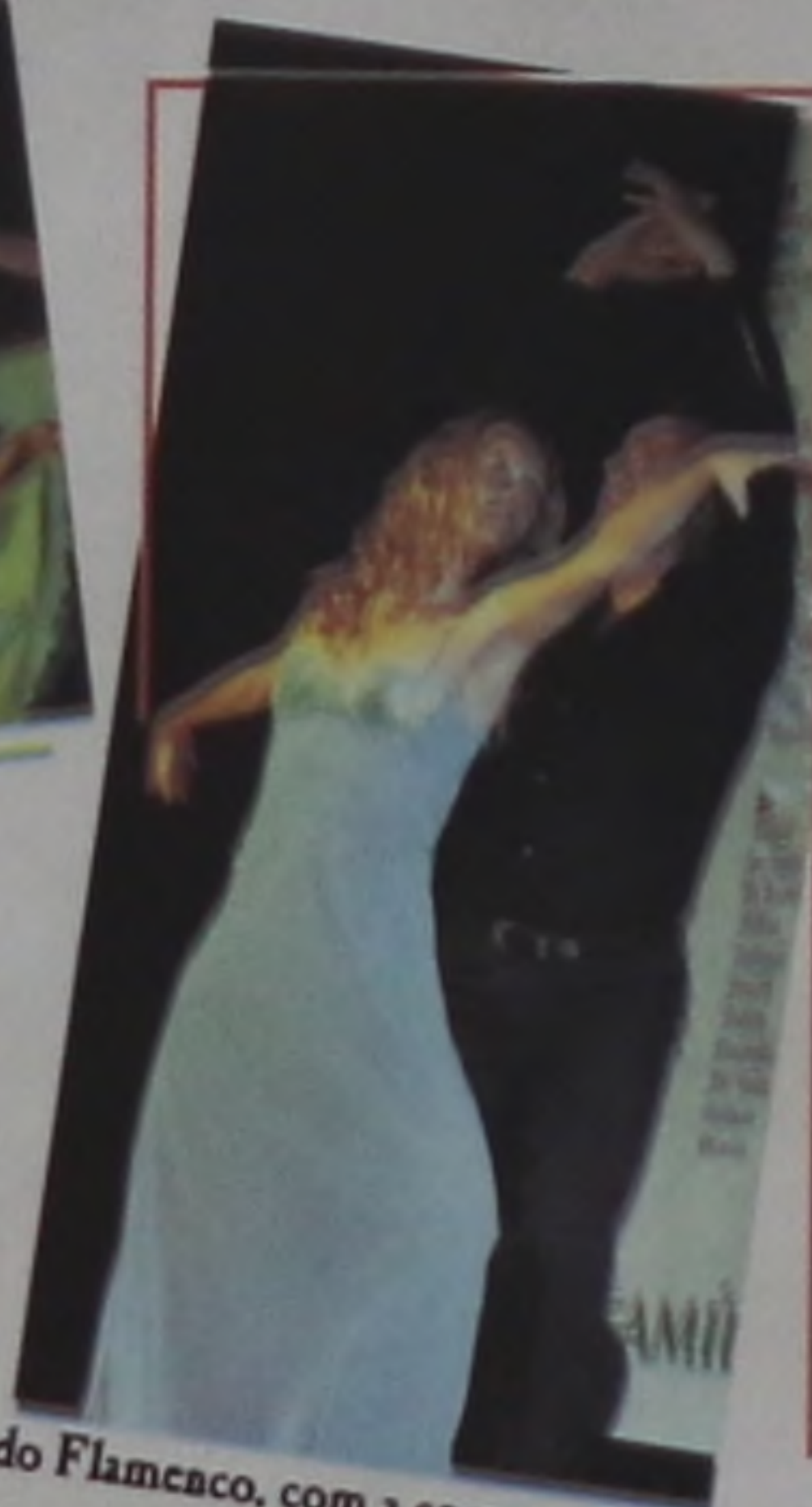
Tablado Flamenco, com a coreografia Luna