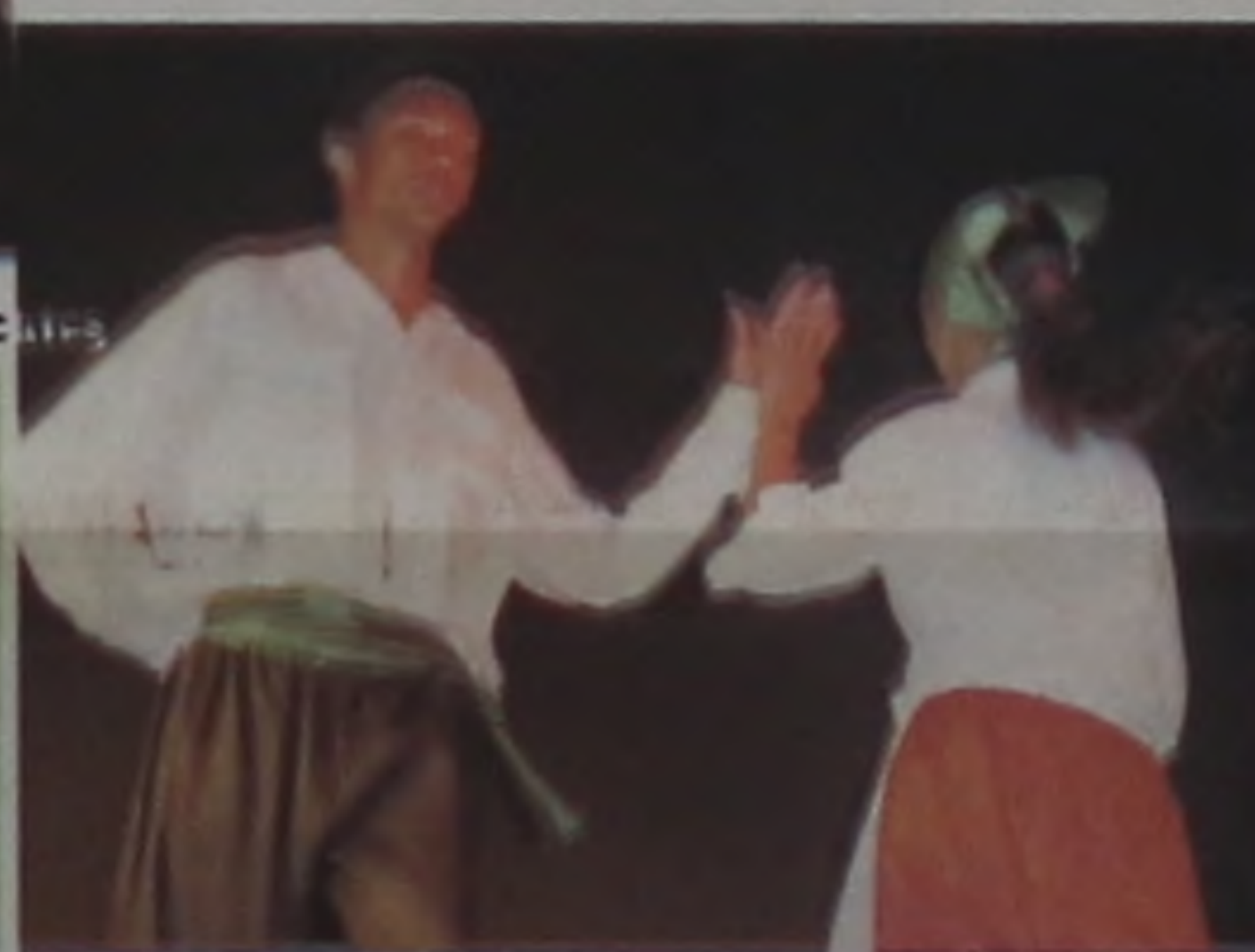
O grupo Passos em Movimento