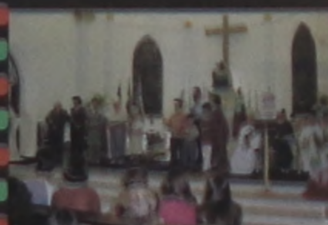
A FÉRIA EM HONRA ÀS FAMÍLIAS ITALIANAS