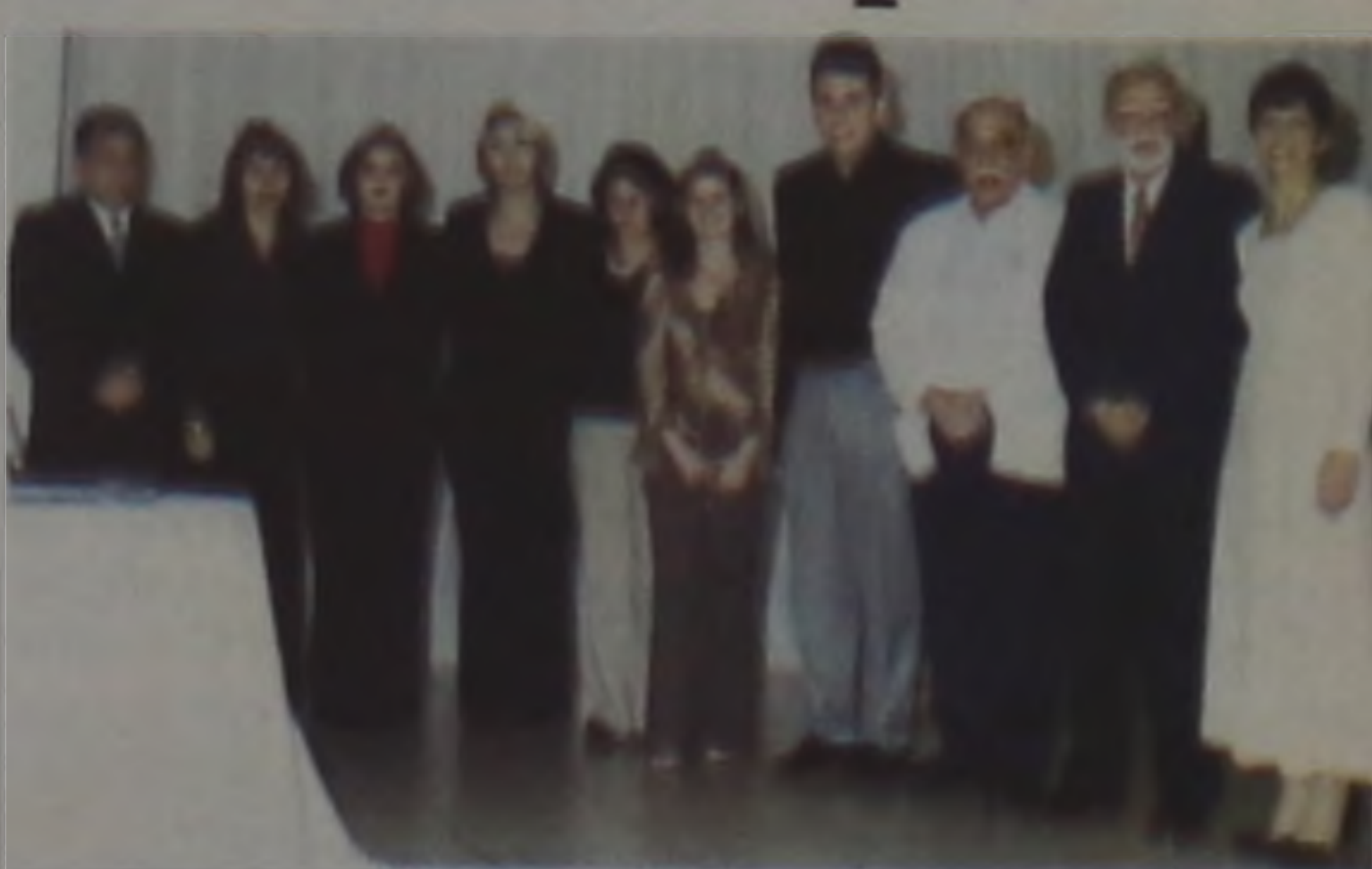
A equipe do Escritório Contábil Lençóis agora trabalhando em parceria com a CEF

O Escritório Contábil Lençóis ofereceu um jantar, na última sexta, a todos os seus clientes, para apresentar sua parceria com a Caixa Econômica Federal, que promete maior agilidade nos processos