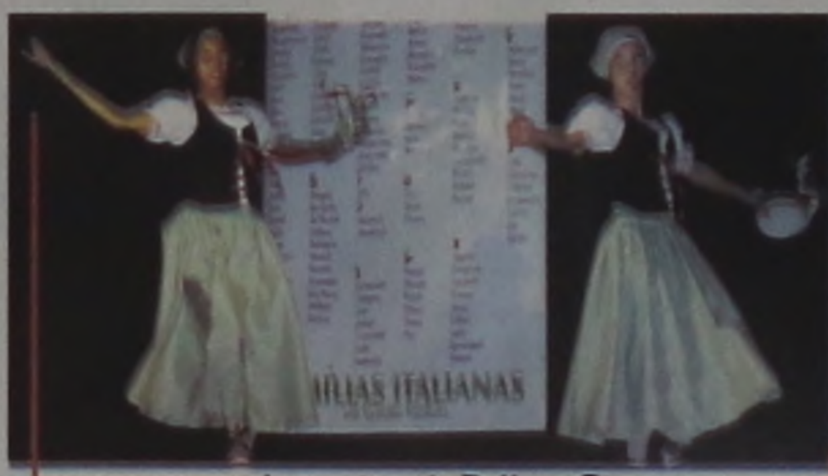
As meninas do Ballet e Cia