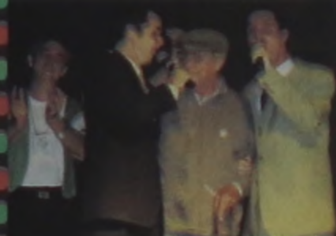
GIOVANNI DE ENILDO E DA DANCING DE LA ITALI