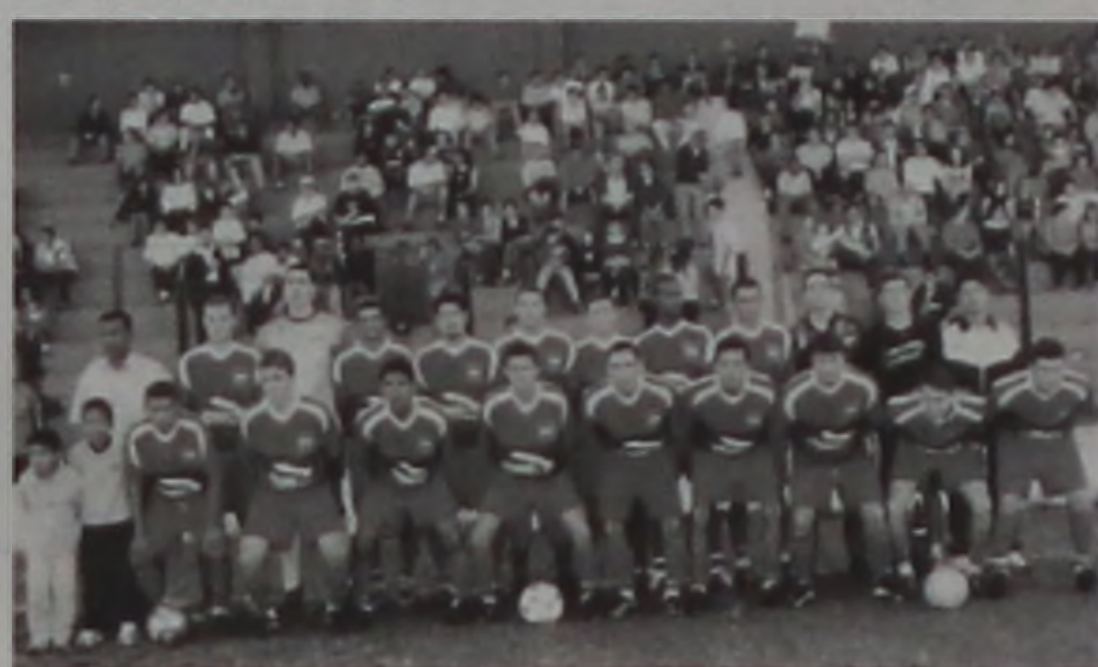
Equipe Palestra campeã da Copa Difusora, agora luta pelo título no Amador

A primeira rodada marca para amanhã os seguintes jogos: Palestra x Santa Luzia às 10h em Alfredo Guedes;