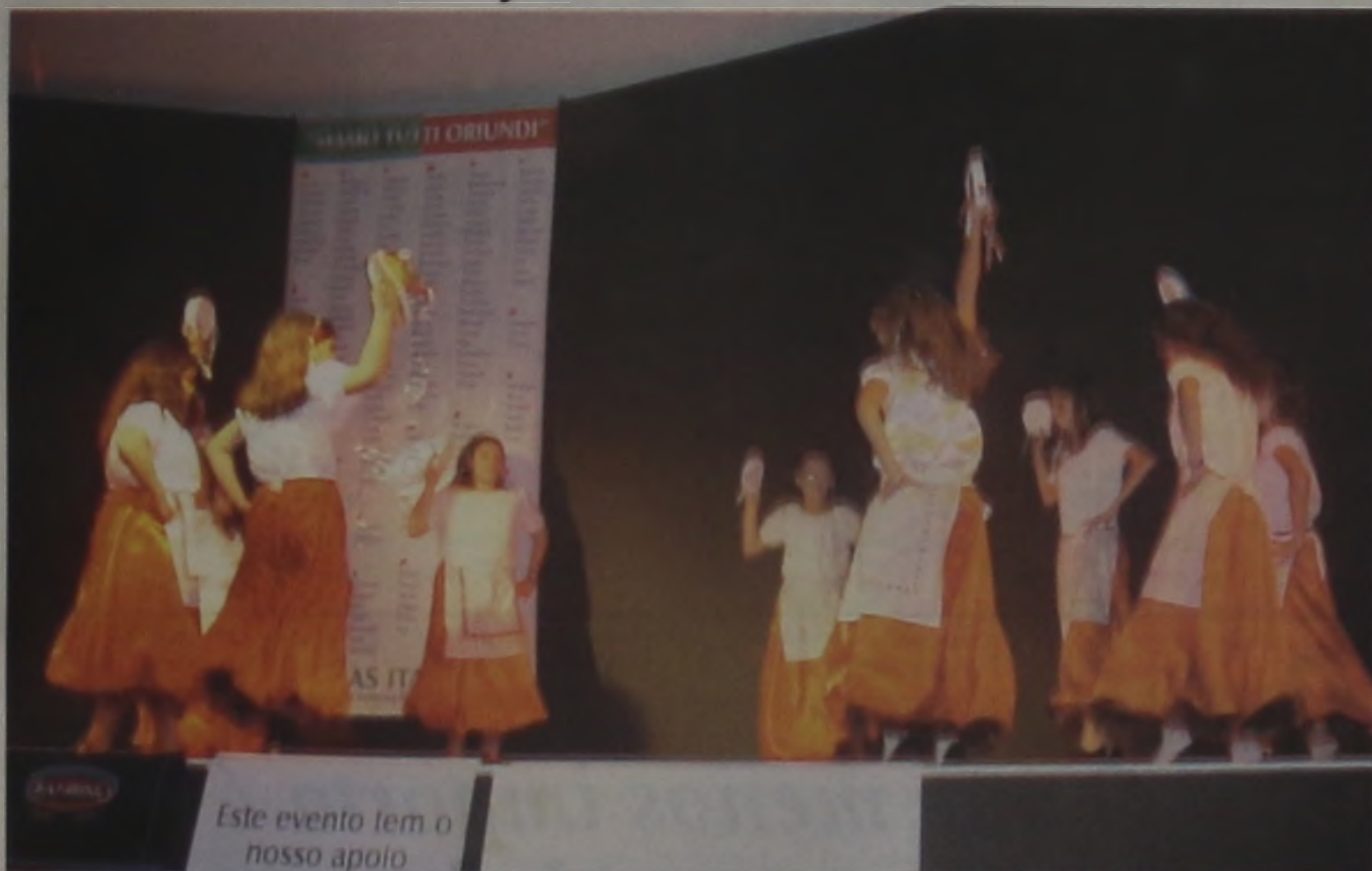
Este evento tem o nosso apoio

O grupo de dança Pé Vermelhos foi uma das atrações da 2ª Semana Italiana