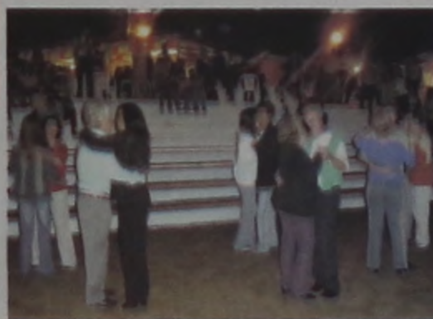
O espírito italiano contagiou à todos