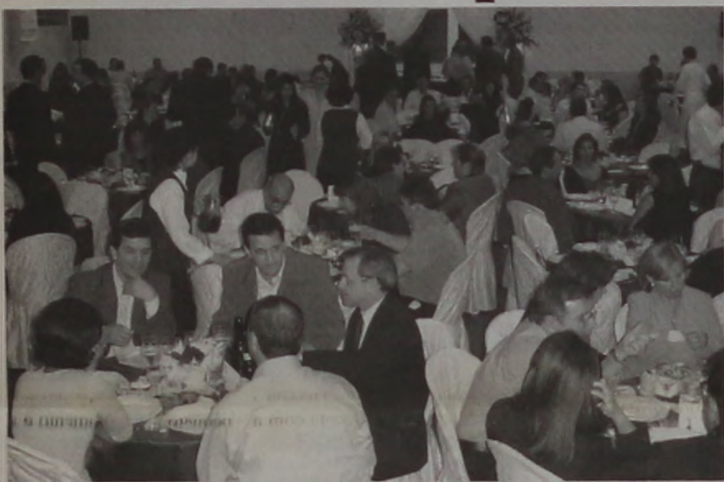
A parceria que agradou aos clientes foi marcada por uma recepção

O Escritório Contábil Lençóis ofereceu um jantar, na última sexta, a todos os seus clientes, para apresentar sua parceria com a Caixa Econômica Federal, que promete maior agilidade nos processos de financiamento realizados por sua clientela.