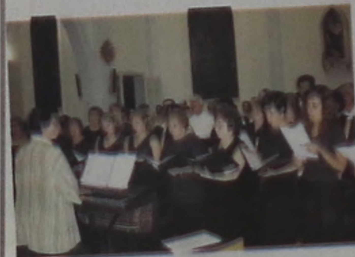
O Coral Dante Alighieri cantou e encantou os presentes