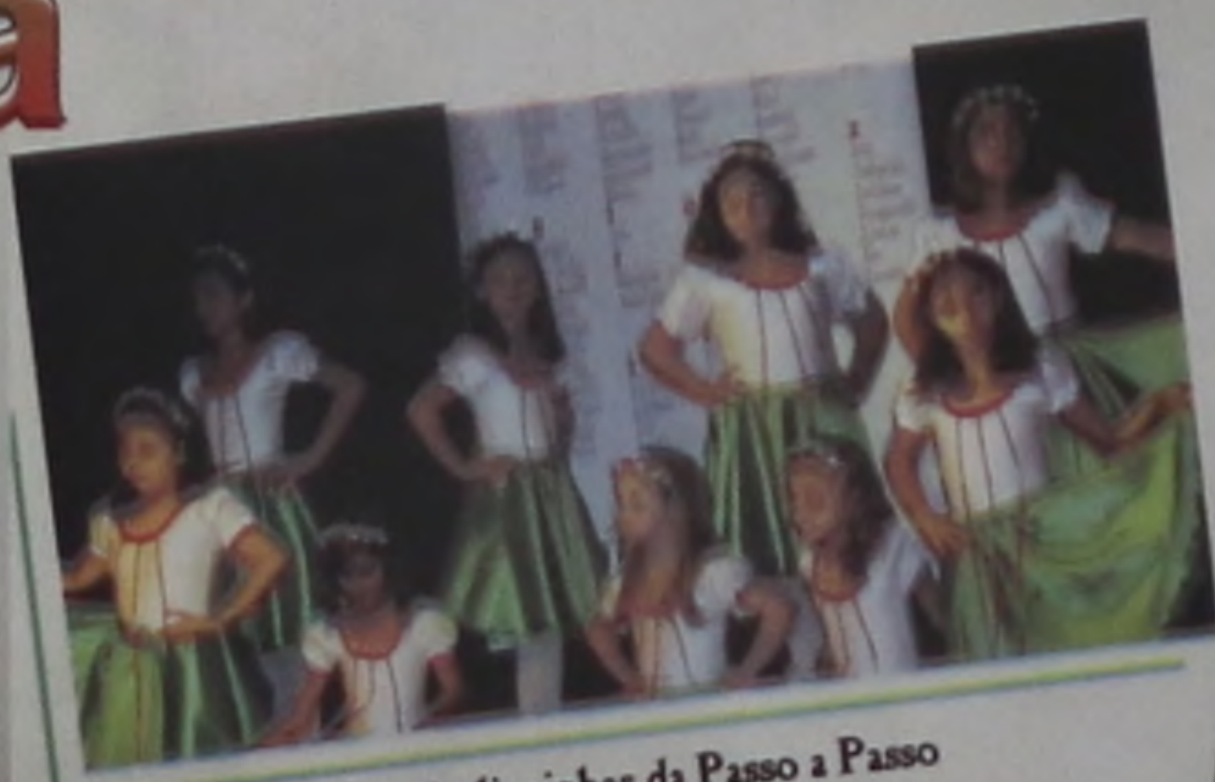
As italianinhas da Passo a Passo