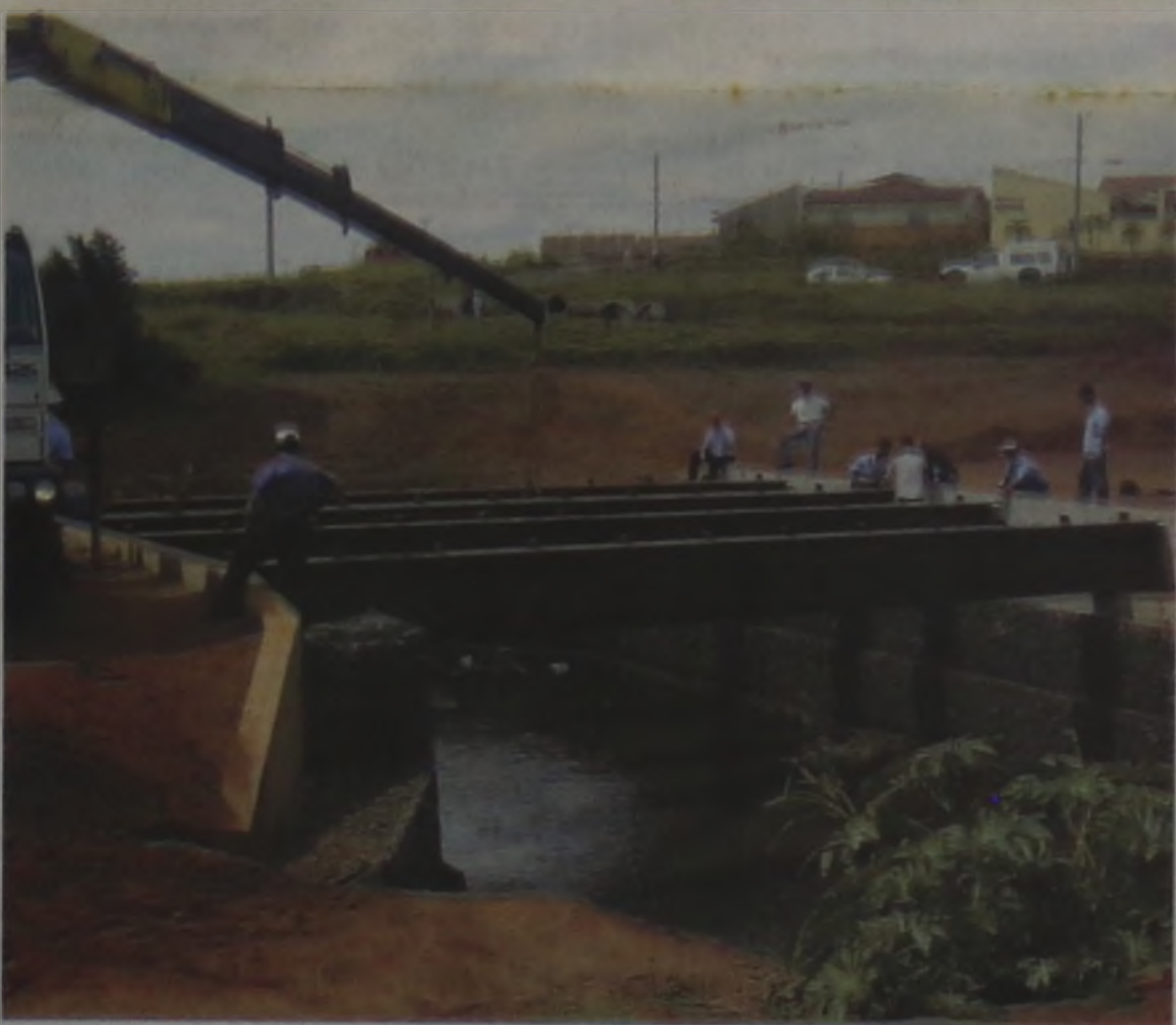
As vigas metálicas foram instaladas na última quinta-feira pela prefeitura

As esperadas vigas metálicas que servirão de sustentação para as novas pontes que darão acesso aos bairros que margeiam o lado di-