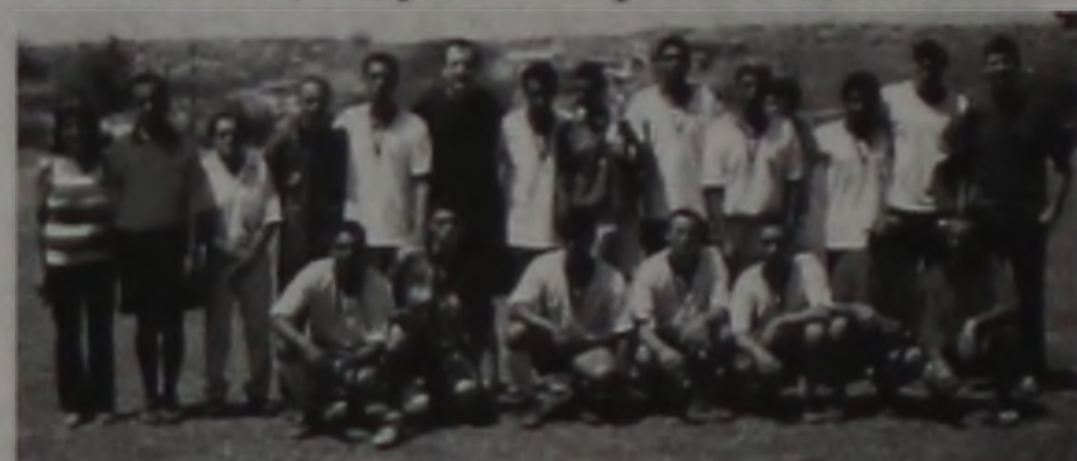
Vila da Prata ficou com o 2º lugar