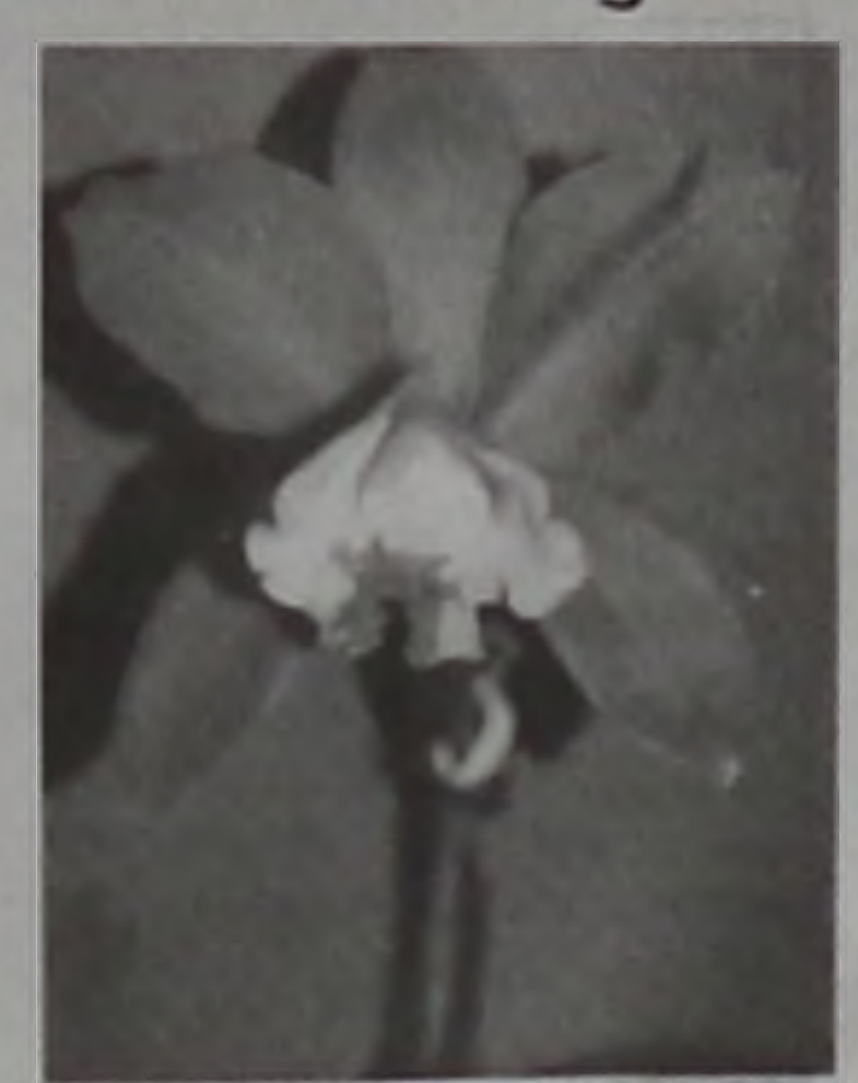
Este e muito mais exemplares poderão ser vistos na exposição