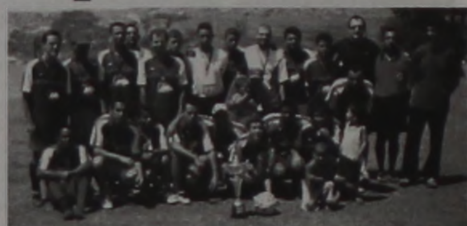
Duratex, campeã do campeonato varzeano