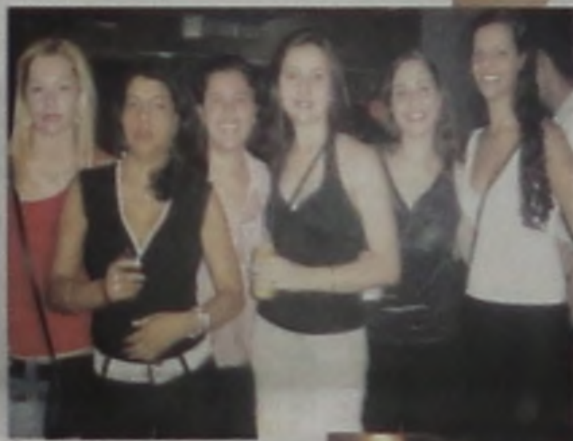
As belas moças nunca perdem o Hobby. Ops! A Hobby