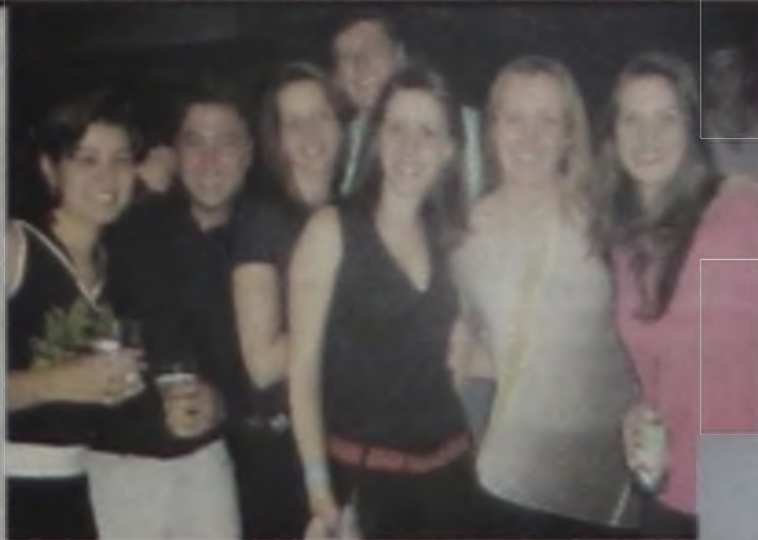
A galera reunida, agora é lei todos os sábados na Hobby Beer