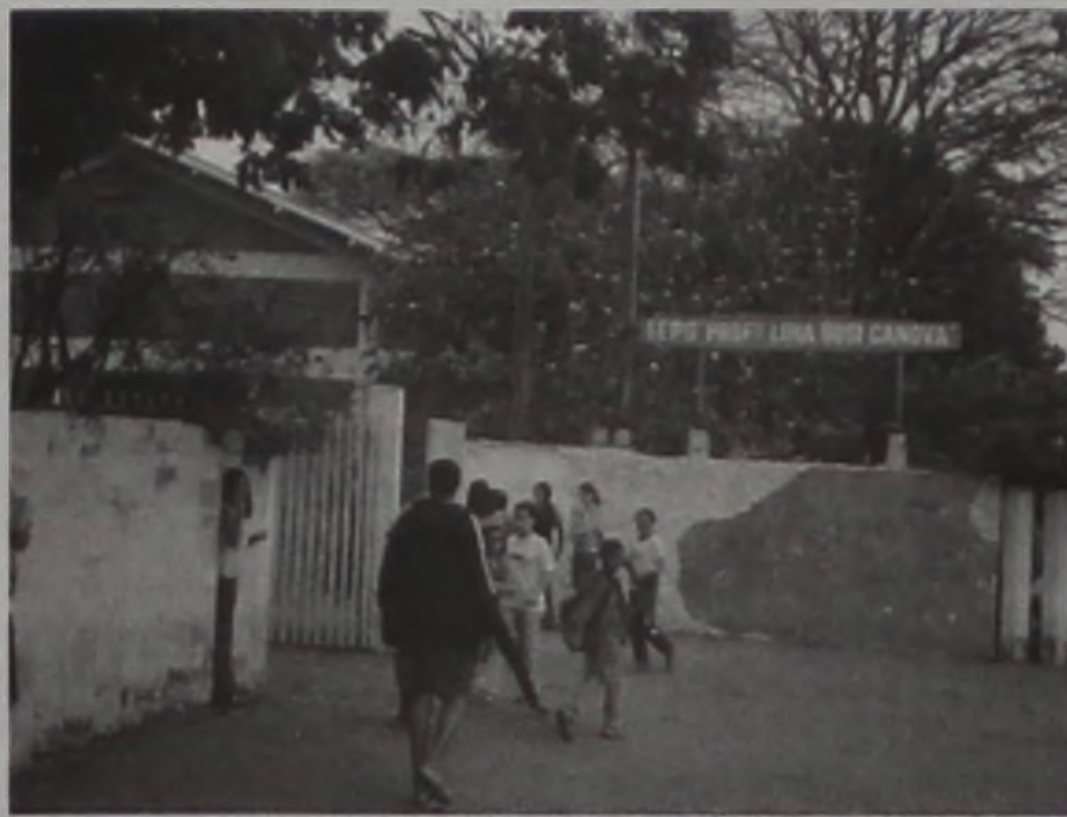
A escola Lina Bosi Canova no jardim Ubirama atende, aproximadamente, 350 pessoas