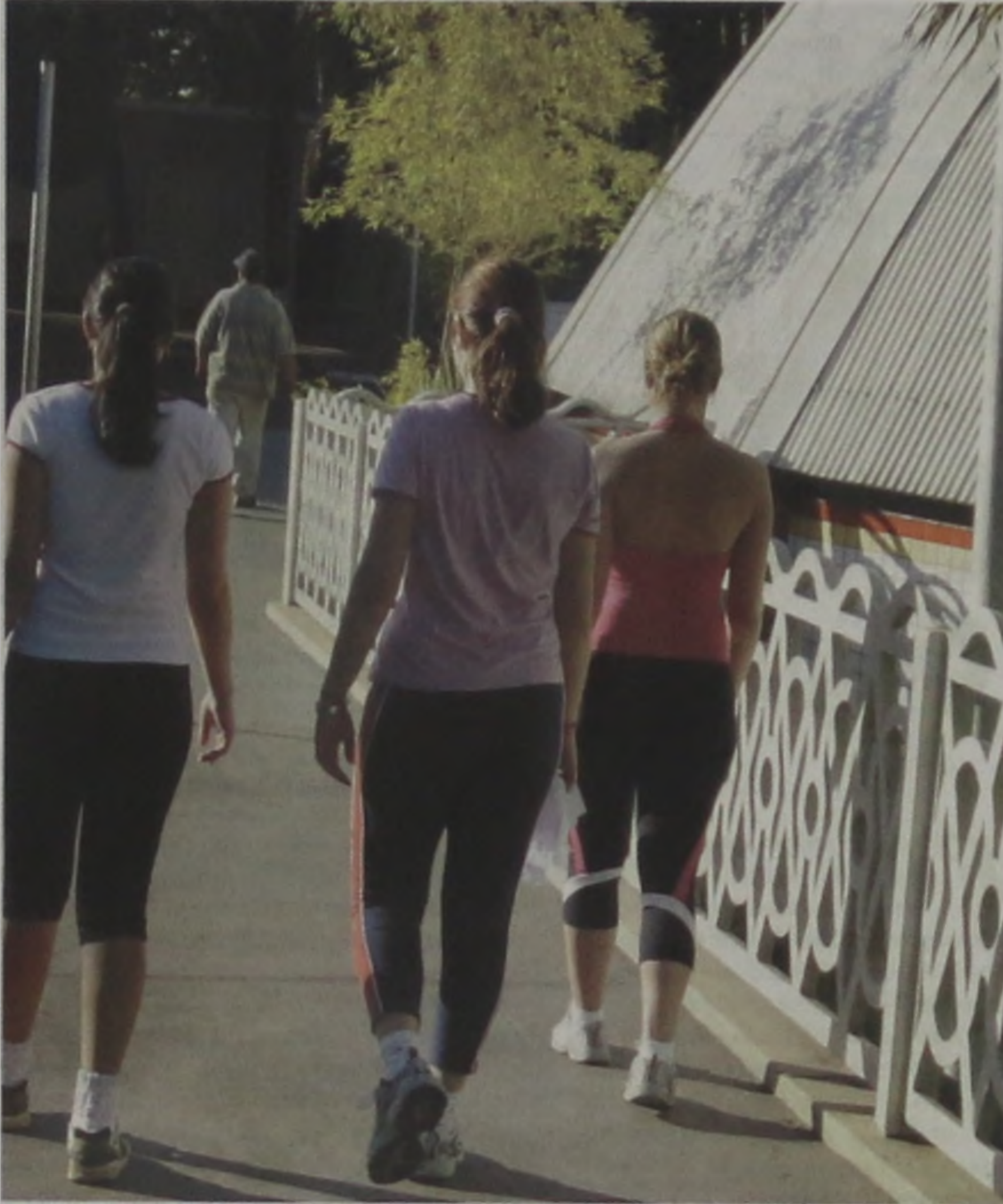
Apesar de impor algum sacrifício para levantar cedo, o horário de verão, além de economizar energia, favorece à vivência e às caminhadas no final da tarde.

O horário de verão deste ano começará à meia-noite e terá 119 dias, com duração até 14 de fevereiro de 2004. Segundo o Ministério de Minas e Energia, ficarão de fora do horário todos os Estados do Norte e Nordeste, além do Mato Grosso. Em 2002, o horário de verão começou no dia 3 de novembro e termi-