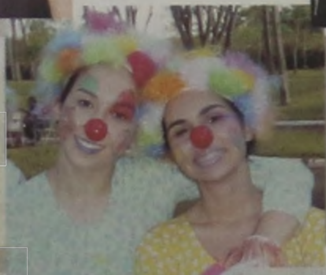
A PALHAÇADA DA TABLADO FLAMENCO ANIMOU A CRIANÇA NA ADC