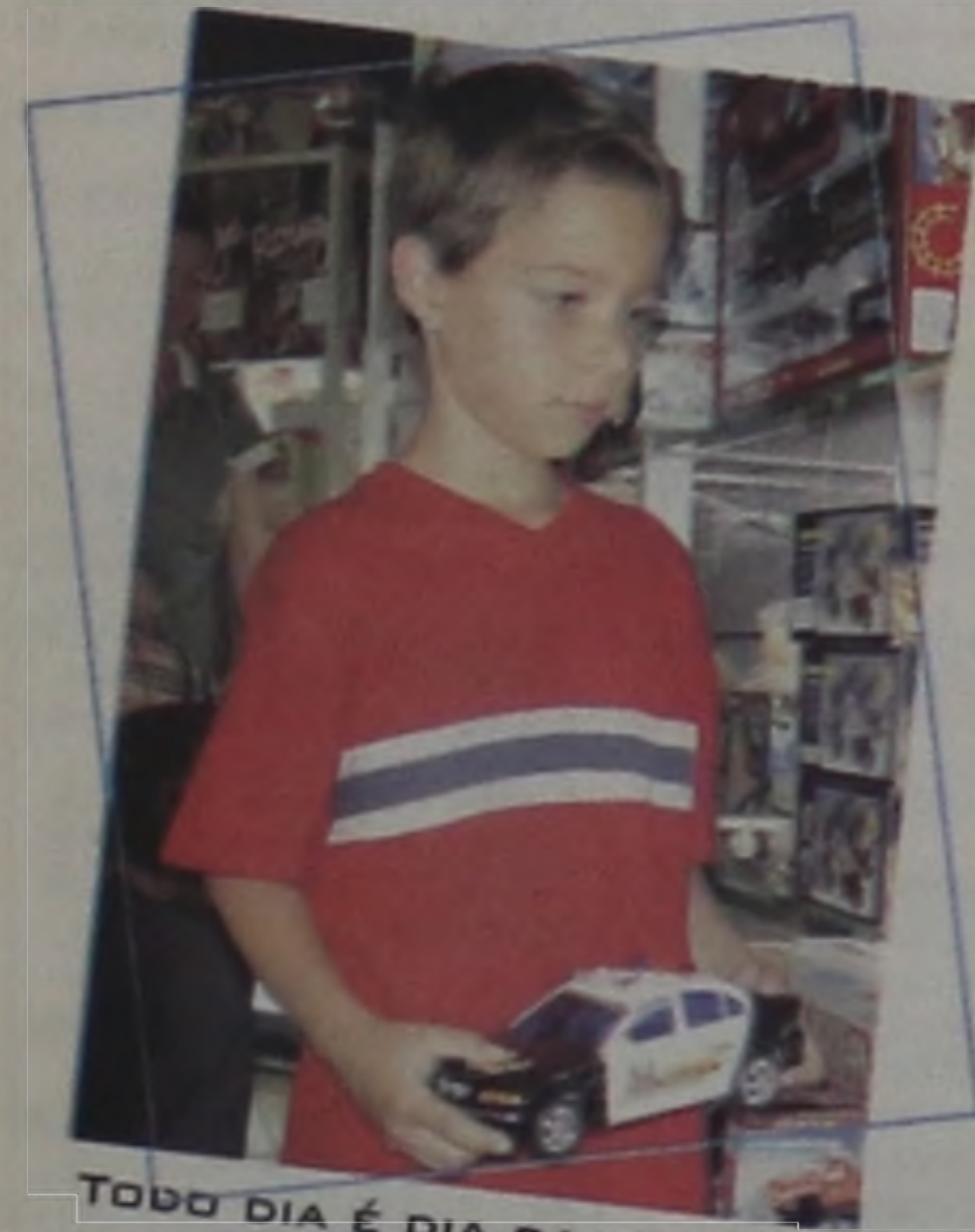
TODO DIA É DIA DA CRIANÇA