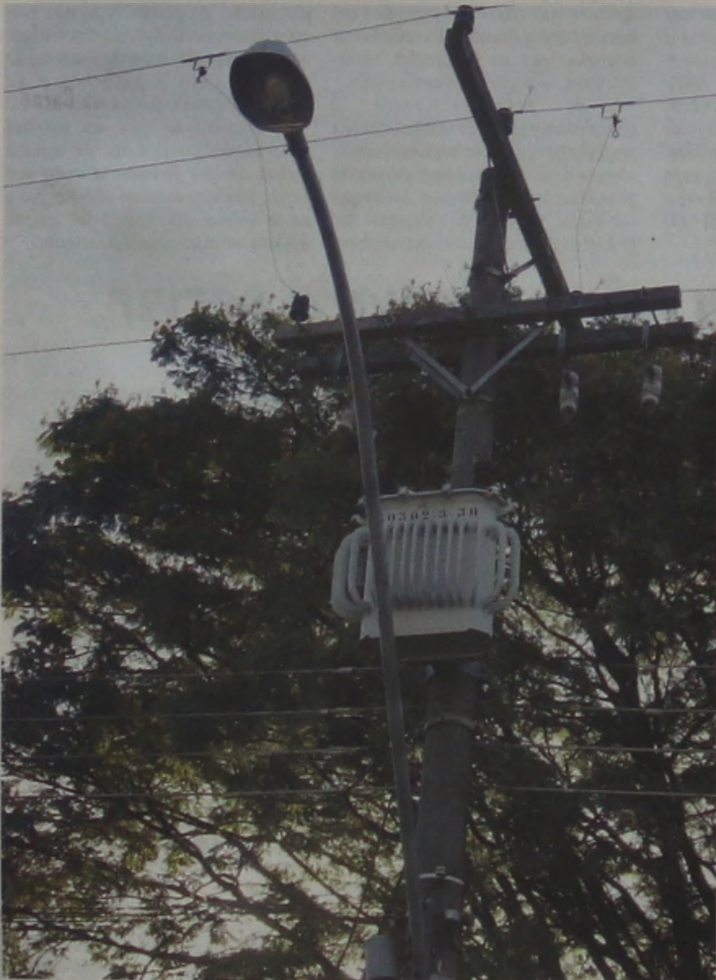
As lâmpadas de mercúrio gastam mais eletricidade e iluminam menos do que as de sódio, que serão colocadas em seu lugar

Convênio firmado entre a Prefeitura e a CPFL possibilitará a troca de 1500 lâmpadas a vapor de mercúrio por outras, de vapor de sódio.