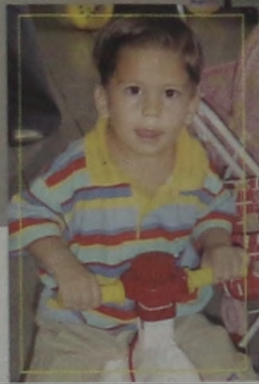
12 DE OUTUBRO A ALEGRIA DE SER CRIANÇA

Neste Final de Busque sua ... Conveniência