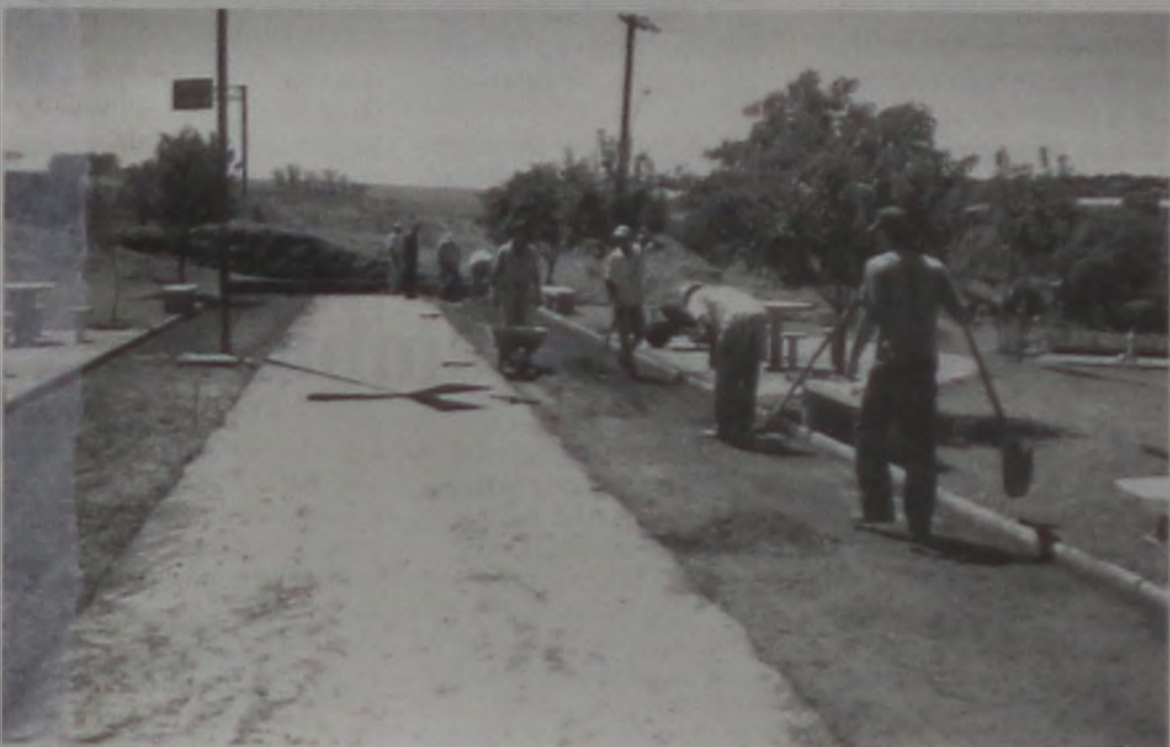
O campo de malha será recapeado com asfalto usinado à quente

A Prefeitura começou essa semana as obras para a recuperação do campo de malha "Otto Repke", entre as ruas Afonso Andretto e Carlos Foganholi, na Vila Repke. Opiso em torno do campo de malha, que apresentava