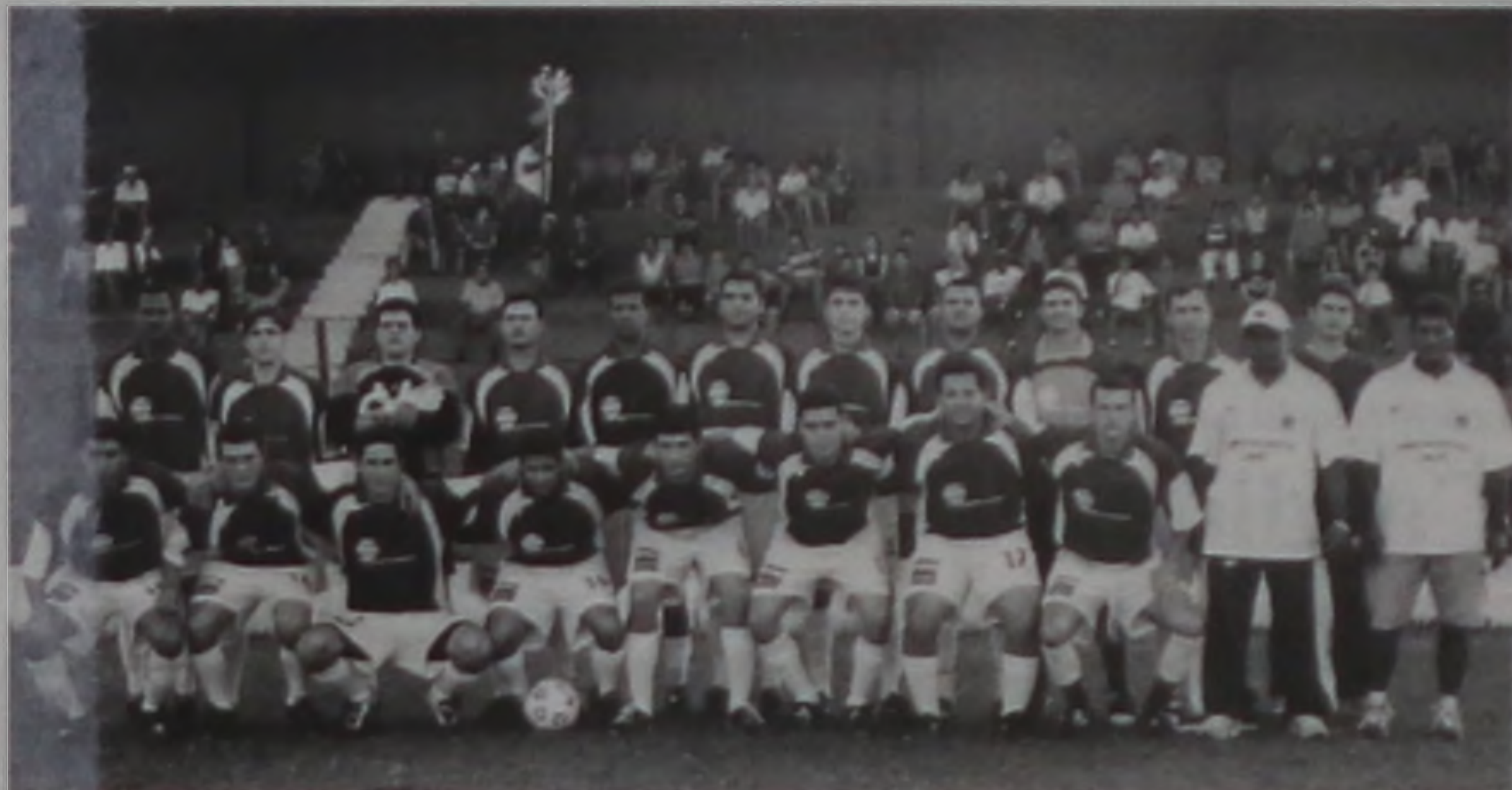
Grêmio Lwart chegou a final após vencer o Palestra no último domingo

As equipes do Grêmio Lwart e Expressinho decidem amanhã, às 14h30, no estádio municipal Archangelo Brega, o título do Campeonato Amador 2003 "Troféu