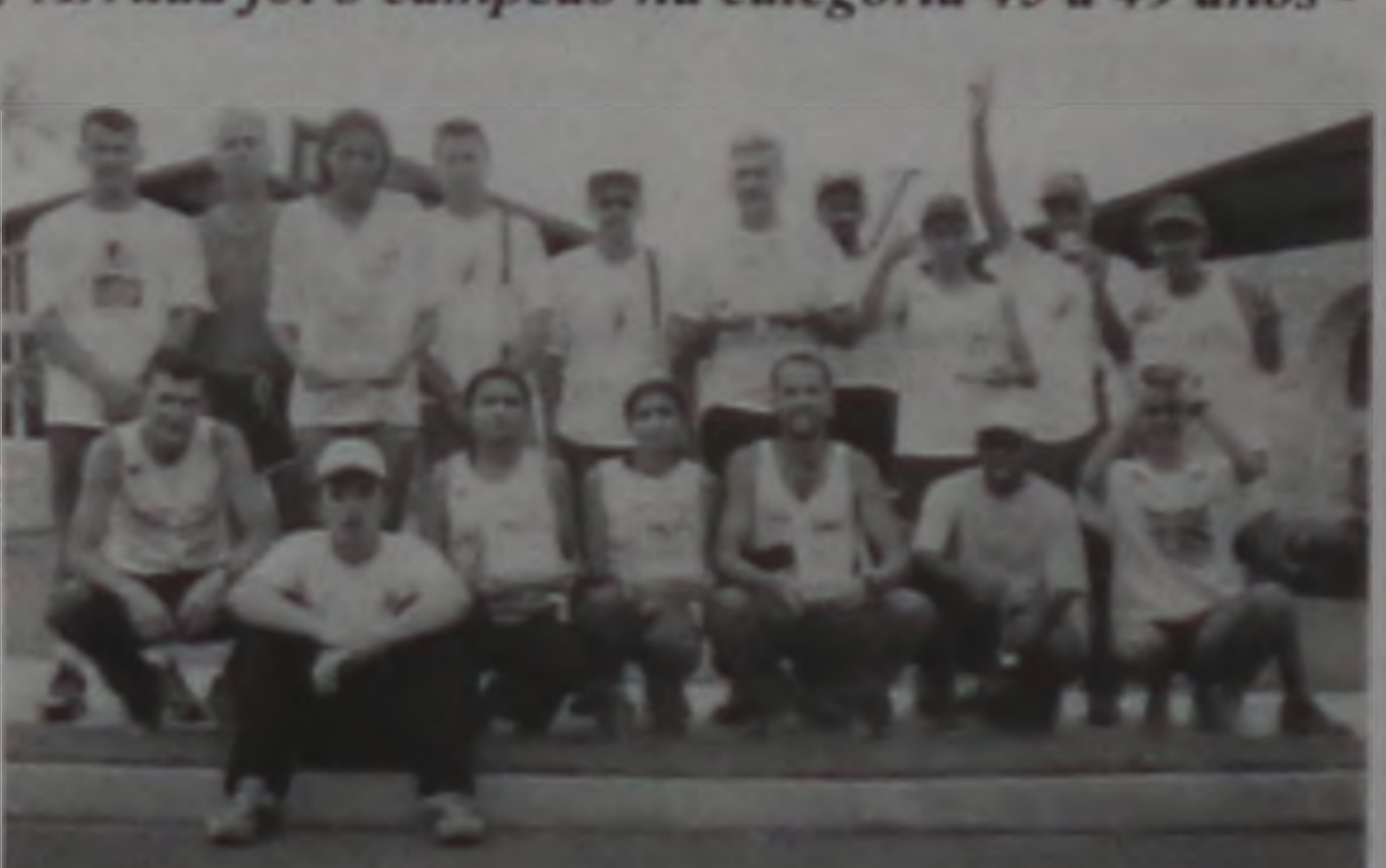
Atletas da UME que foram premiados na competição