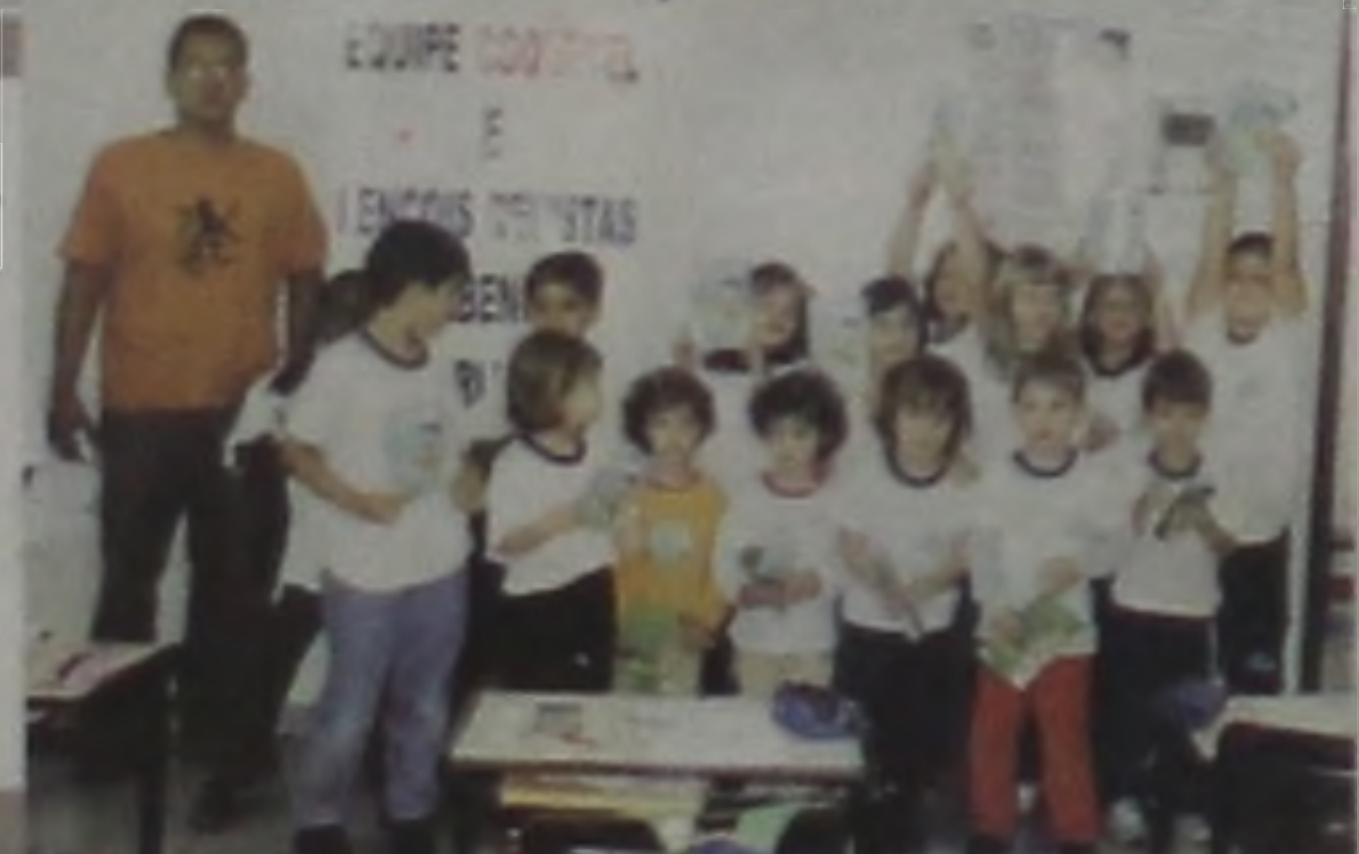
PROMOÇÃO COQUETEL E LENÇÓIS REVISTAS SEMANA DA CRIANÇA