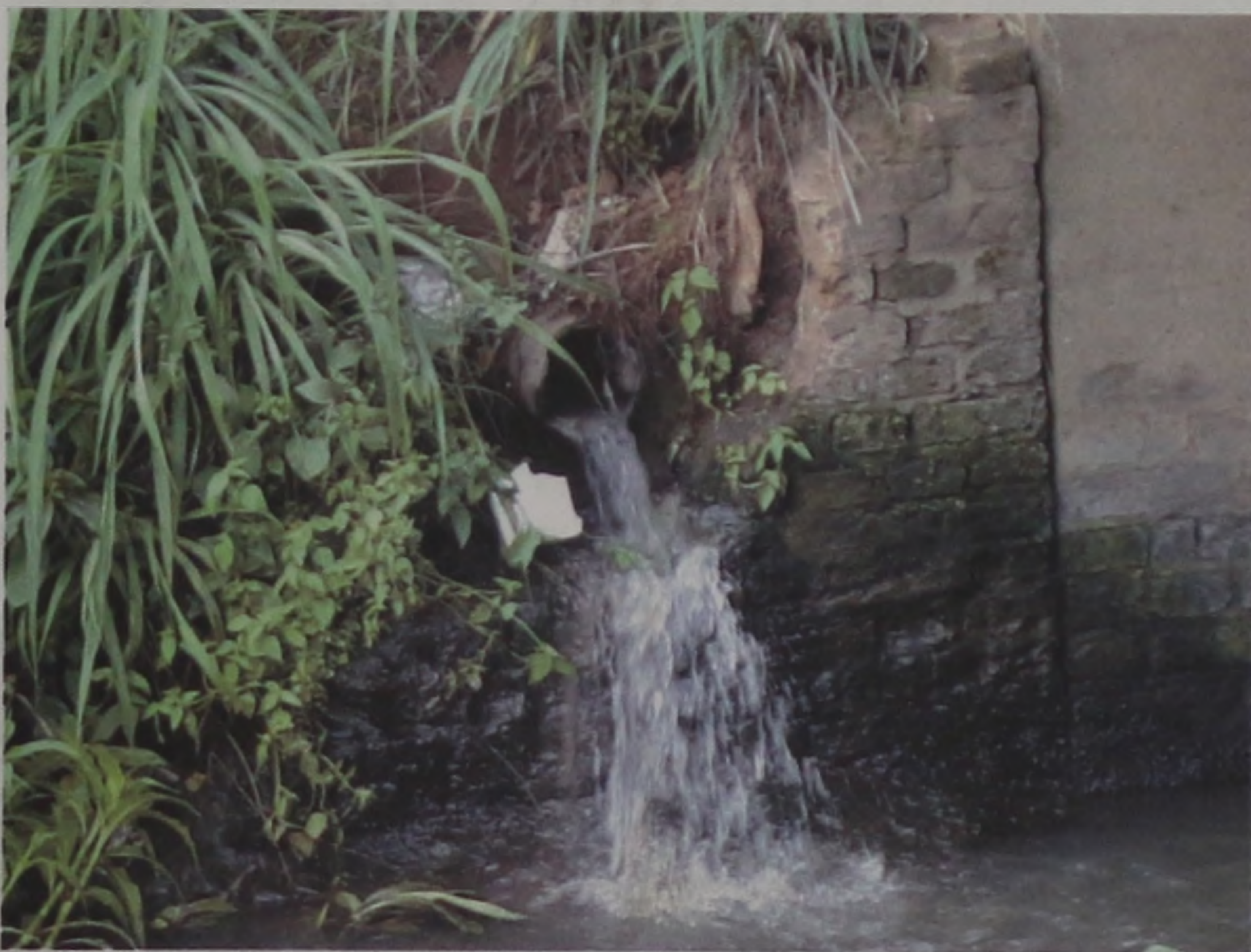
ESGOTO - Dentro de dois anos essa será uma imagem do passado em nossa cidade. Todo o esgoto será remetido à estação de tratamento

Está em curso a implantação do sistema de tratamento de esgoto em nossa cidade. Já se colocou parte dos interceptores junto aos cursos d'água e agora deverá ter início a segunda fase de implantação do projeto que se conclui com o funcionamento da estação de tratamento. A opção feita pelo município é de apenas uma estação em vez de várias. Cada loteador deverá encaminhar recursos ao fundo municipal, constituído para o tratamento. A previsão é que o sistema esteja em funcionamento dentro de dois anos.