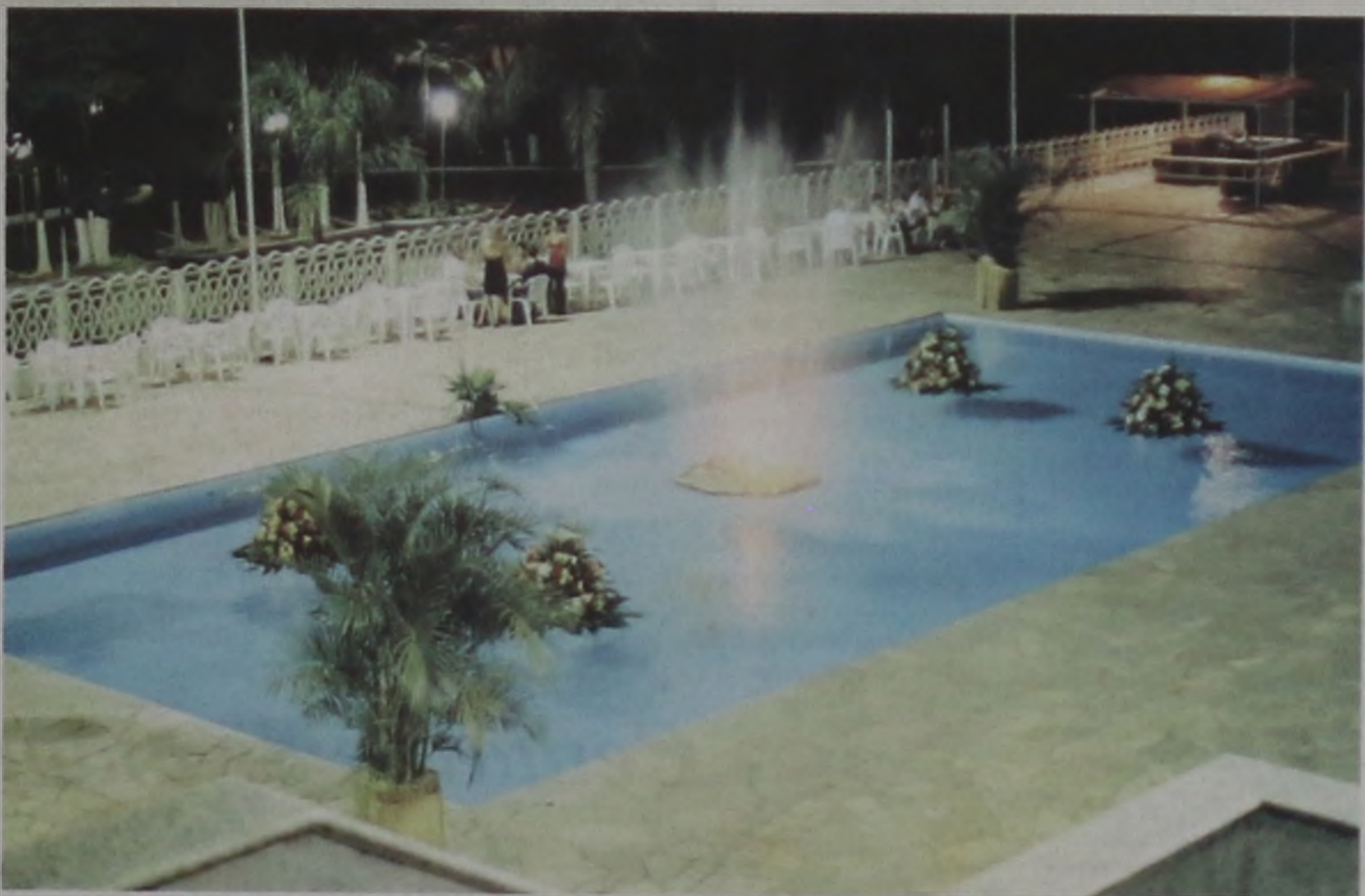
Na piscina, totalmente decorada, o público vai poder dançar animado pela Banda Brasil 2000