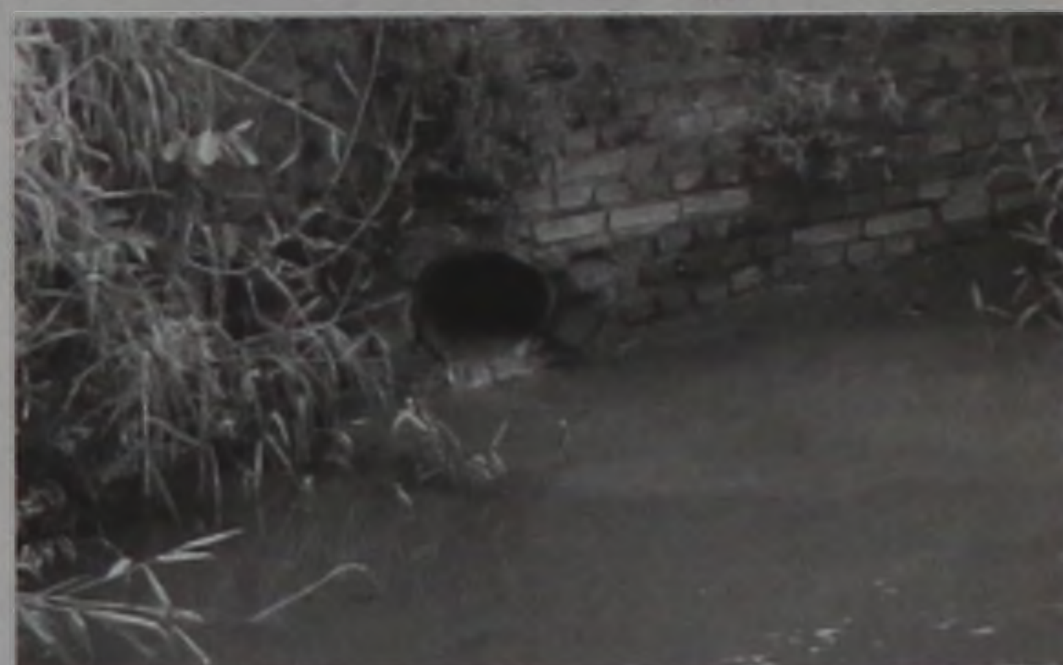
Ministério Público, deu um prazo à Administração Municipal para implementar a ETE