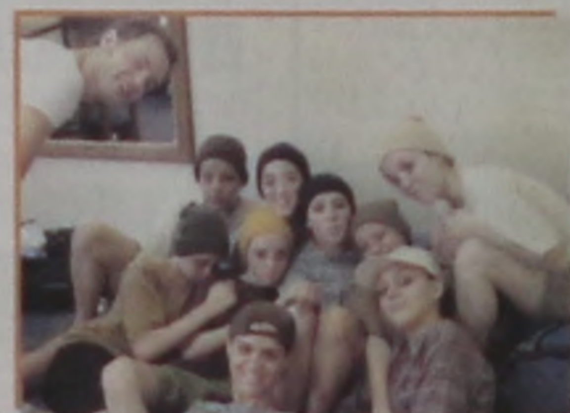
Estrela e o pessoal da academia Roda Viva, de Barra Bonita