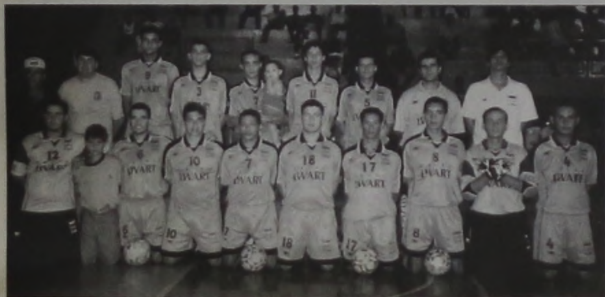
Grêmio Lwart campeão da 3ª Copa Cidade do Livro

A 4ª Copa Regional "Cidade do Livro" já tem data marcada: dia 28 de fevereiro. Durante esta semana a Comissão Organizadora divulgou