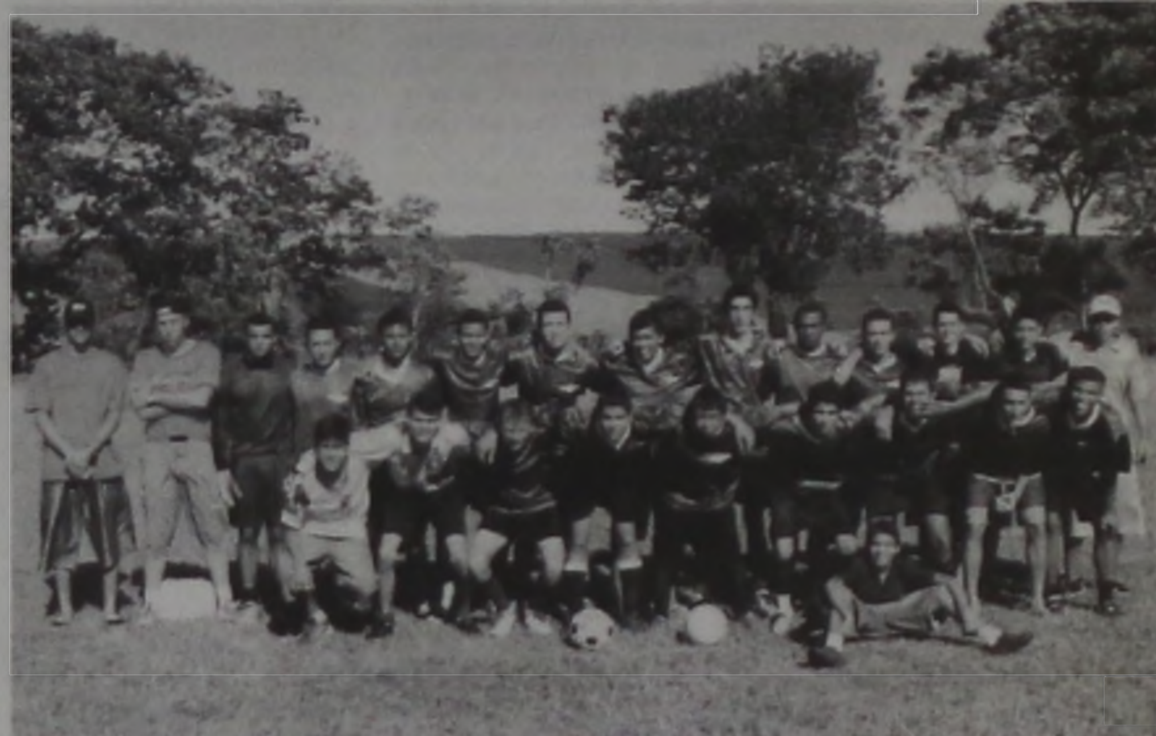
União Primavera ficou com o vice-campeonato

No final do evento houve premiação para os três primeiros colocados, ficando os mesmos classificados para a etapa final, onde se encontrarão os campeões dos diversos bairros da cidade.