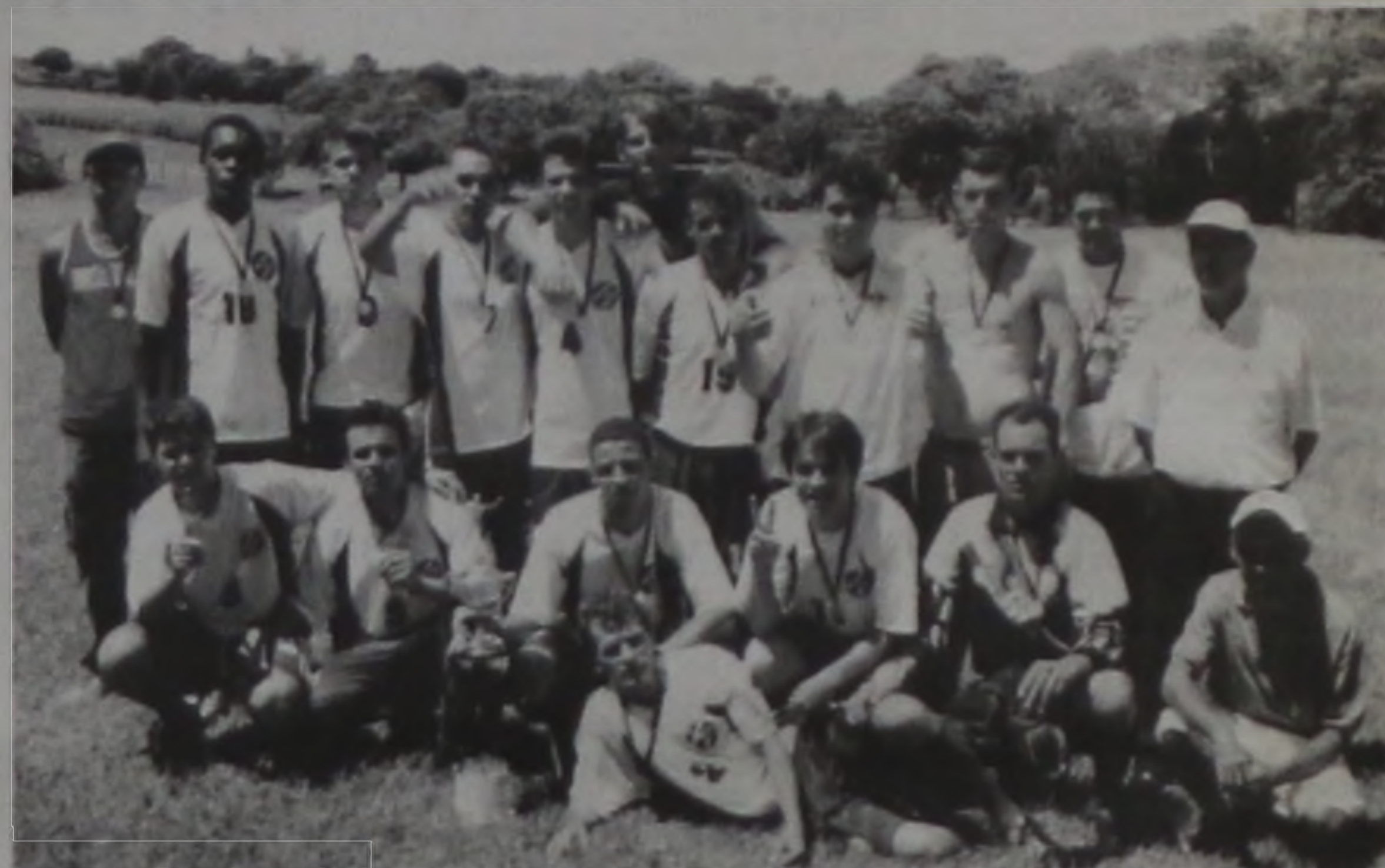
CAU conquistou o título do campeonato Amador Rural