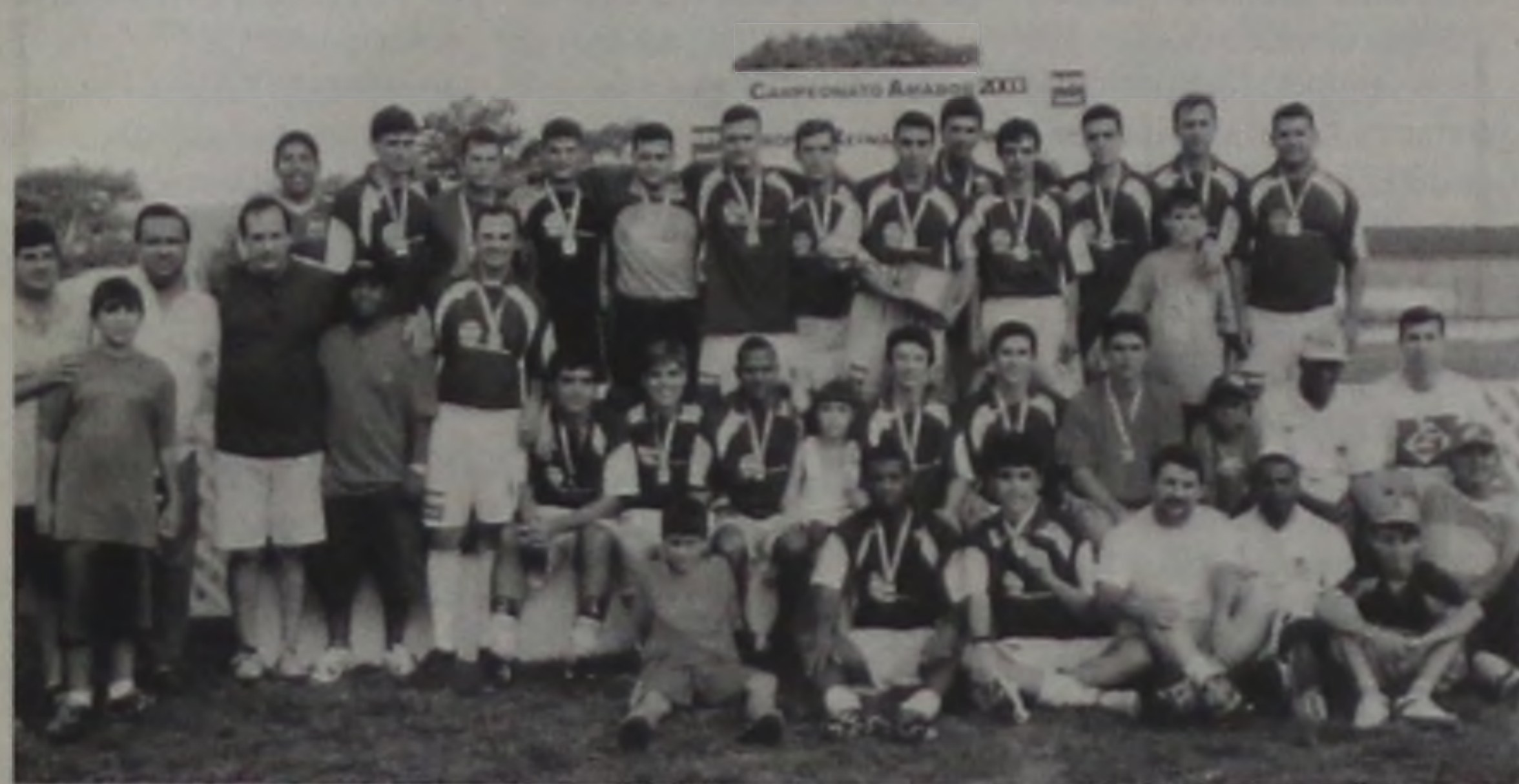
Grêmio Lwart, campeão do amador do ano passado