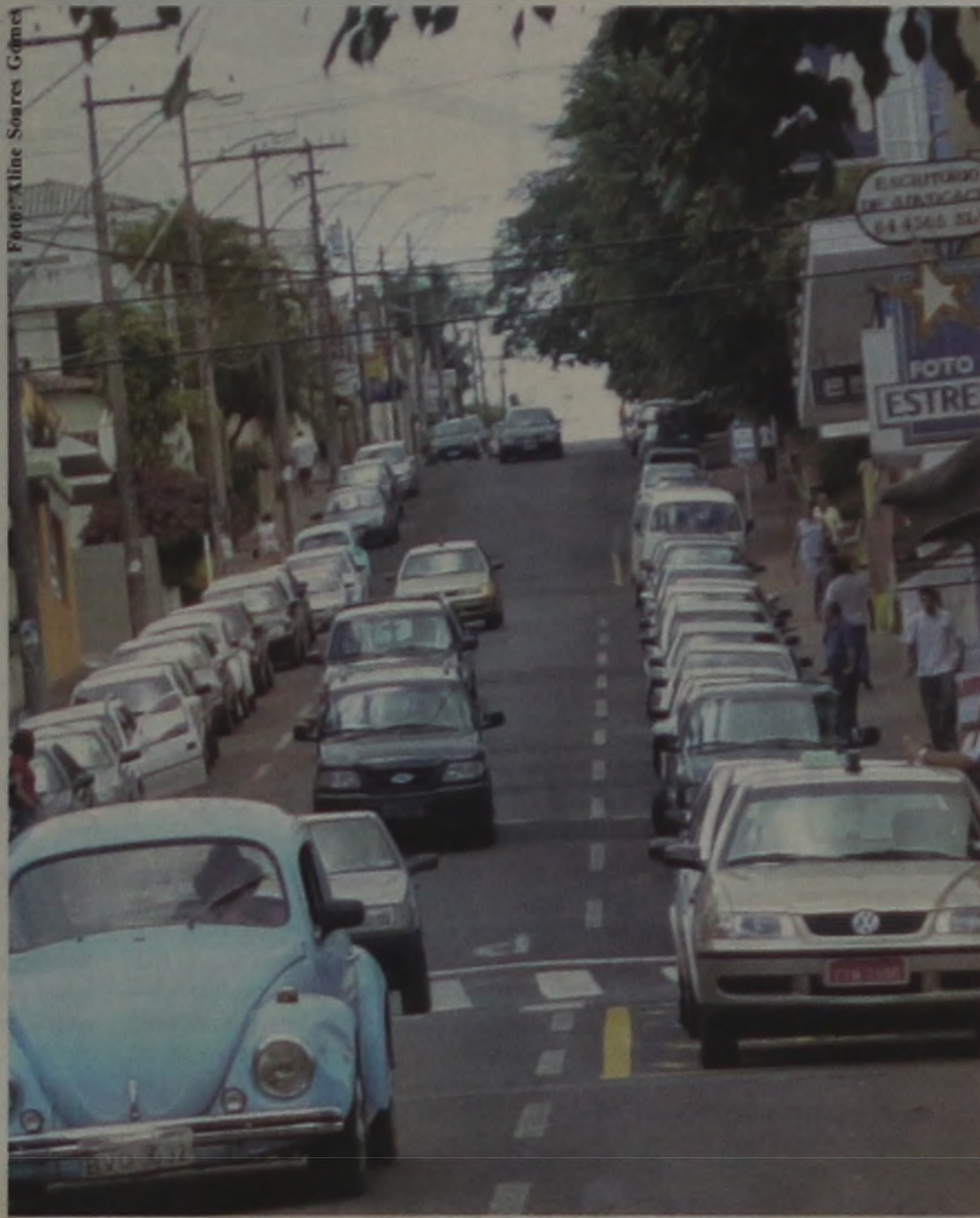
Com a adoção do sistema de Zona Azul, haverá mais rotatividade nas vagas do centro. Maior número de usuários será atendido.

A partir de agora, quem for estacionar nas ruas centrais terá de pagar. Entra em vigor na segunda-feira, dia 15 o sistema de Zona Azul, que funcionará de segunda a sex-