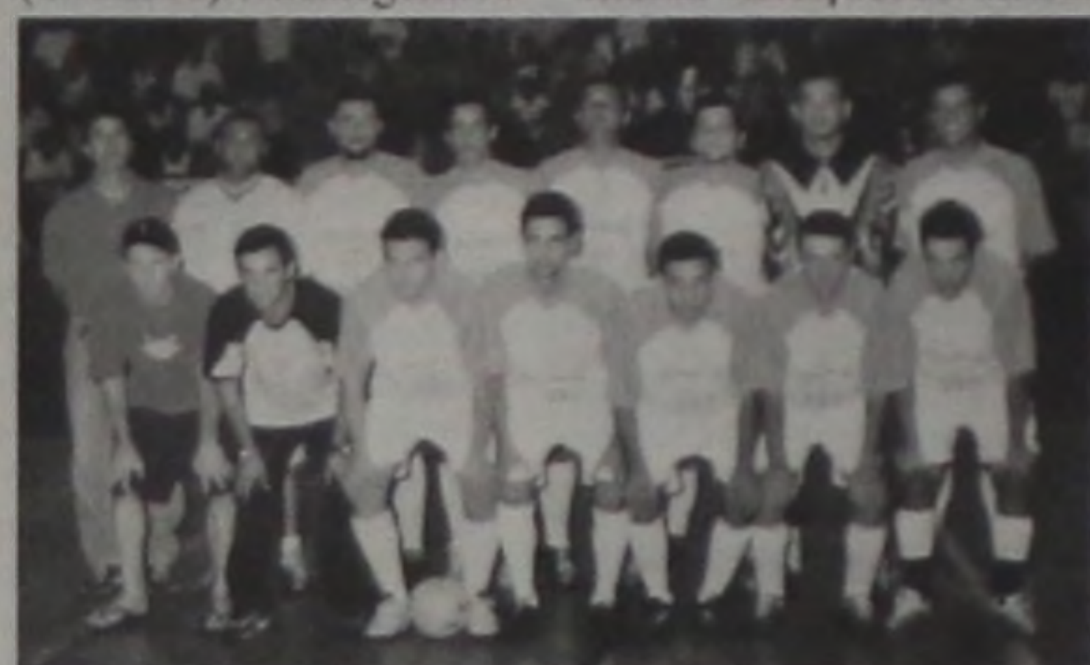
Bayer, campeão da categoria livre