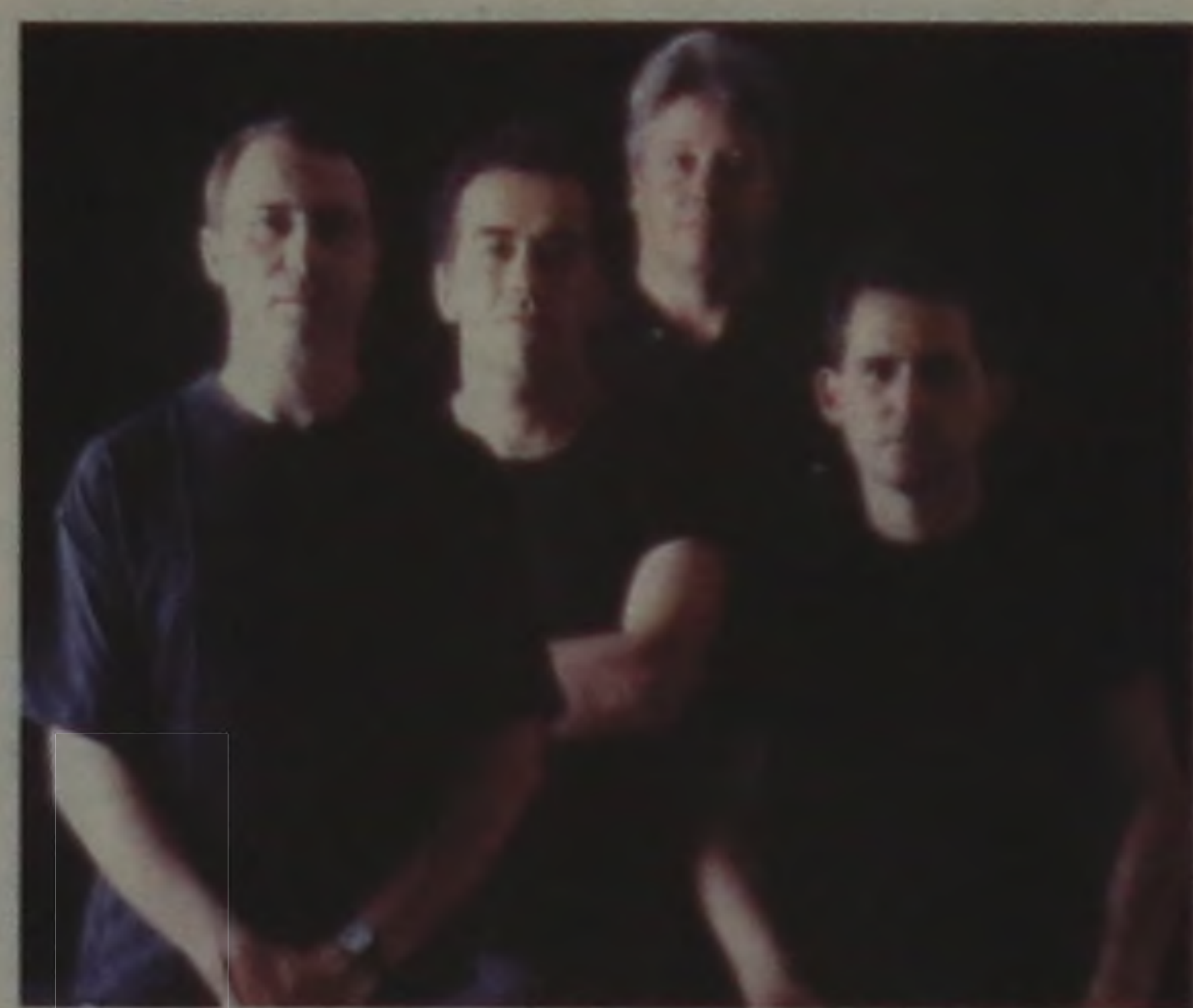
Grupo Pholhas vêm a Lençóis no dia 13