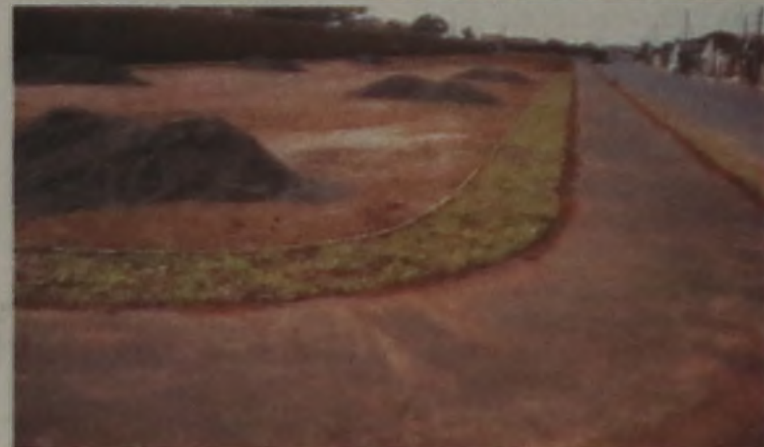
Após as obras, os moradores da Nova Lençóis e bairros adjacentes contarão com uma moderna área de lazer

A Prefeitura concluiu na semana passada, a pista de cooper com 960 metros de extensão no Jardim Nova Lençóis. Esta é a primeira etapa para a construção de uma área de lazer que é construída no quarteirão das ruas dos Chupins, Sabiás e a avenida vereador Herminio Jacon. O projeto prevê a construção de estacionamento com capacidade para 20 veículos, playground e praça para exercícios de aquecimento para os pedestres.