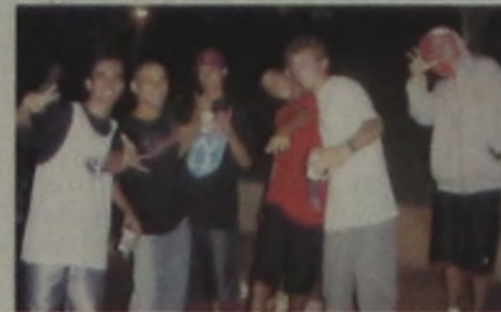
Só no segure puxe e puxe (galera da assistência)