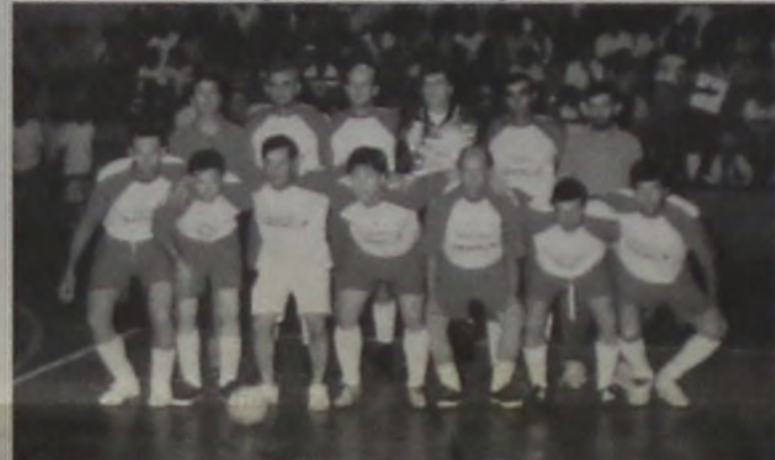
Mega II, campeão da categoria veteranos