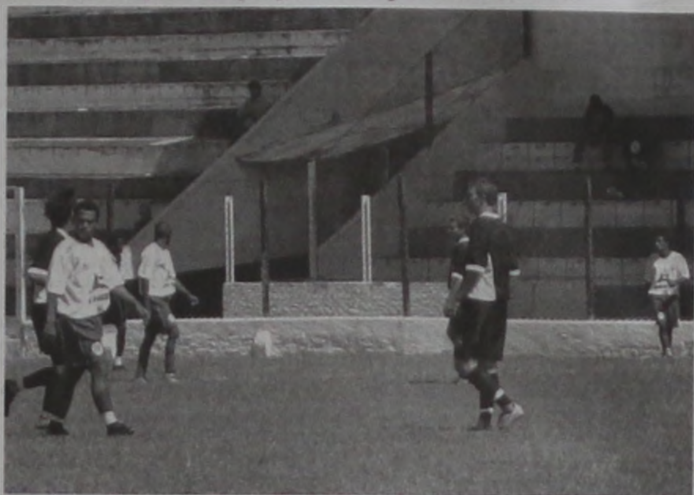
A equipe lençoense viaja para Sumaré, aonde joga contra o time da casa

Na quarta fase, a equipe primeira colocada do grupo nove e a primeira colocada do grupo dez jogam entre si, em turno e retorno, sagrando-se campeã a que somar o maior número de pontos ganhos nesta fase. As duas equipes com maior pontuação em seus grupos sobem para a Série A3 do ano que vem.