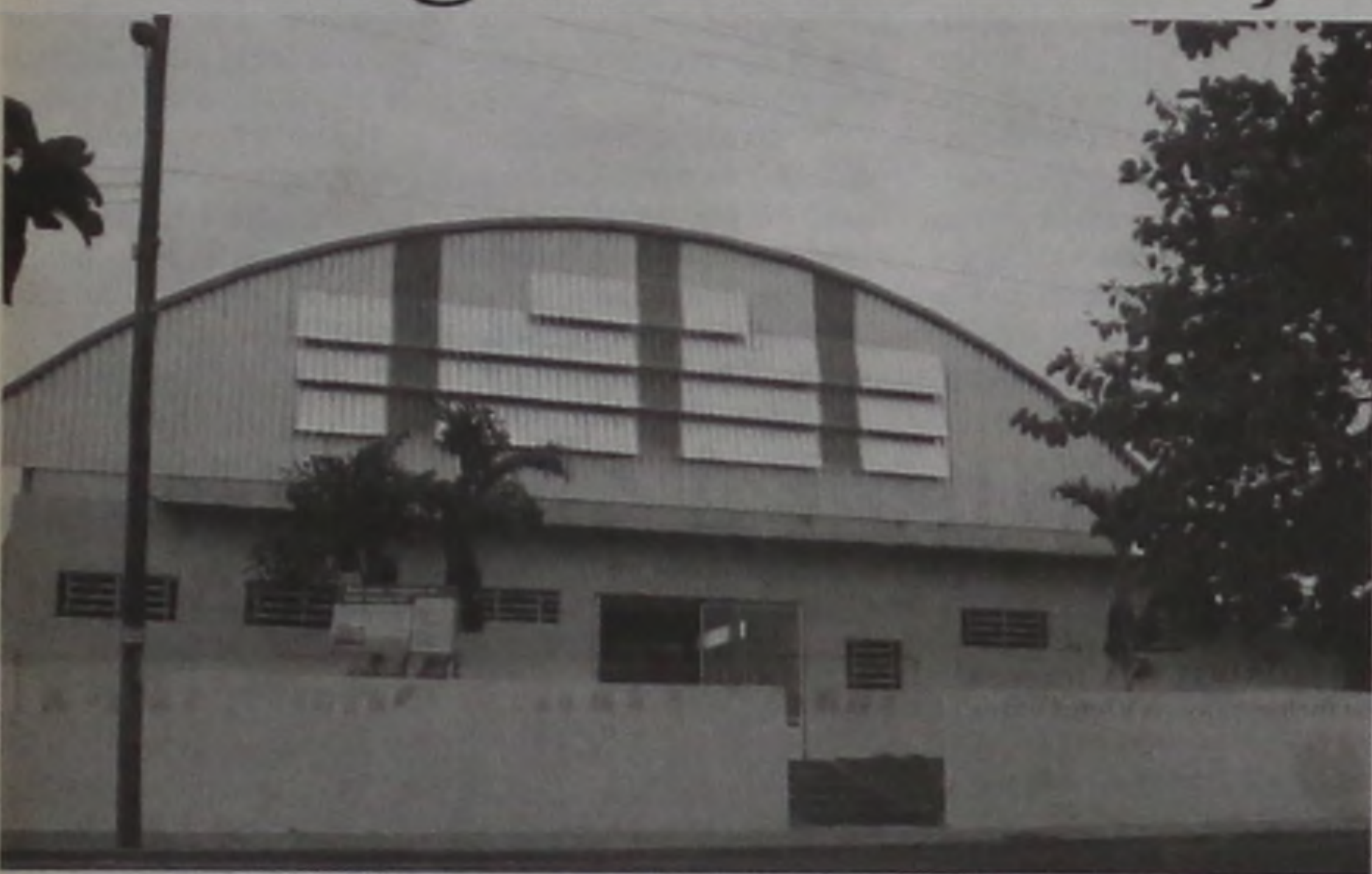
Reformada, a quadra poliesportiva será reinaugurada na terça-feira