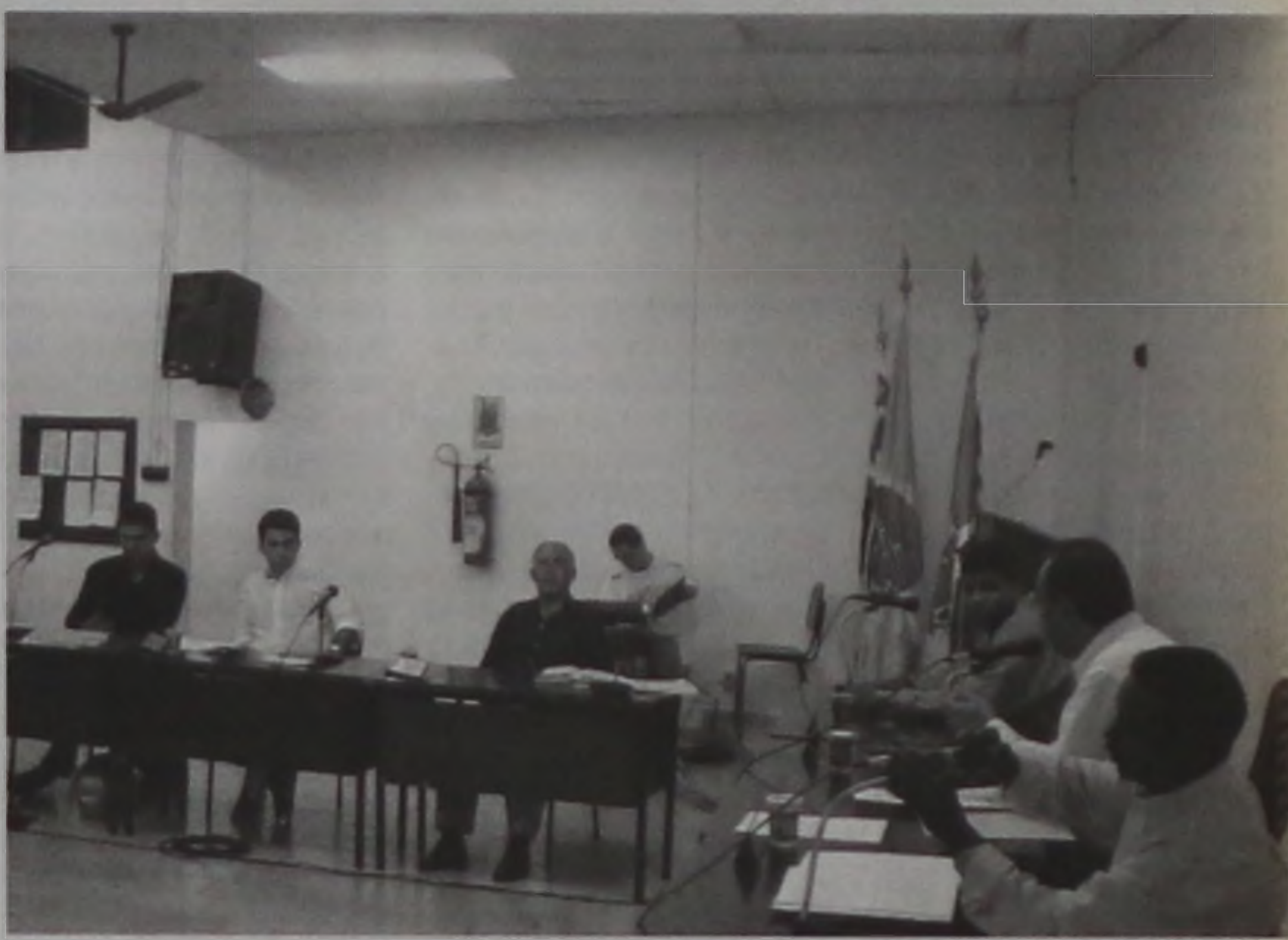
Com placar de 6 votos contra 5, os vereadores de Areiópolis mantiveram subsídio congelado

Econômica Federal e o Banco Nossa Caixa S/A. Assim que a lei for sancionada pelo prefeito Amarildo Garcia Fernandes (PSDB), os servidores municipais poderão efetuar empréstimos nas duas instituições, com desconto direto em folha de pagamento. A lei diz que a Prefeitura de Areiópolis não será responsável pelas obrigações assumidas por seus servidores perante as duas instituições de crédito, exceto pela responsabilidade de efetuar o desconto em folha de pagamento até o limite contratado.