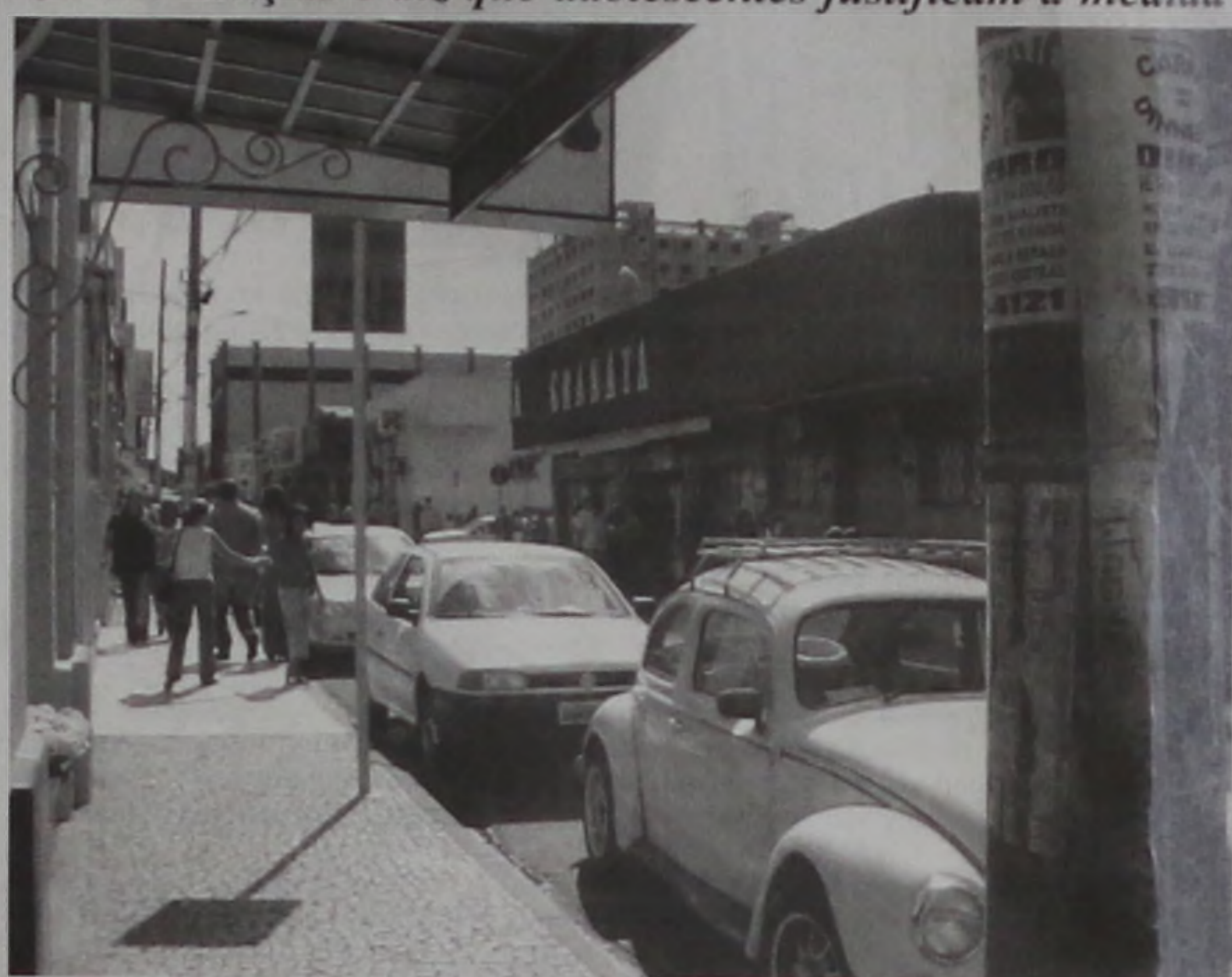
Movimento de veículos na área azul cobre custos do projeto que envolve três entidades filantrópicas

Cada adolescente trabalhando na área azul custa cerca de R$ 350. Isso quer dizer que o grupo de 40 jovens trabalhando no projeto custem aproximadamente R$ 14 mil.