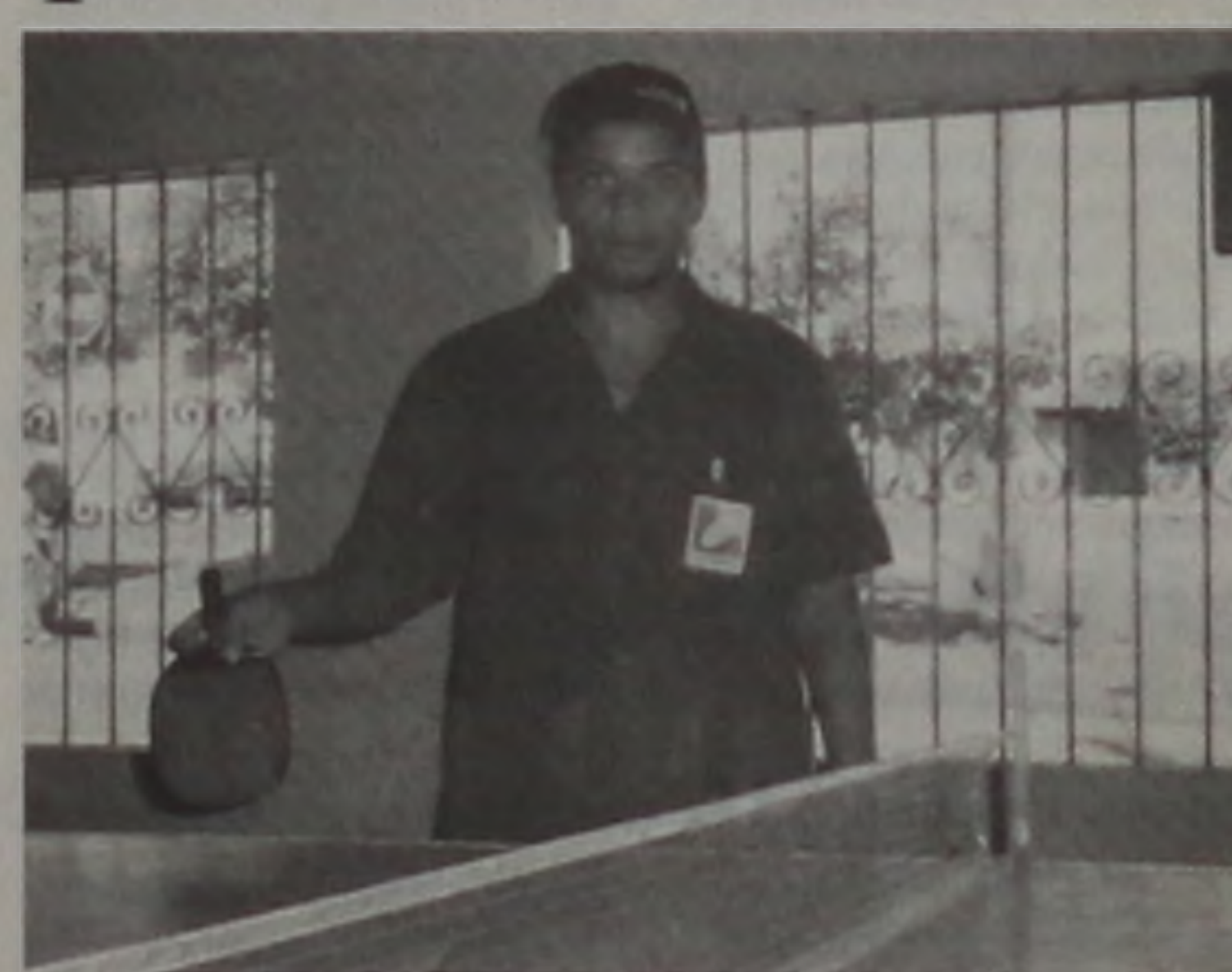
Leão venceu o seu adversário pelo placar de 3 x 0

Já no futebol society, as semifinais acontecem hoje e a final amanhã às 8h30 na ADC.