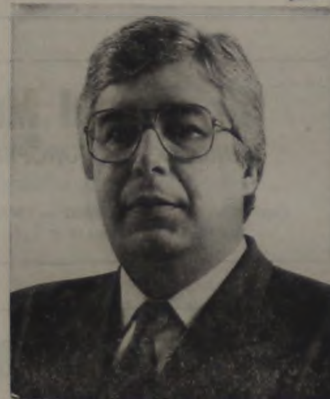
penas na pesquisa do IBOPE, PMDB. O levantamento, em com 38 pontos, da mesma forma que o candidato da semana passada.

Paulo Maluf aparece em igualdade de condições a-