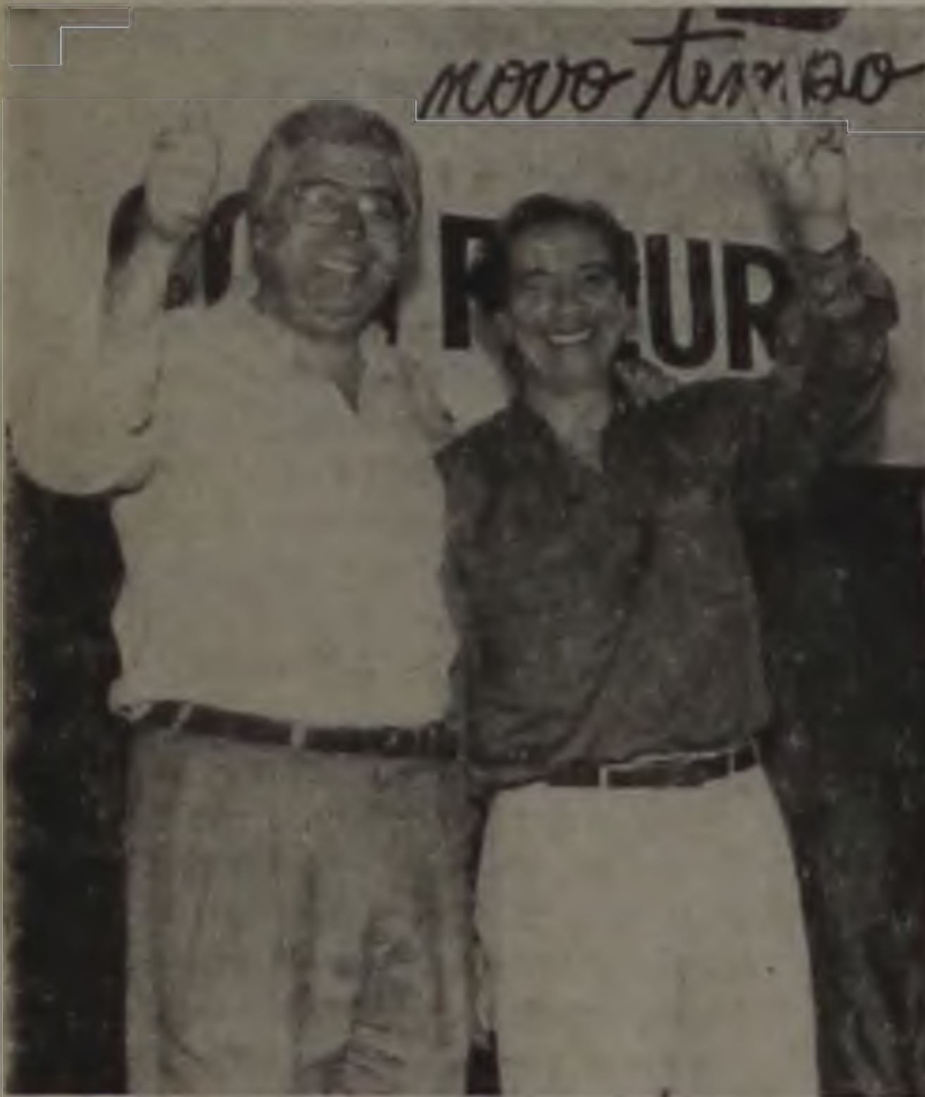
EM MARÇO, O NOVO GOVERNADOR ASSUME