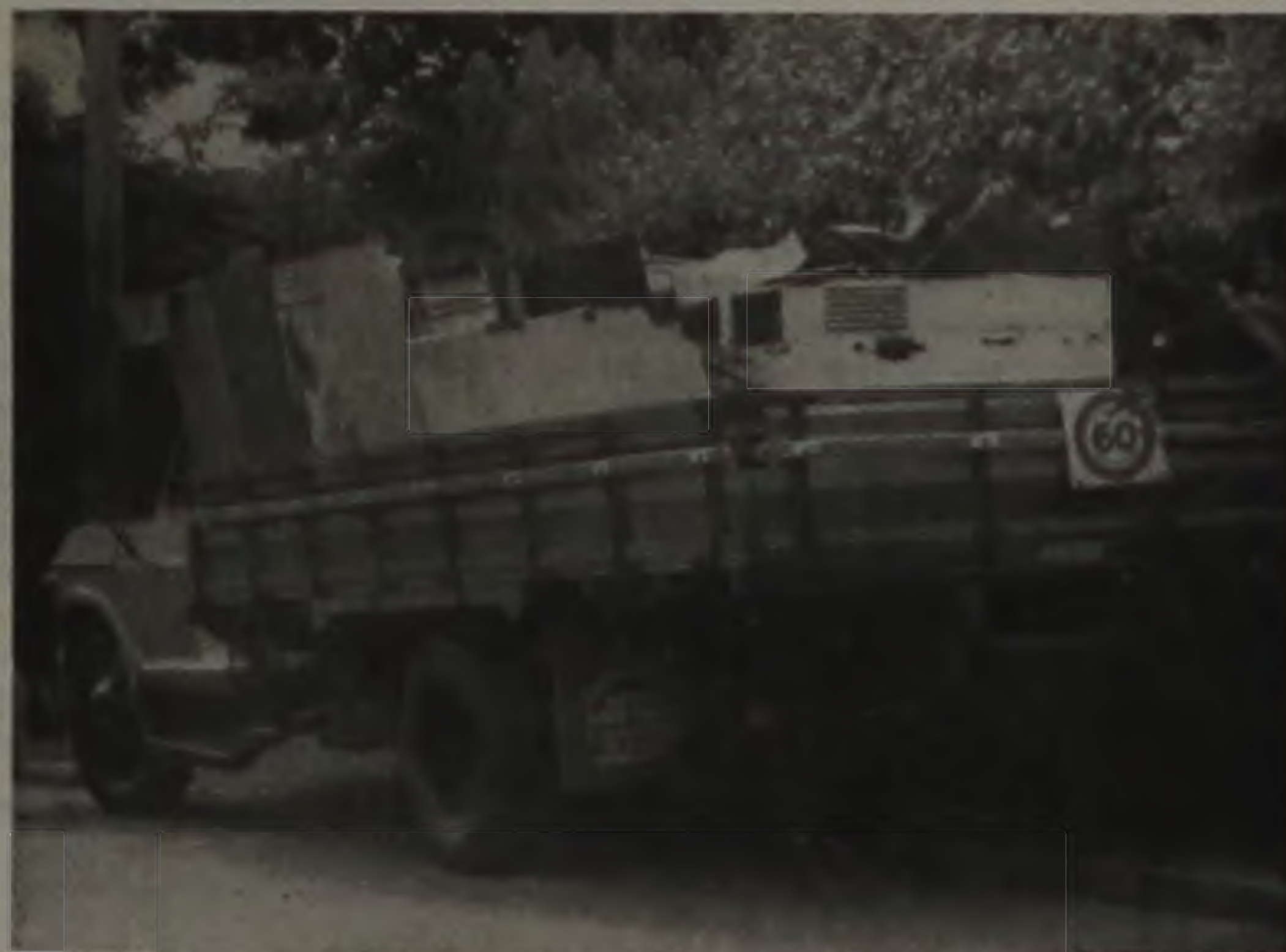
SUCATA ABANDONADA PODE SERVIR DE CRIADOUROS

A situação que se verifica em Lençóis não deixa dúvidas de que, mais do que nunca, todos devem extremar