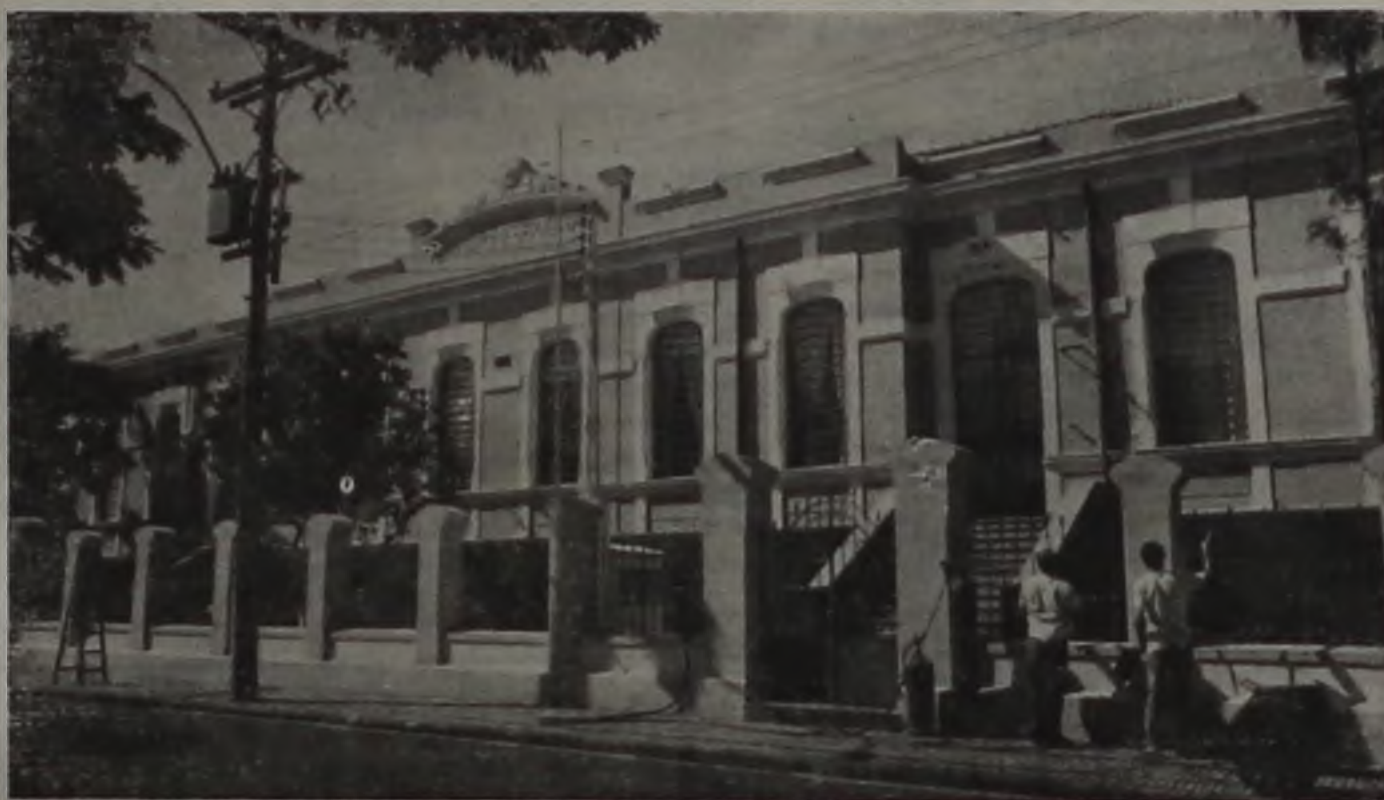
A EEPG "Esperança de Oliveira" é a única escola urbana que não tinha funcionários pelo Promdepar.