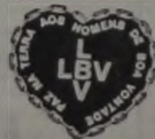
José de Paiva Netto