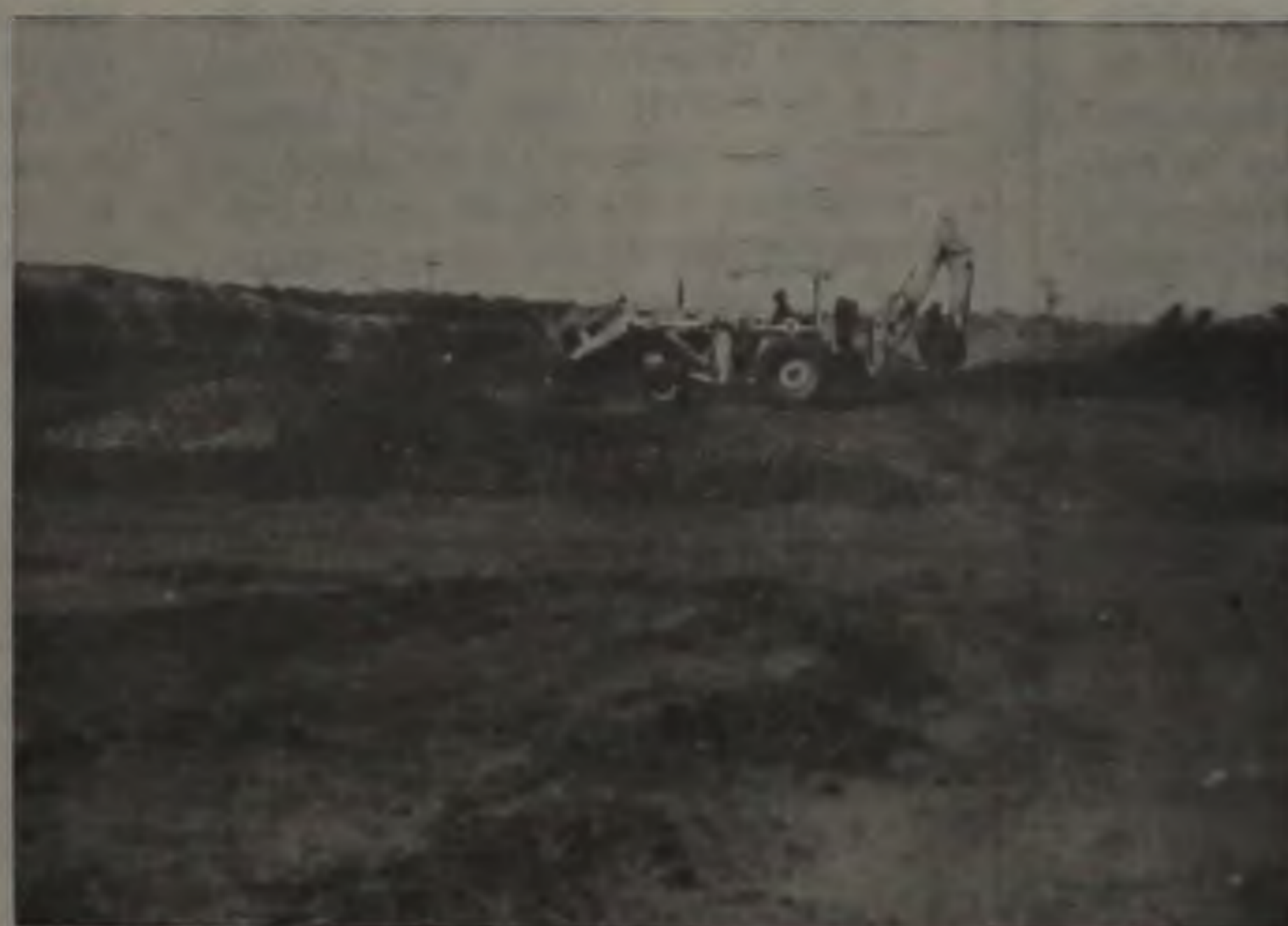
Máquinas da Prefeitura trabalham no desvio da rede de esgoto.

Estão se iniciando as obras de preparação da área onde será construído o conjunto poliesportivo do Clube Atlético Lençoense. Os trabalhos iniciais foram executados pela Prefeitura, que realocizou a tubulação subterrânea de esgoto, desviando-a para fora do terreno reservado ao projeto do clube. A empresa corretora que cuida do empreendimento