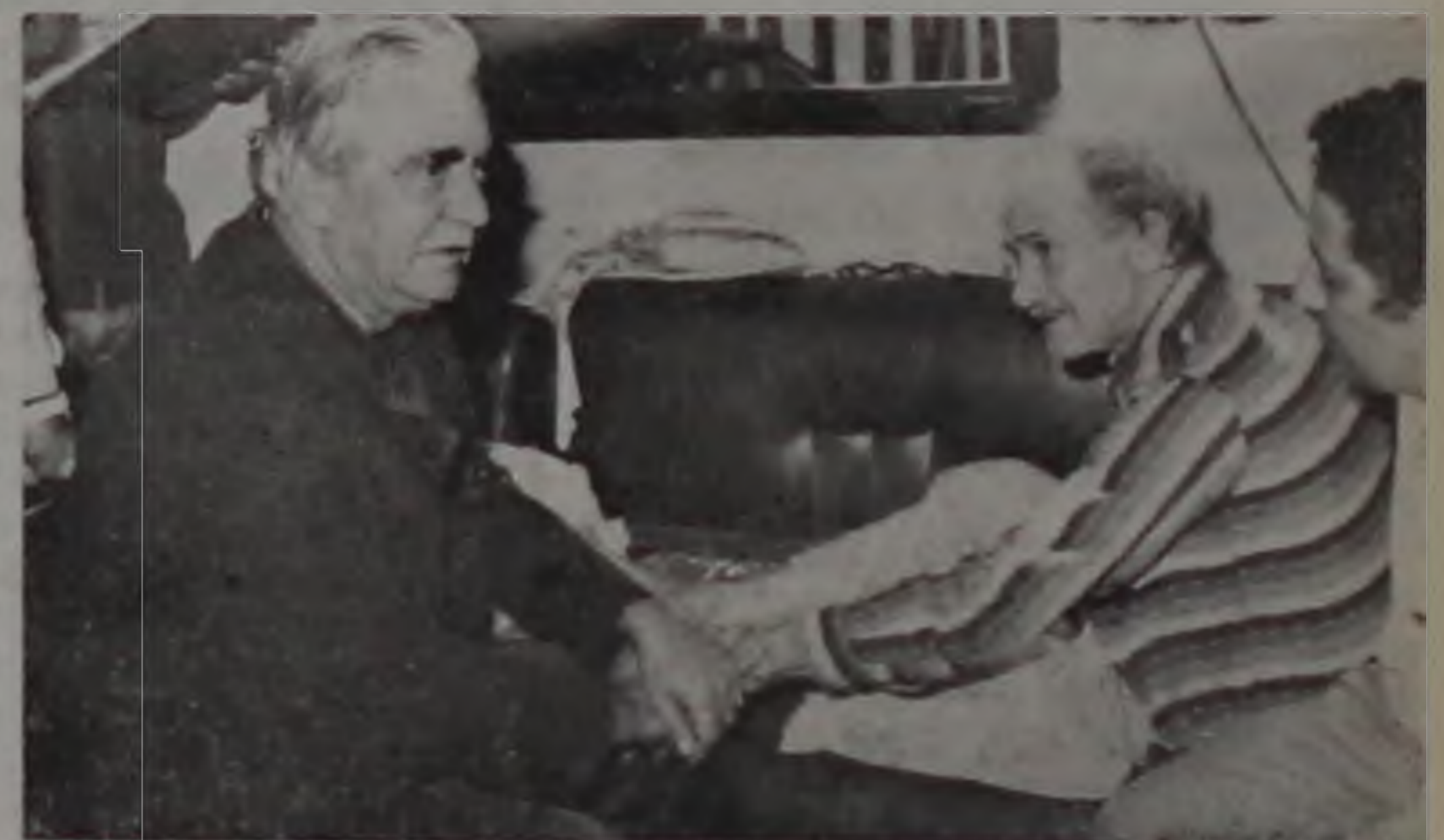
UM EMOCIONANTE ENCONTRO COM O COMPANHEIRO LEAL

"Nenhum de nós sabe o que Deus nos reserva no dia de amanhã, mas estamos todos dispostos e precisamos estar a atender nosso destino que é traçado pela mão grande e poderosa do Altíssimo. Seja qual for o seu destino, desejo que Lençóis saiba que tem em mim, que tem em nós, um amigo", afirmou Jânio Quadros durante o almoço que encerrou a sua última visita a Lençóis Paulista.