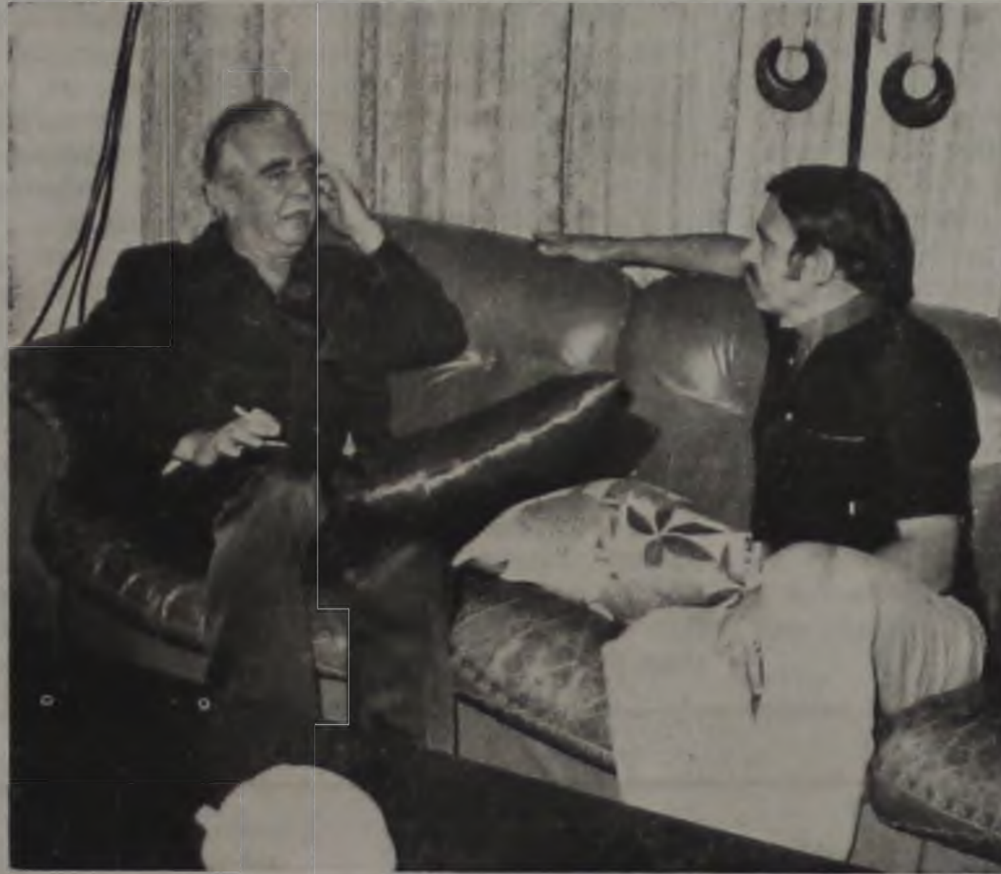
O EX-PRESIDENTE COM IDEVAL EM 1981

O velório, na Assembléia Legislativa, teve enorme concentração de personalidades políticas e empresariais, e o enterro foi ainda mais concorrido pela movimentação popular marcada por homenagens e muita emoção. As honras dispensadas no ritual, típicas dos funerais de estado, incluíram salva de 21 tiros de canhão. O féretro foi conduzido por caminhão do Corpo de Bombeiros, envolvido pela Bandeira Nacional. A família não