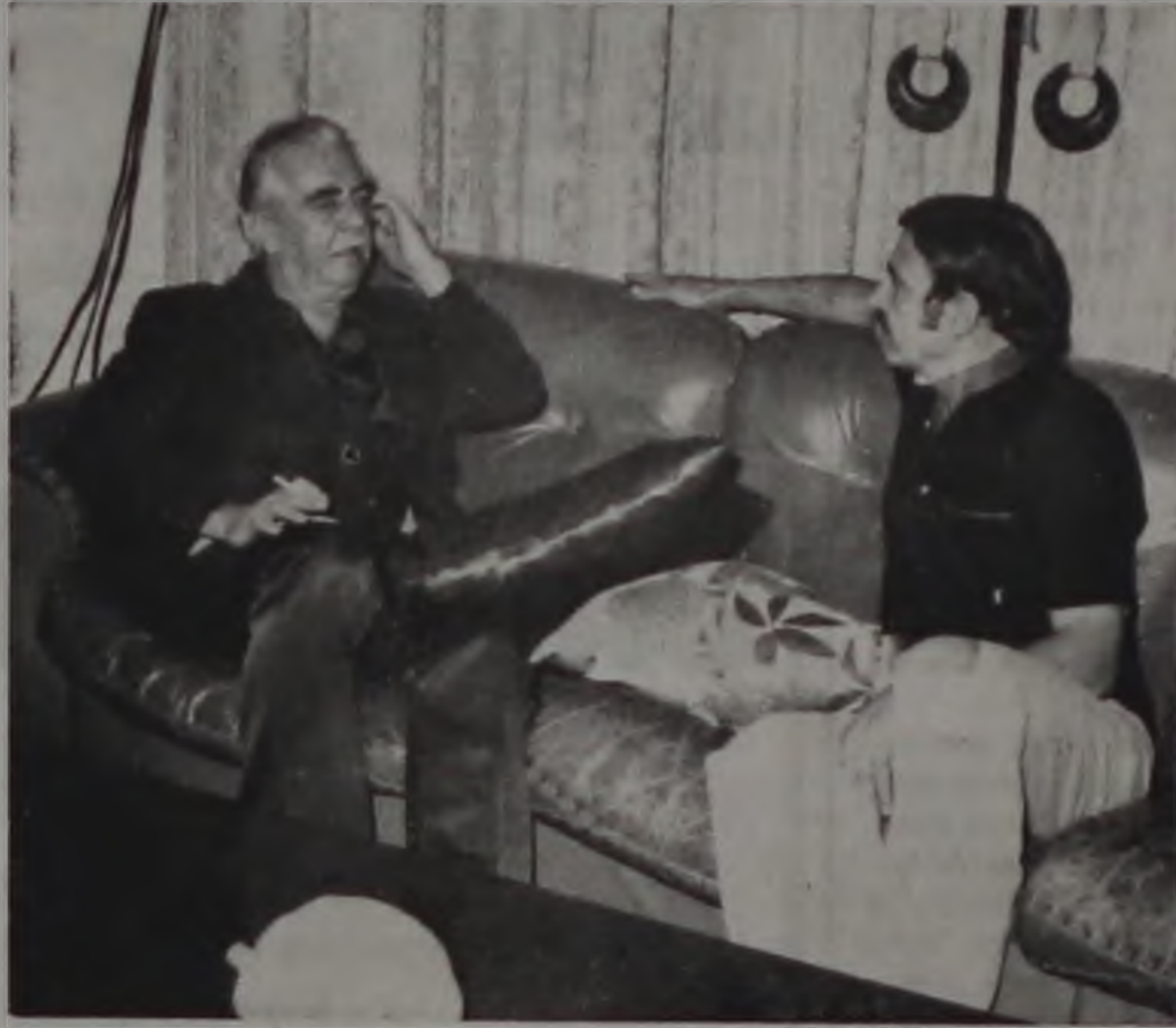
JÂNIO COM IDEVAL, NA CASA DO EX-PREFEITO

Jânio Quadros esteve em Lençóis, pela última vez, no dia 4 de junho de 1981. Veio a convite do diretório do Partido Trabalhista Brasileiro (PTB) e fez questão de iniciar o programa com uma reunião informal na residência do líder político Ideval Paccola.