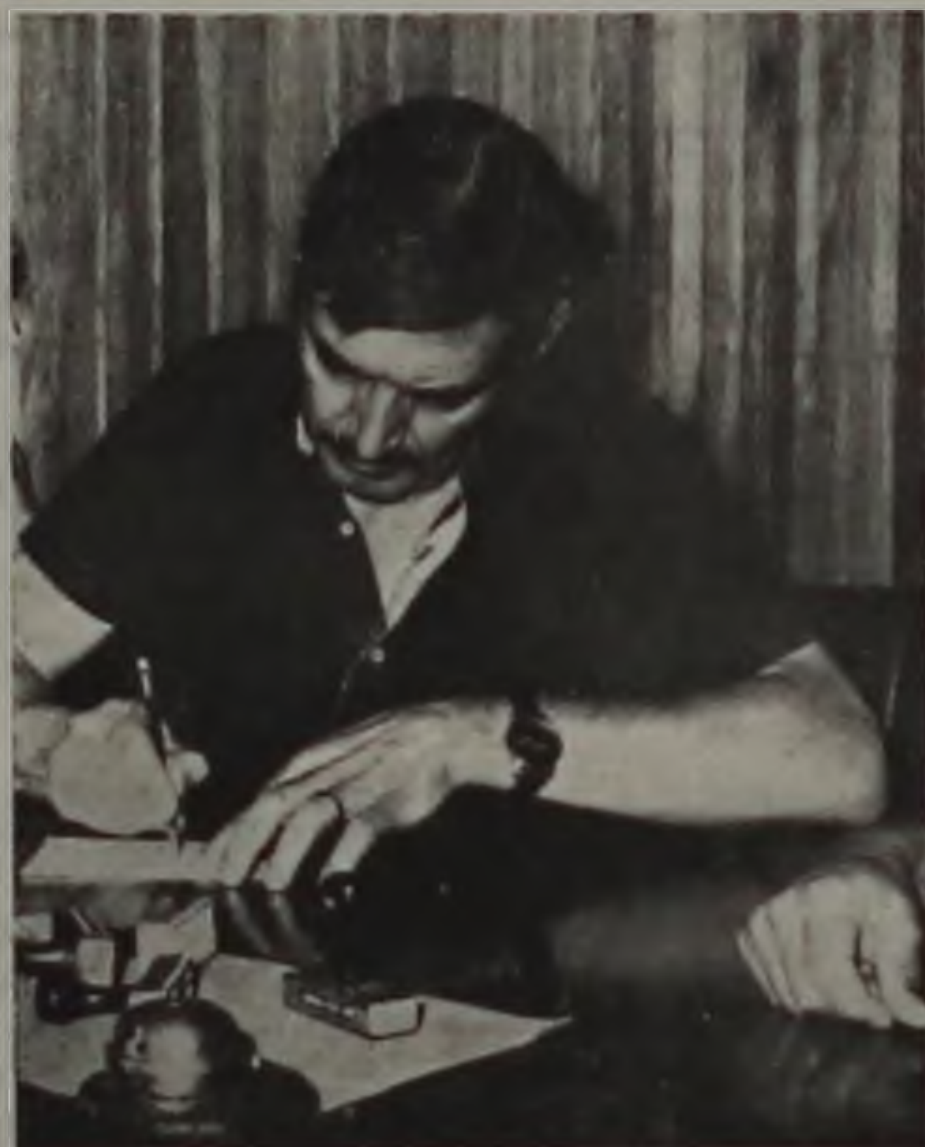
Ideval lidera a chapa única.

leitoral deste ano para as pessoas indôneas que se identificam com a filosofia do PMDB. Os dirigentes começam a atender os interessados a partir de segunda-feira, trabalho que será mantido até 2 de abril, quando expira o prazo estabelecido pela Lei Eleitoral para as filiações partidárias.