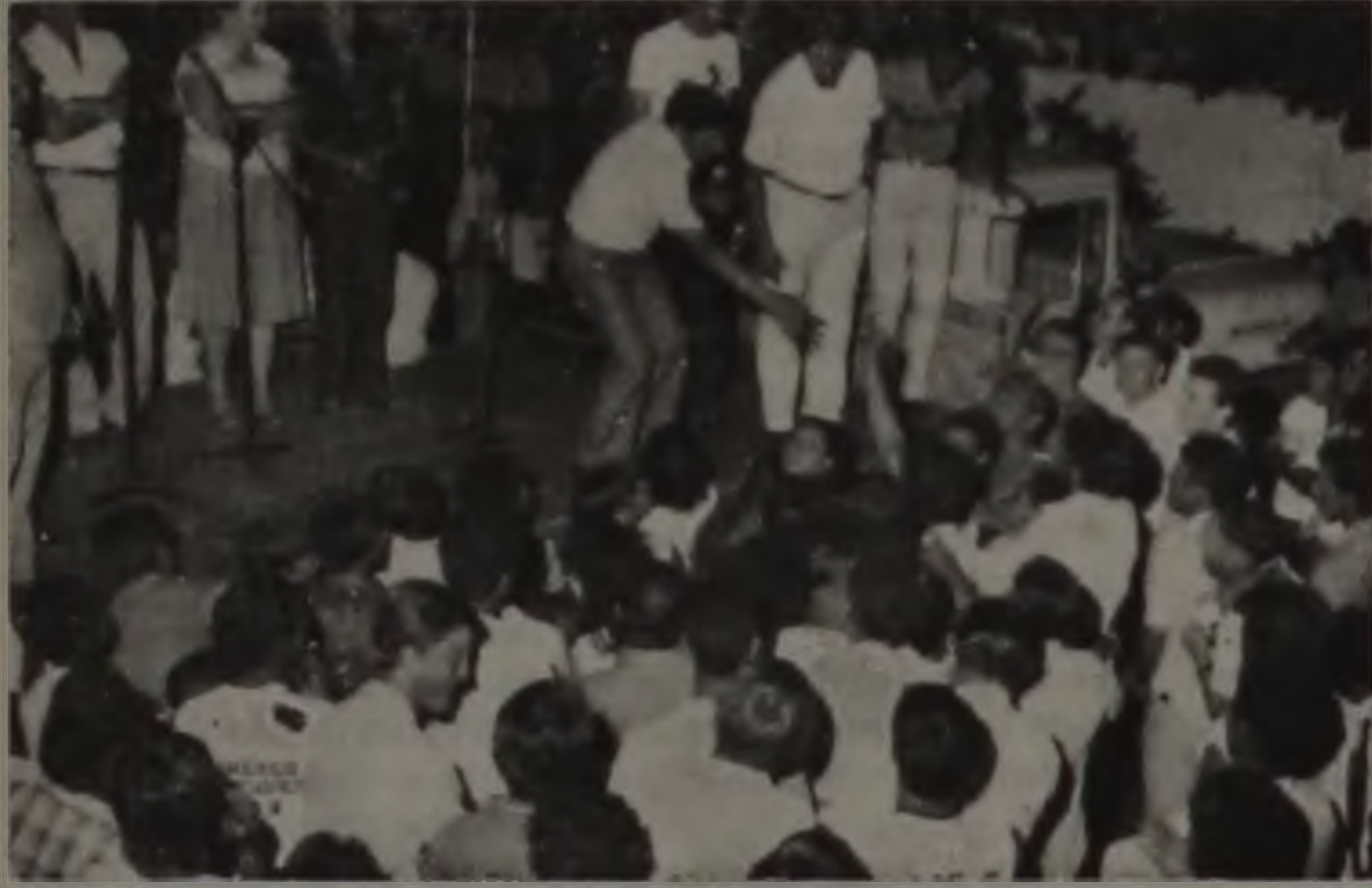
DIRIGENTES VEEM GRANDES CHANCES DE REEDIÇÃO DA CAMPANHA VITORIOSA DE 82. (ARQUIVO)