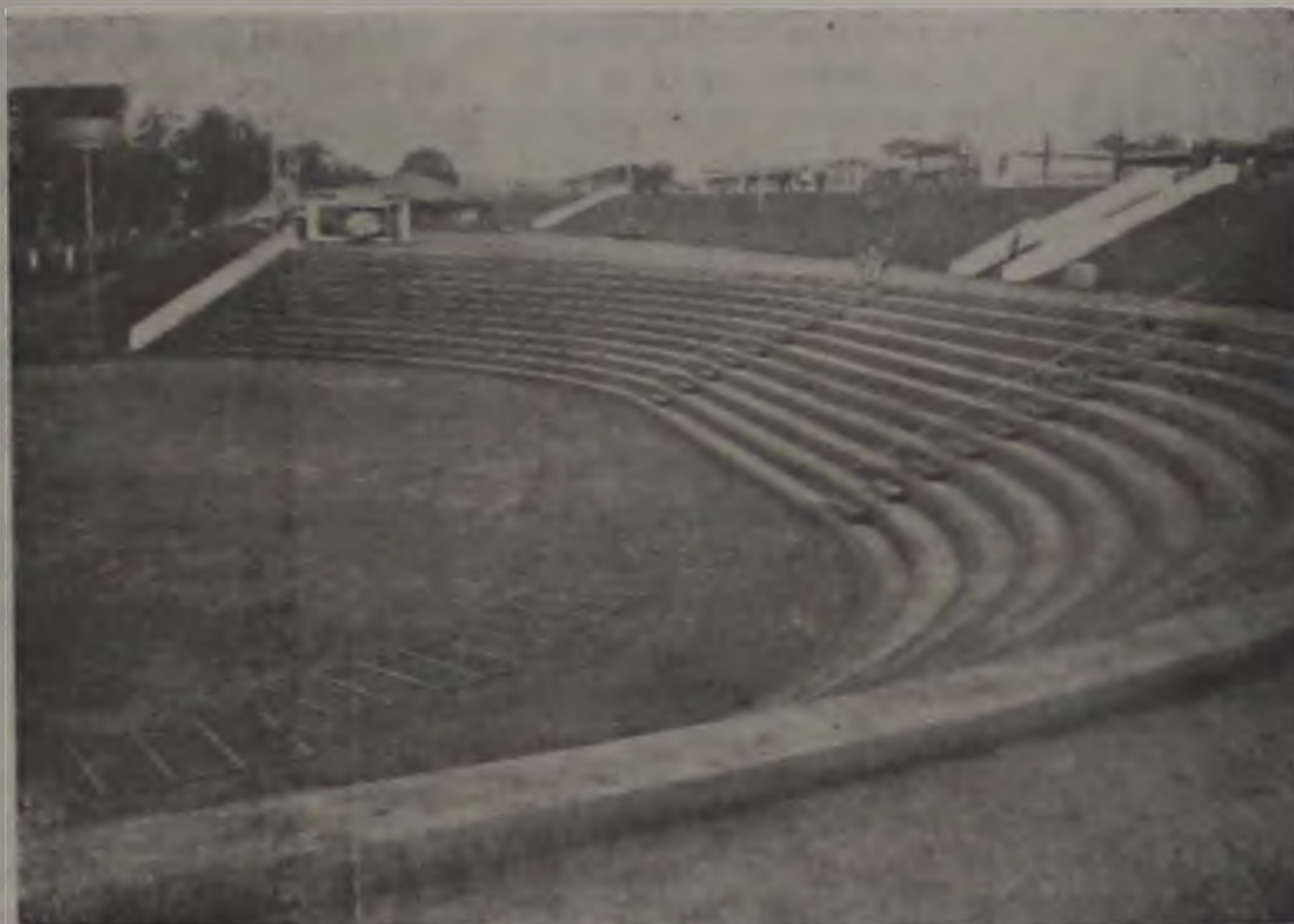
COM ACESSO GRATUITO AO RECINTO, O PÚBLICO DEVERÁ DISPUTAR VAGAS NAS ARQUIBANCADAS DEFRONTE AO PALCO E O PICADEIRO

Mangalarga, Quarto de Milha e Apaloosa. Várias raças de ovelhas também estarão em exposição. A comissão espera o comparecimento de aproximadamente 200 mil pessoas nos dias de realização da Feira.