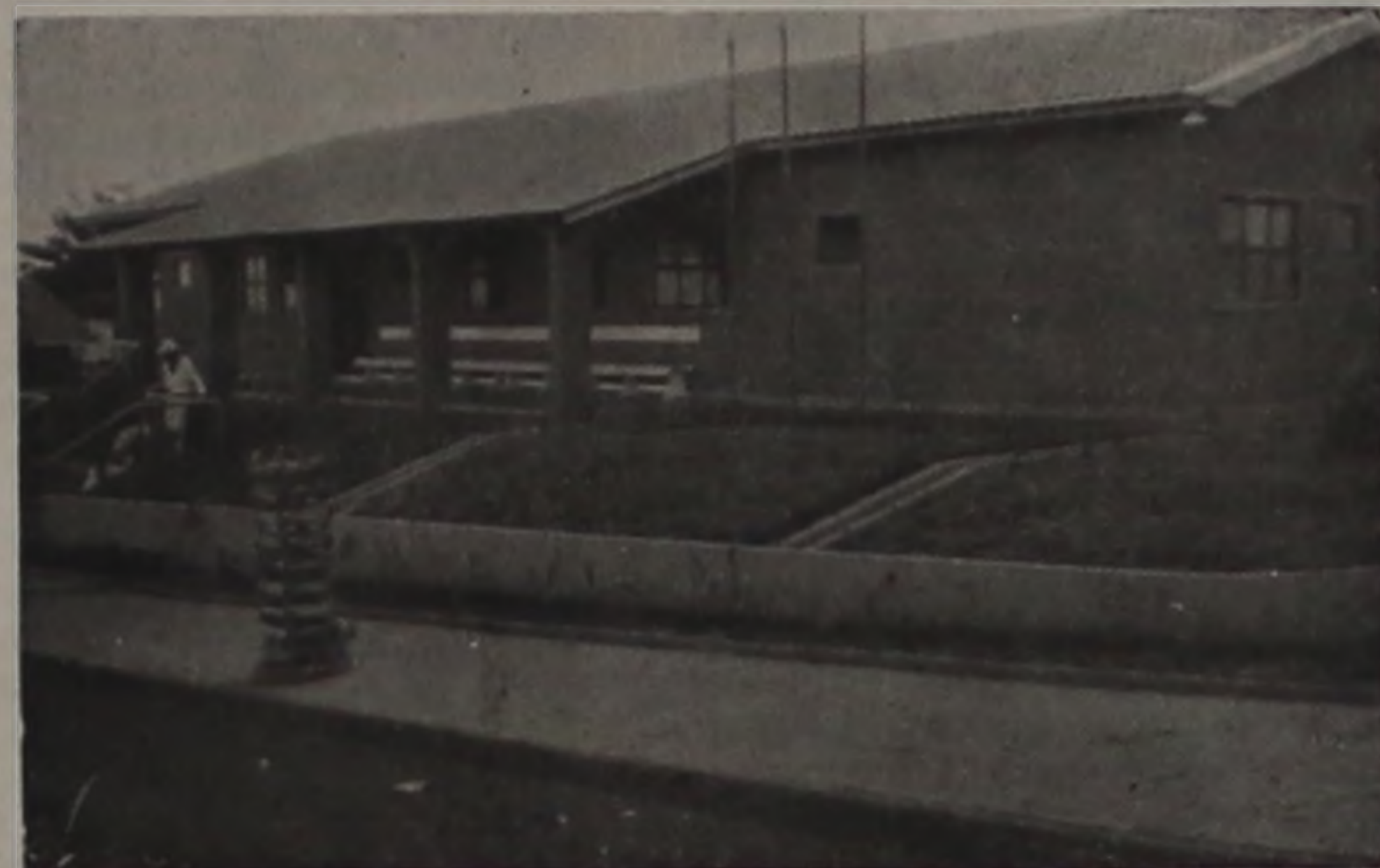
A UNIDADE BÁSICA DE SAÚDE SITUADA NO N.º LUIZ ZILLO É O LOCAL INDICADO PARA RECEBER O PRIMEIRO P.A.