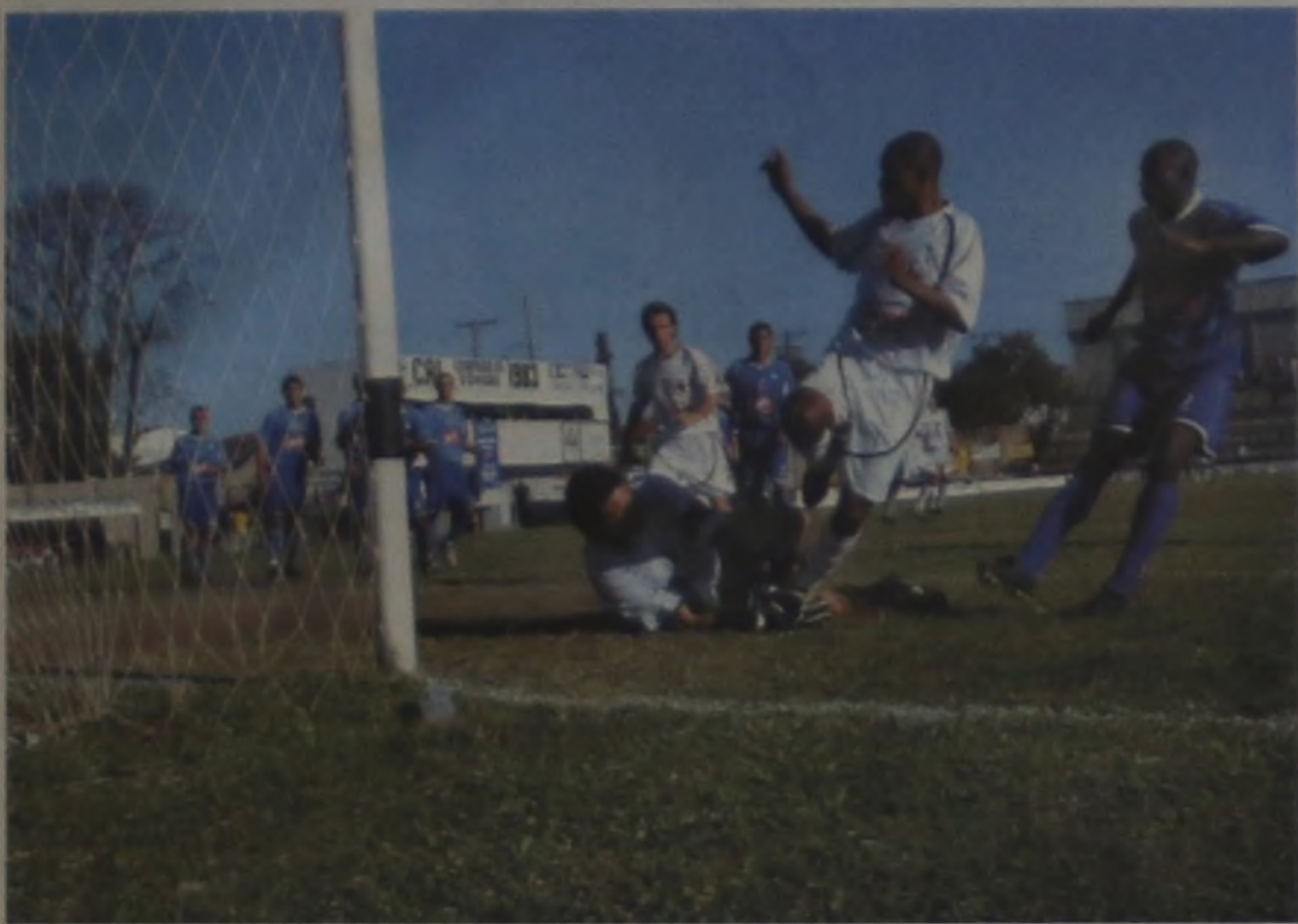
O gol de Tuti garantiu o empate contra o Assisense e o primeiro ponto do CAL na B2