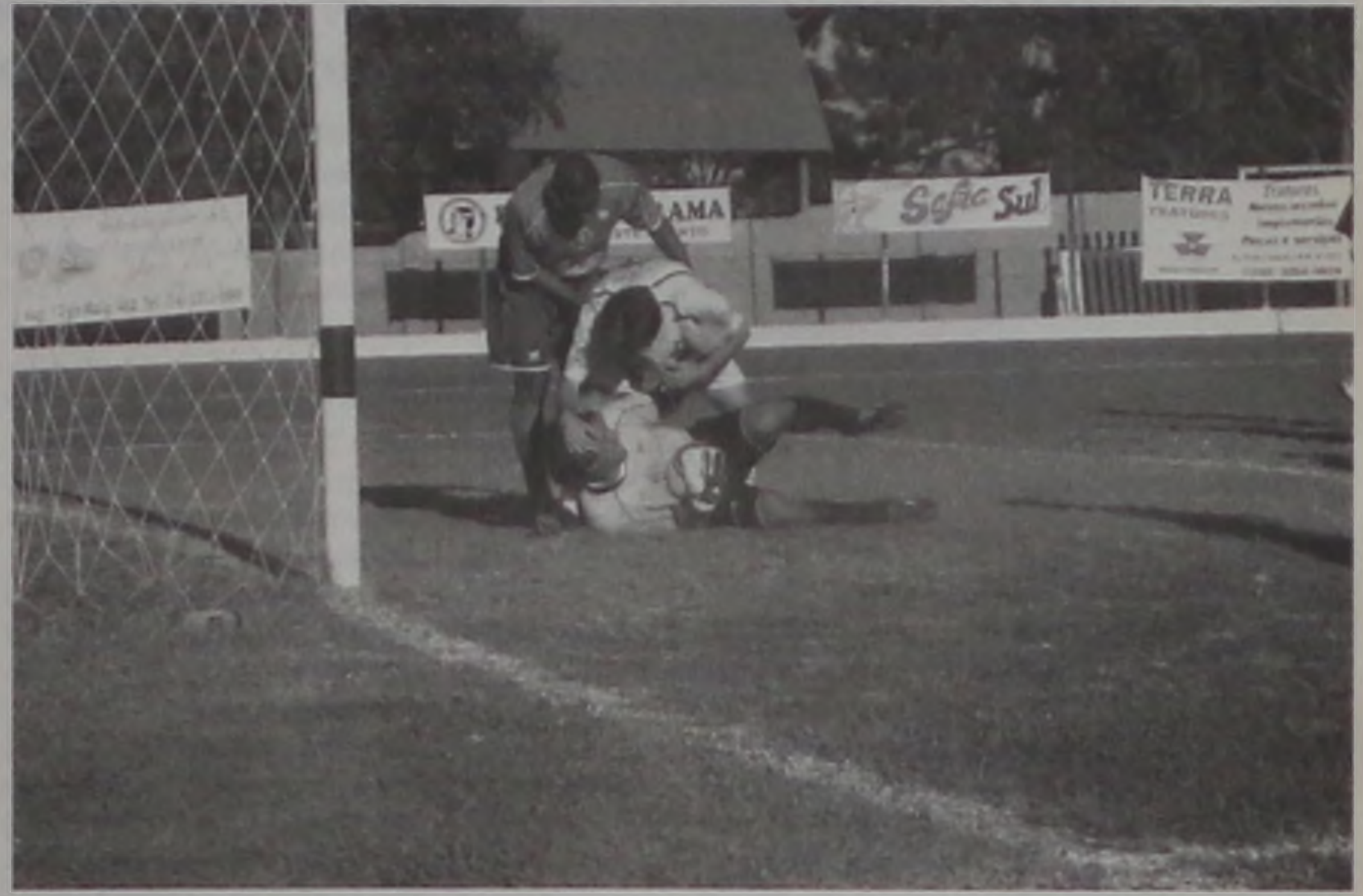
No ataque do CAL, goleiro do Assisense salva a equipe da derrota