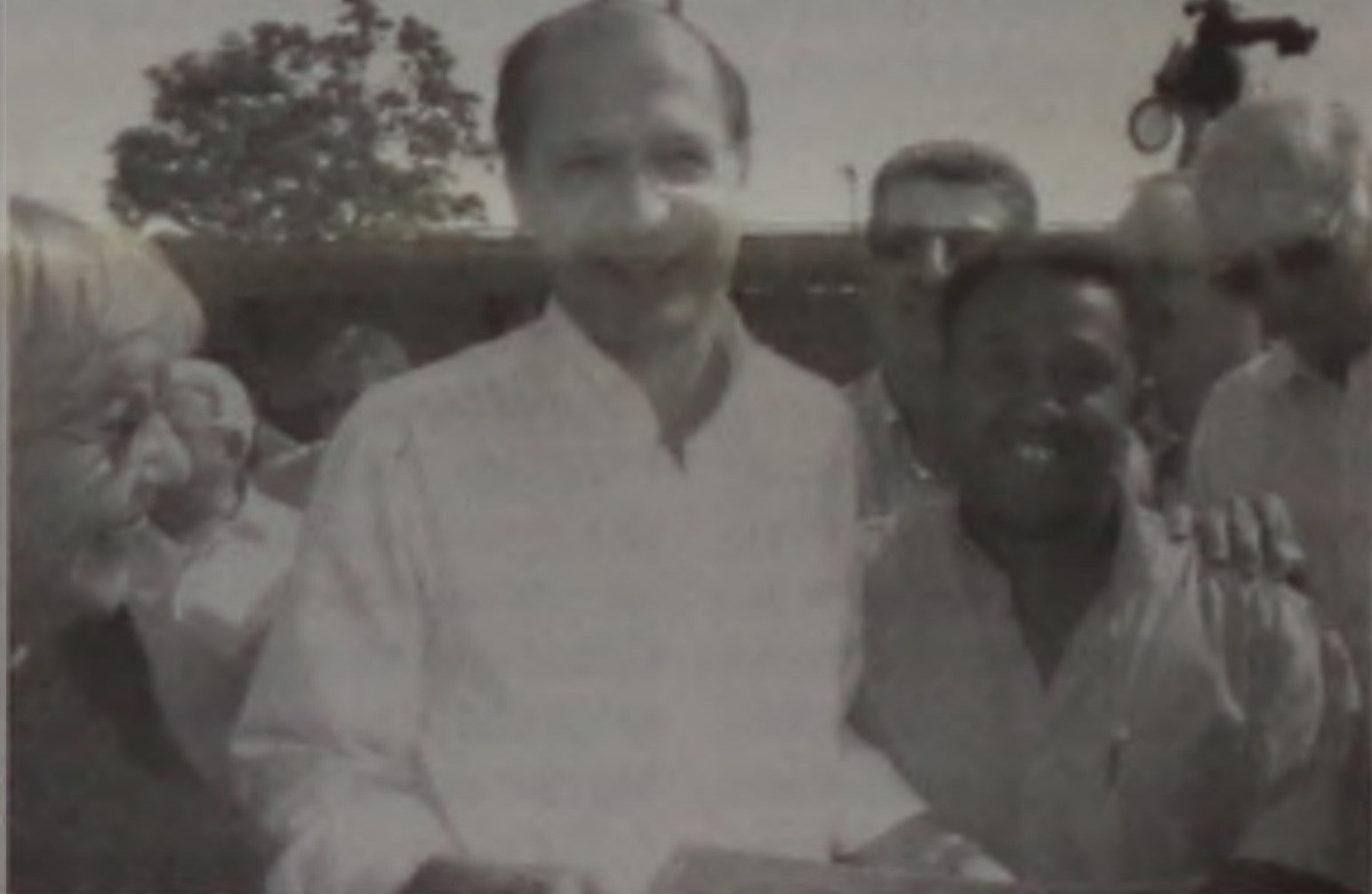
O vereador Manezinho com Alckmin em Borebi