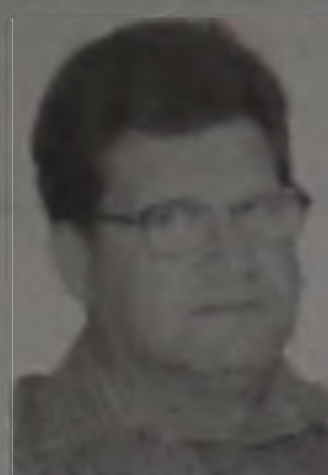
Gordo (PFL) 296 votos