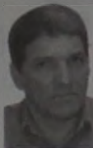
Julisar (PDT) 150 votos