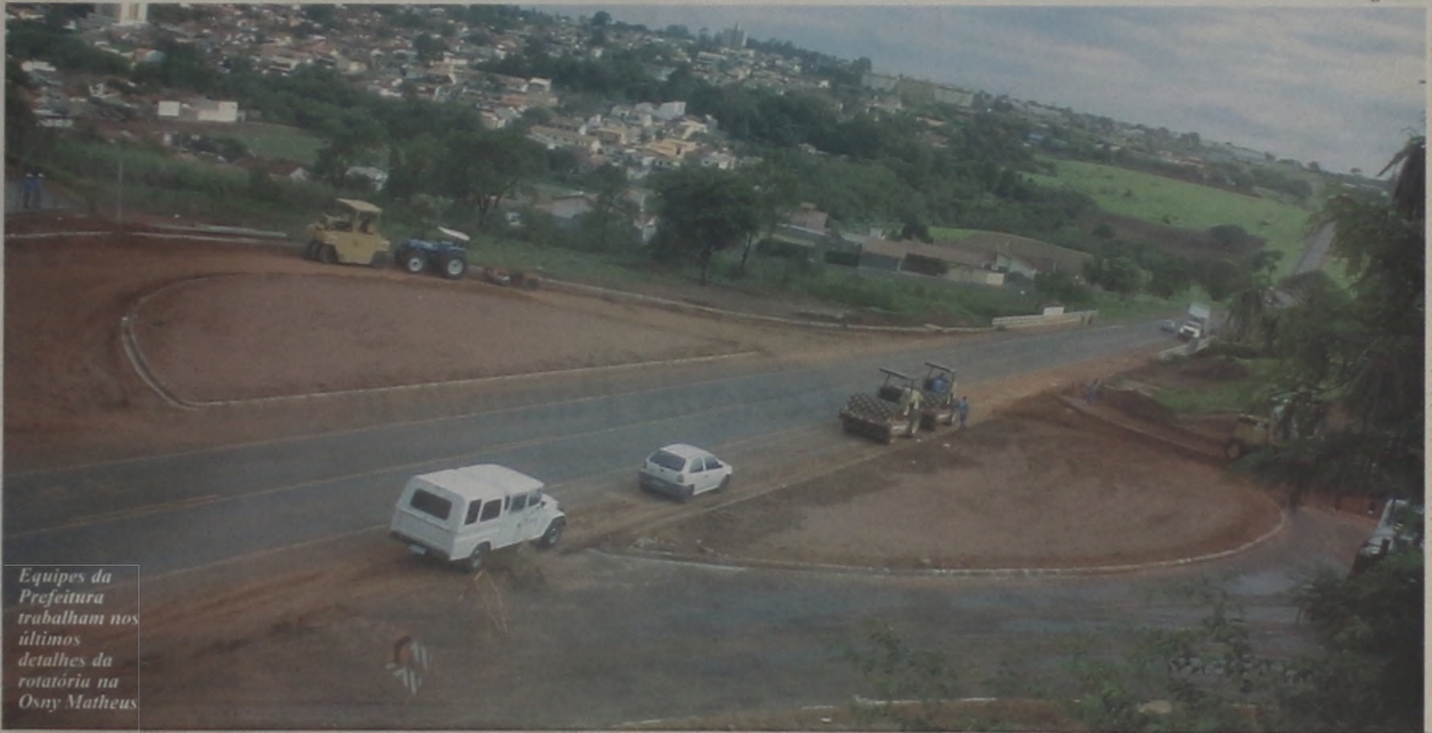
Equipes da Prefeitura trabalham nos últimos detalhes da rotatória na Osny Matheus