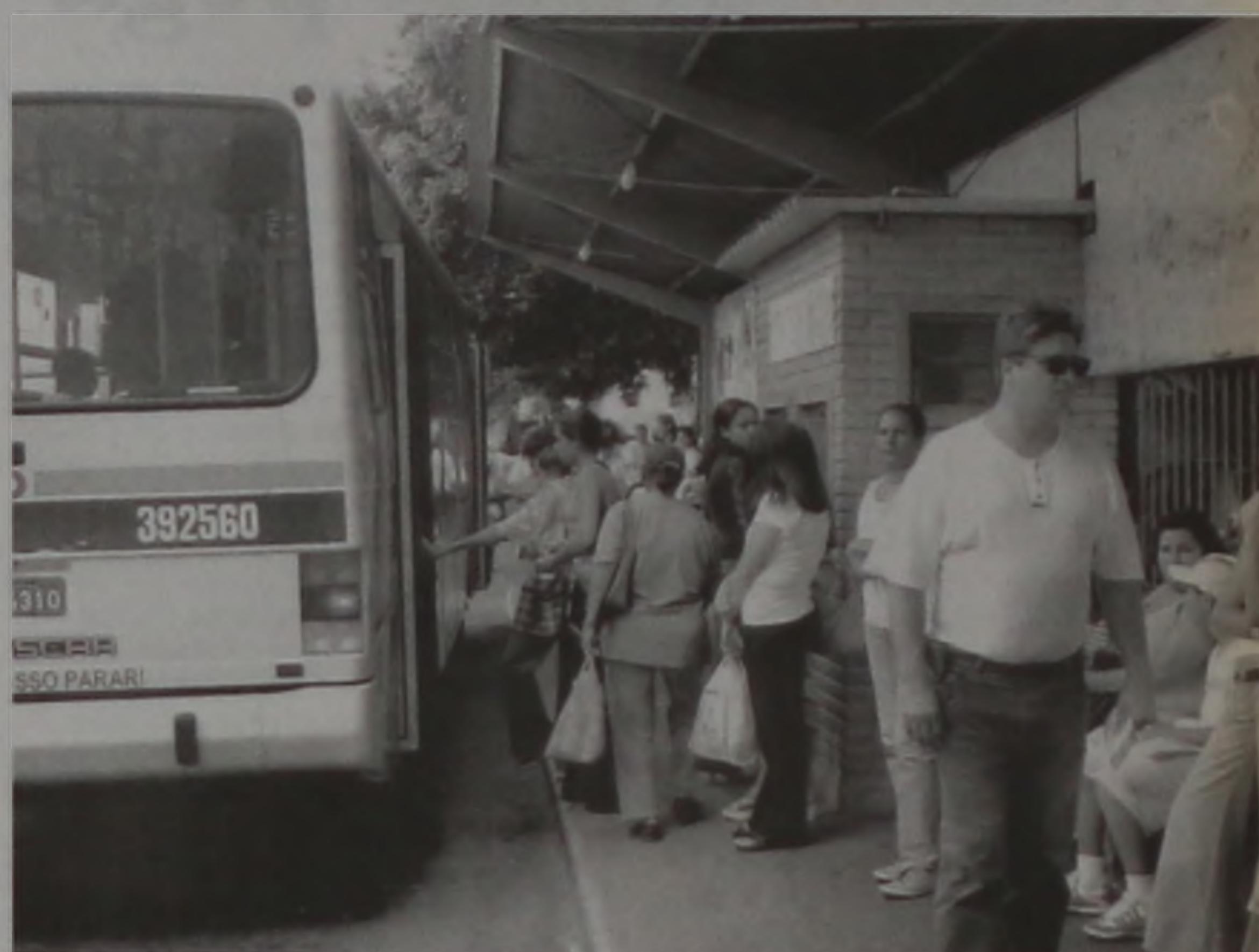
Usuários do sistema circular agora pagam R$ 1,60 a viagem

A tarifa circular não sofreu reajuste havia vinte meses. O último aumento foi autorizado em março do ano passado, quando a tarifa passou de R$ 1,00 para R$ 1,30, conforme o decreto executivo 107 de 2003.