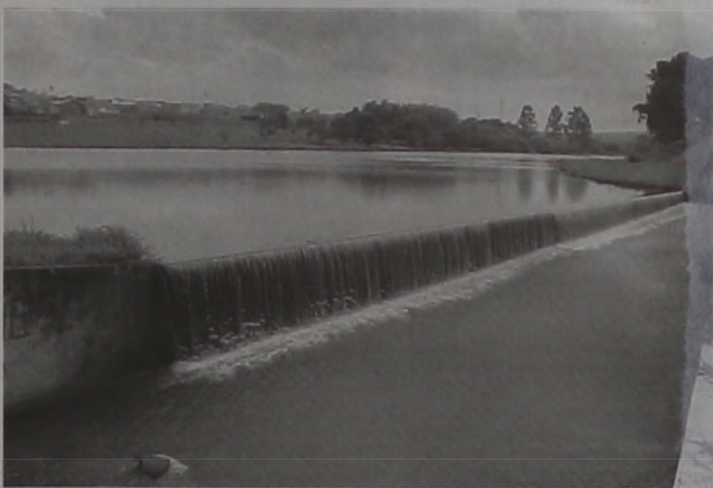
Primeira ação será o recolhimento de lixo inorgânico no Rio da Prata

A idéia é buscar parcerias de projetos com a comunidade e empresários de Lençóis Paulista. Na área ambiental o objetivo é executar projetos para a limpeza de rios e promoção do meio ambiente. Já no lado social, a ONG pretende auxiliar a comunidade buscando sempre o aumento de renda para as famílias mais carentes. Todos os projetos a serem aplicados pela ONG têm que ser aprovados por consenso entre todos os membros, conforme rege o estatuto.