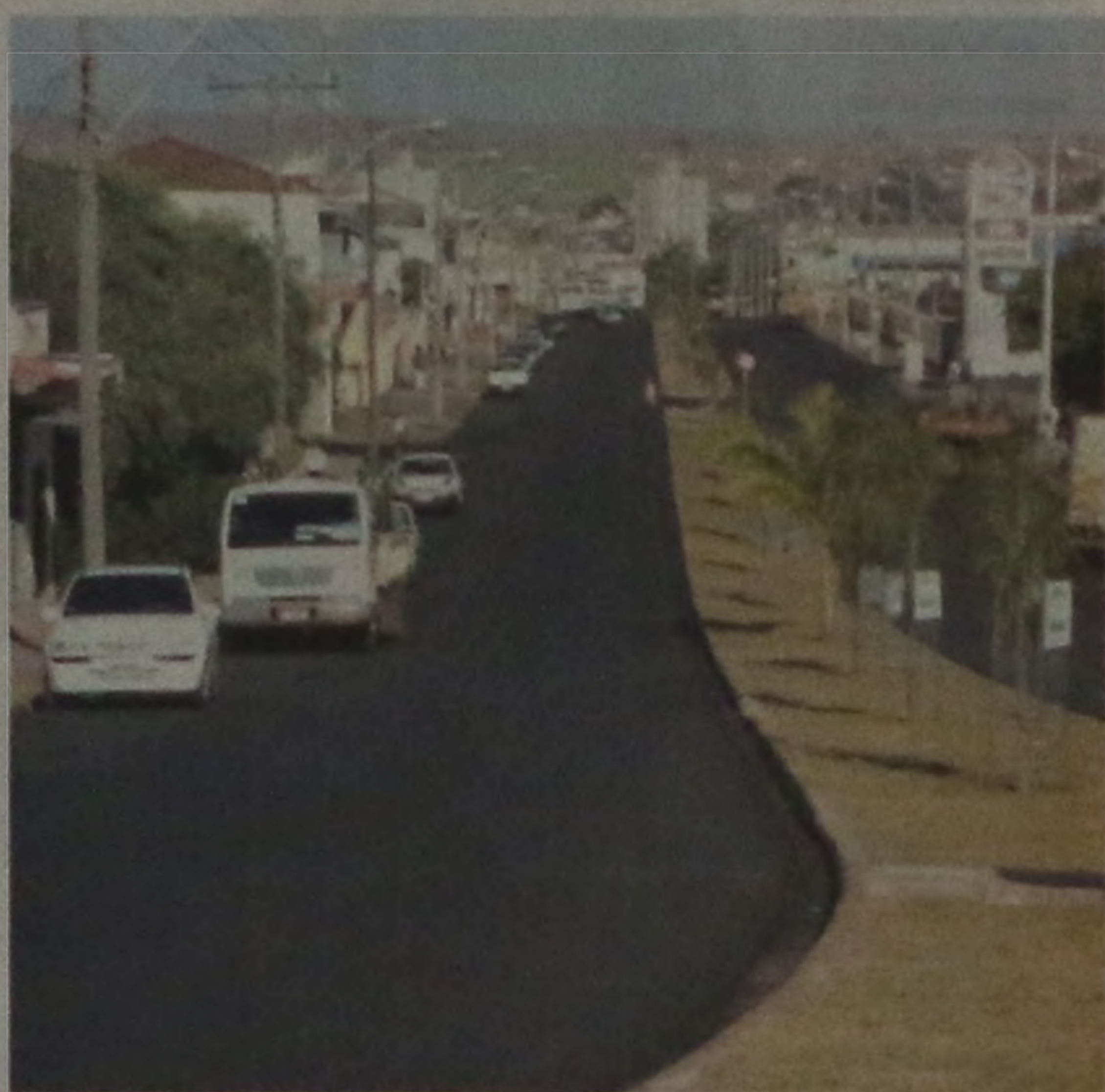
Recape da Jácomo Nicolau Paccola: um dos problemas resolvidos em 2004

Outro ponto que vinha sendo uma unha encravada no dedo do lençoense nos últimos anos era a péssima condição de tráfego da avenida Prefeito Jácomo Nicolau Paccola, que nesse ano foi recapeada entre o viaduto Ângelo Petenazzi e o trevo na avenida Nações Unidas. Desgastada, a avenida não recebia uma camada de asfalto desde sua inauguração, há quase três décadas.