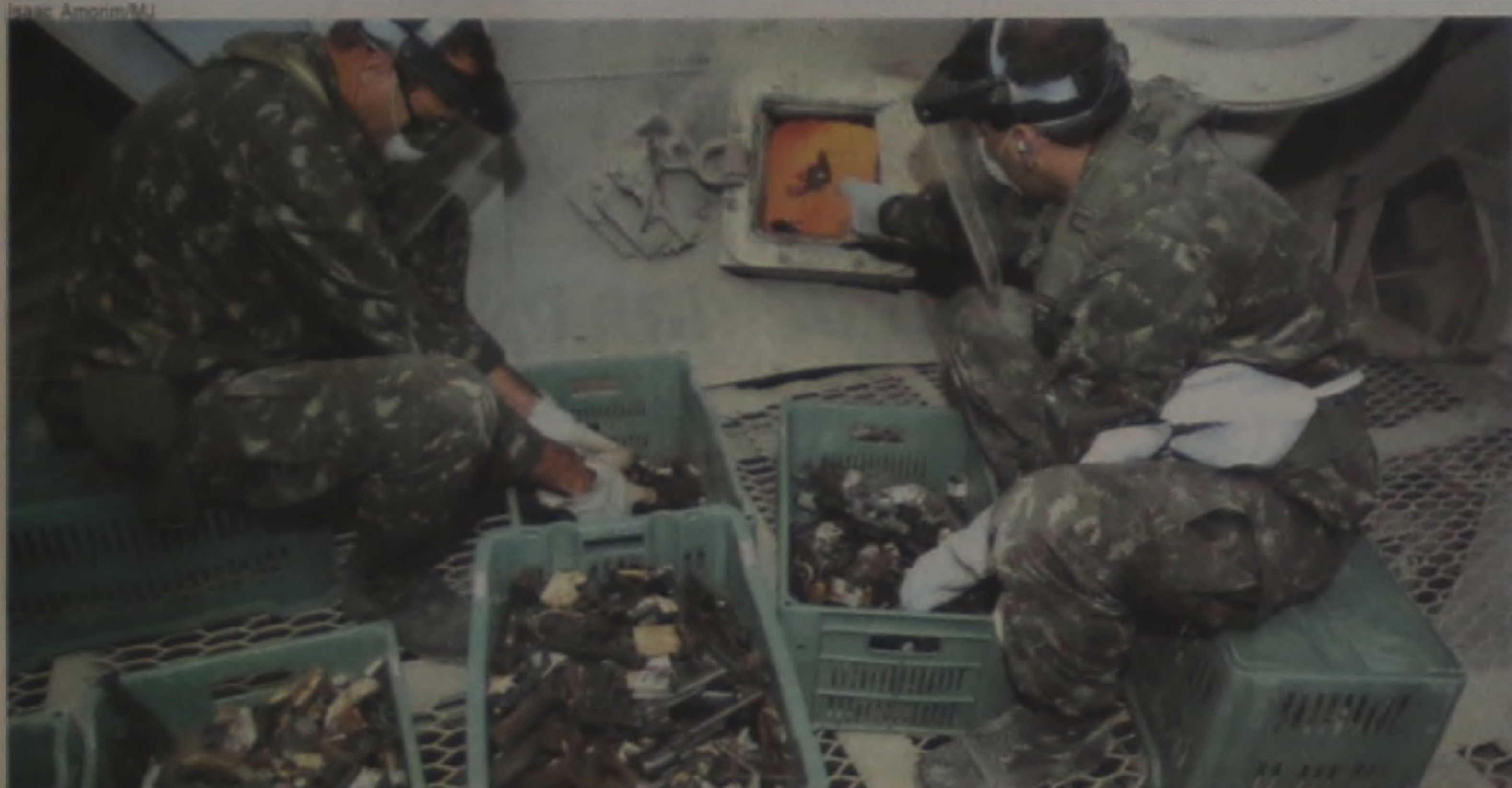
Soldados do Exército destroem armas, após solenidade em Brasília, realizada pelo Ministério da Justiça