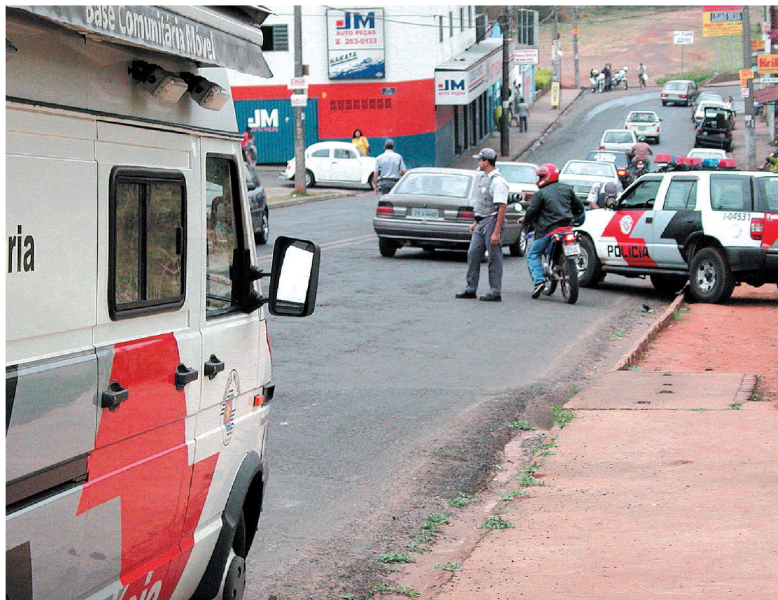
O ano de 2004 termina com a criminalidade em baixa em Lençóis Paulista