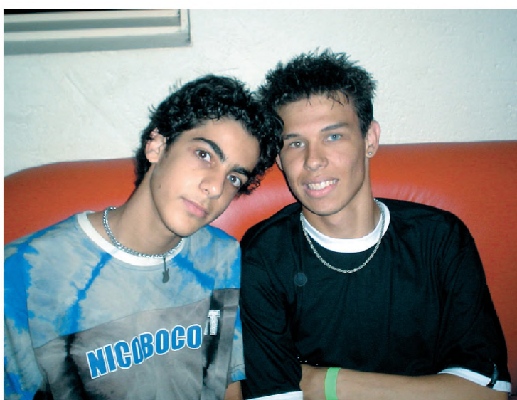
Pool e Puth