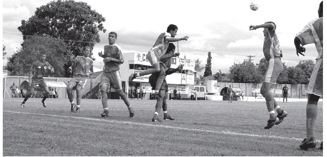
Lance da vitória do Iraty sobre o Atlético de Sorocaba