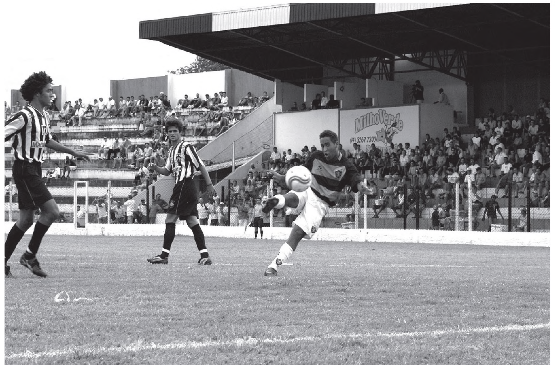
O atacante do Sport desperdiça a chance de abrir o marcador na etapa inicial