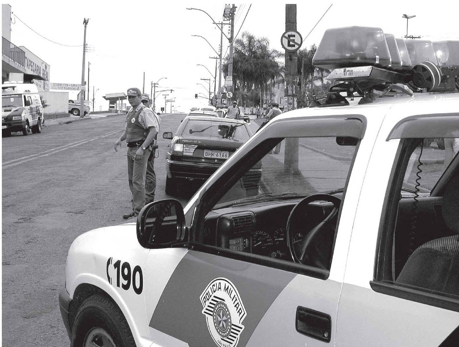
Estatísticas da Polícia Militar garantem que o índice de segurança pública melhorou no município

Os roubos de veículos caíram pela metade. Foram 10 carros roubados em 2003, contra 5 no ano passado. Segundo o tenente da Polícia Militar, esse índice demonstra que as vítimas em potencial – casais de namorados estacionados em locais escuros – têm mudado o comportamento. “Quando os casais estão na intimidade e a polícia passa por perto, eles reclamam. Mas essa é a nossa resposta”, diz. “O resultado ideal é zero, mas nós estamos buscando esse número”, finaliza.