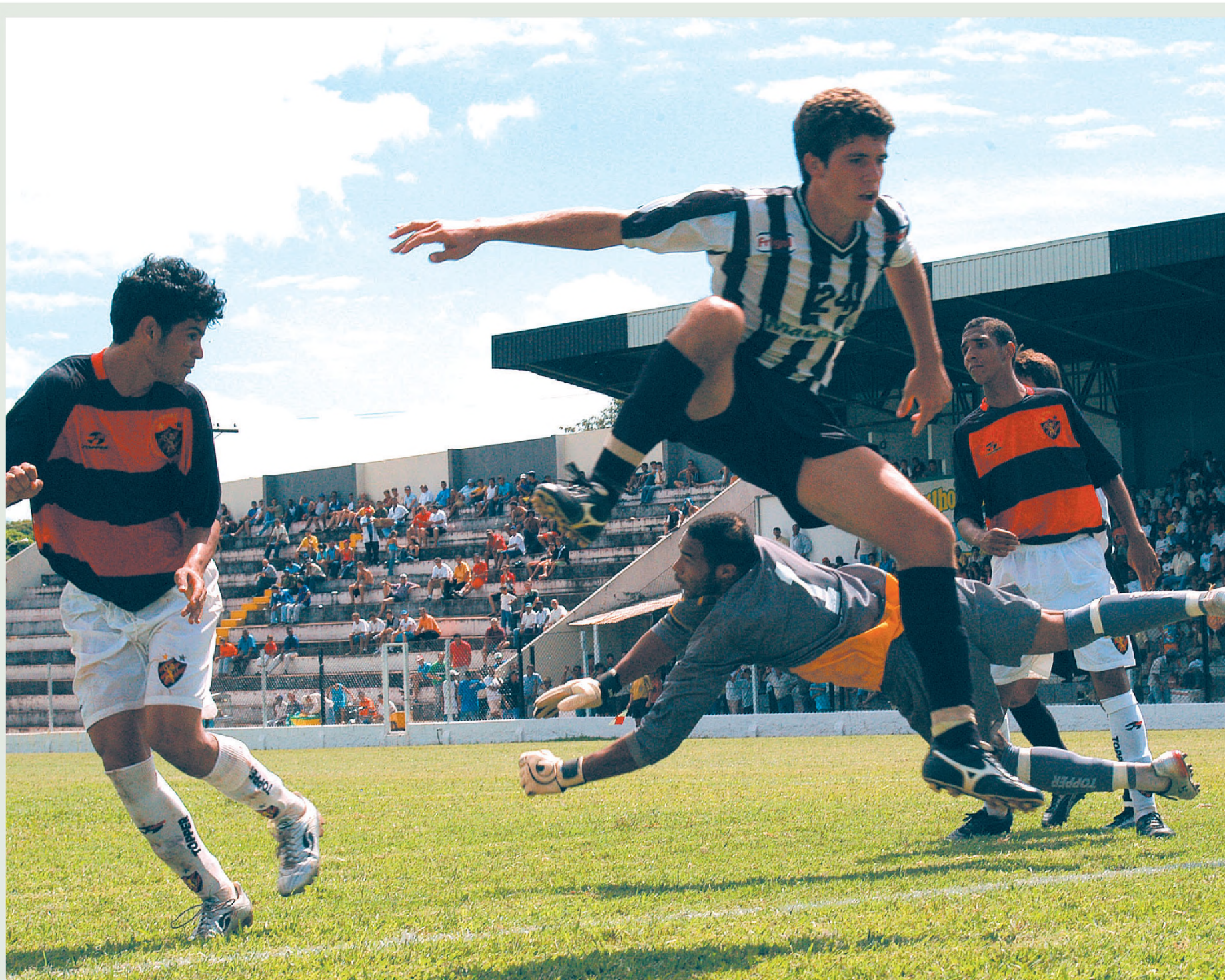
Lance da partida entre CAL e Sport Recife: as duas equipes já entraram em campo sem chances e empataram sem gols