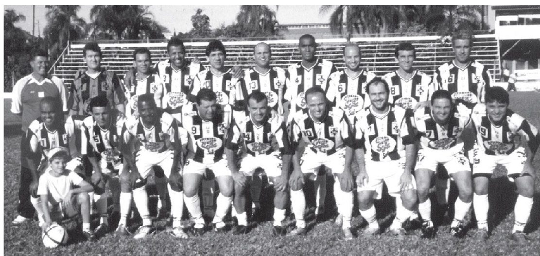
Jogadores que fazem parte do elenco dos veteranos do CAL