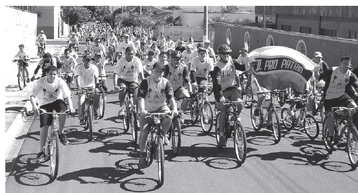
Último passeio realizado em Borebi pelo projeto Bike & Saúde

A terceira edição do passeio ciclístico realizado no