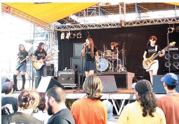
Medusa, umas das bandas que agitaram o último domingo da Facilpa