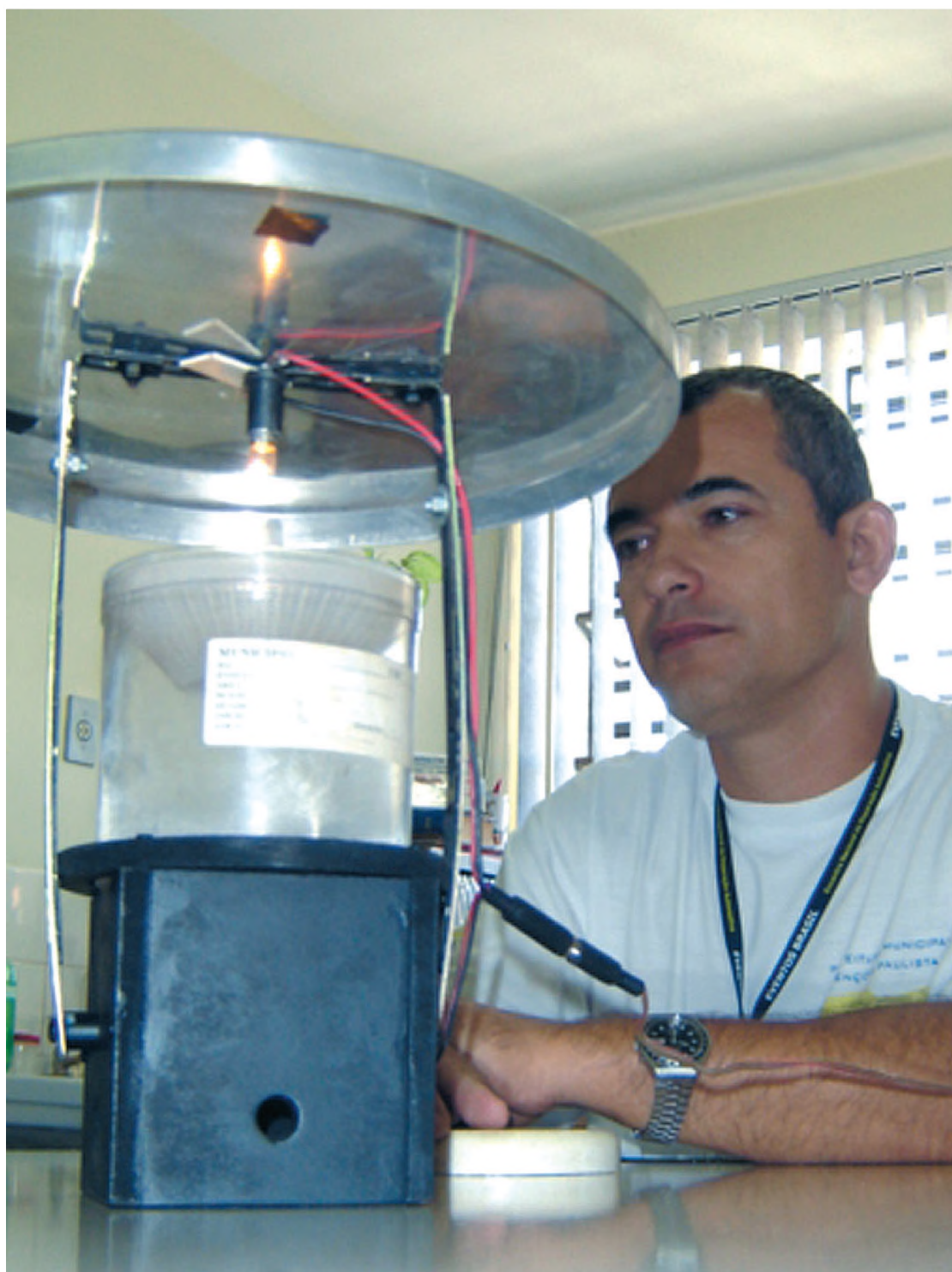
Funcionário da Saúde mostra a armadilha usada na captura do mosquito transmissor da leishmaniose

ATENÇÃO Equipes da Saúde Comunitária encontram mosquitos transmissores em dois lugares do Município e pedem a colaboração da população no combate à doença