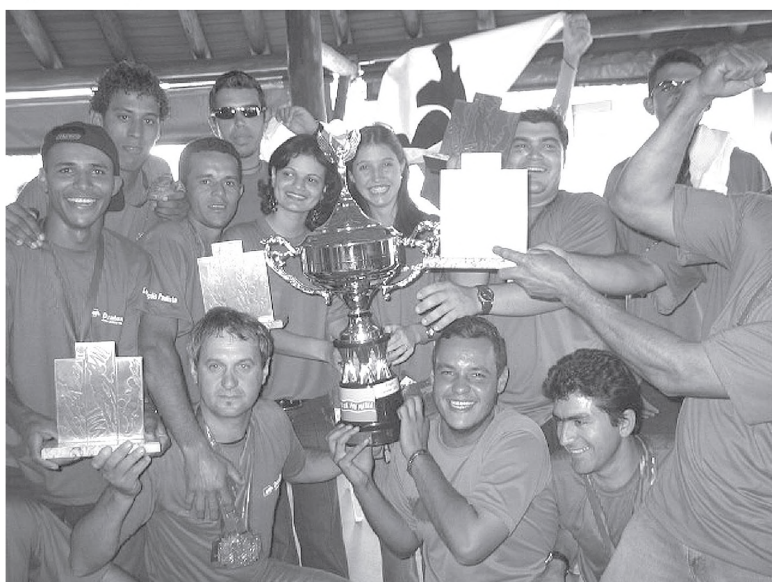
A empresa Duratex foi a campeã dos Jois no ano passado

Na modalidade de futebol sete, a Usina Barra Grande joga contra a Adria às 16h, no mesmo horário a Destilaria encara a Lwart. Às 17h acontecem os jogos entre as equipes da Proasfar x Frigol A e Correios x Lwarcel A. No último jogo da rodada a Lwarcel B enfrenta a Duratex A. Na quarta-feira, dia 18, às 18h, na ADC, acontece a disputa no bocha rafa.