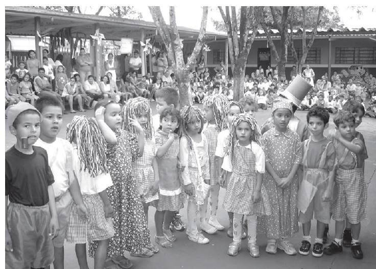
Crianças se apresentaram durante as comemorações do folclore