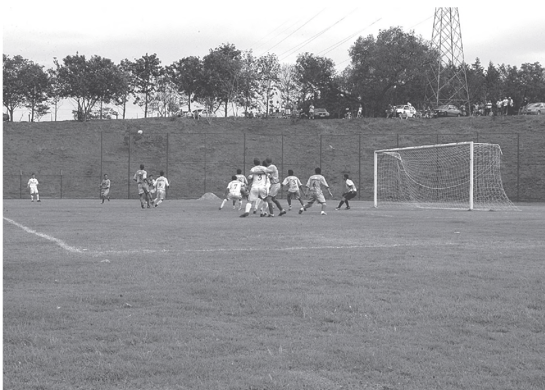
Num jogo de várias oportunidades de gol Grêmio e Areiopolense empataram em 1 a 1

Amanhã pela quarta rodada da competição a equipe de Agudos pega a Cruzeiro às 10h, no campo da Fatura. No campo do Grêmio Lwart, a equipe da casa joga contra Macatuba às 10h. Em Alfredo Guedes a Frigol encara Botucatu às 10h. No estádio municipal Archângelo Brega, o Bregão, a equipe da Santa Luzia joga contra a Areiopolense.