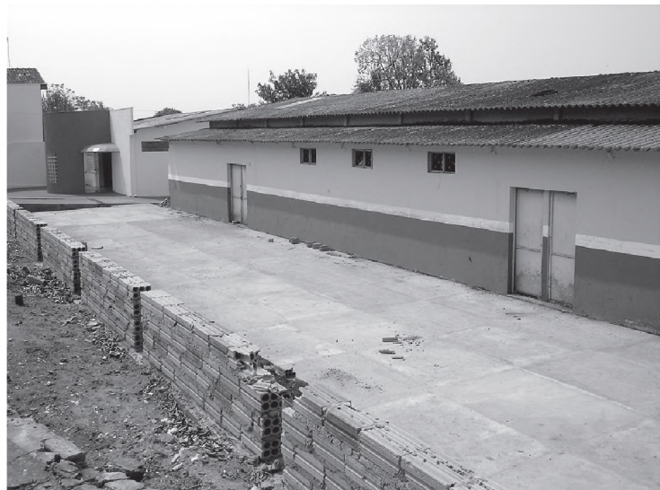
Reforma do Centro Comunitário