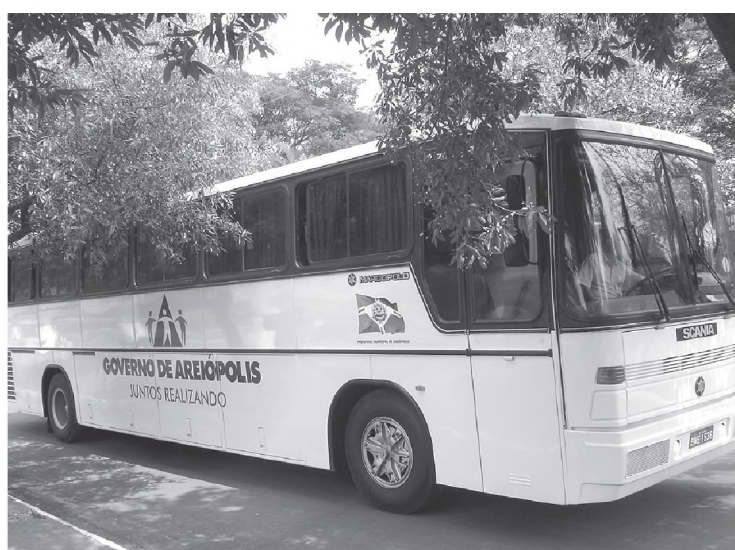
Aquisição de ônibus pela Prefeitura para atender população e estudantes que vão para outras cidades em busca de ensino