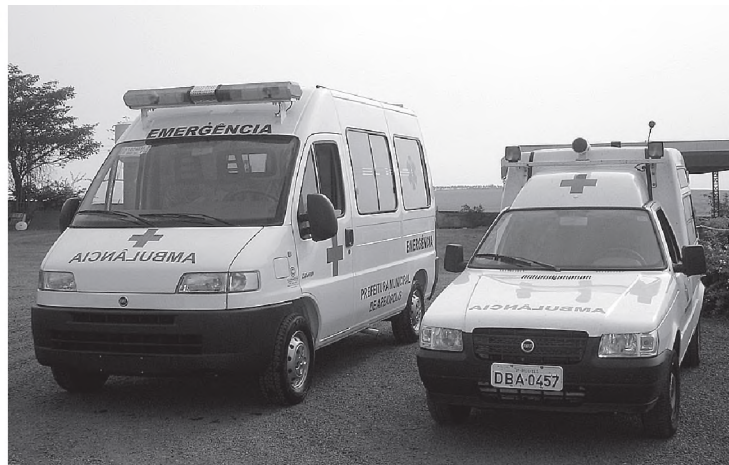
Aquisição de duas ambulâncias através do Governo Federal; um dos veículos funciona como UTI básica