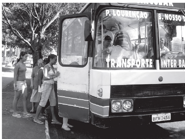
Implantação de linha de circular gratuito para a população; serviço é amplamente utilizado por estudantes