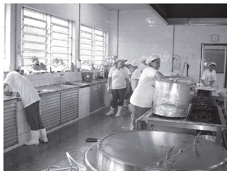
Cozinha piloto: Merenda em todas as escolas no período da manhã, tarde e noite, outra novidade do governo