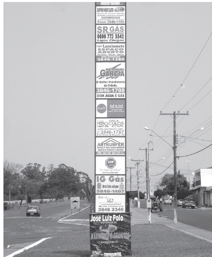
Revitalização da entrada do Município e construção de um relógio