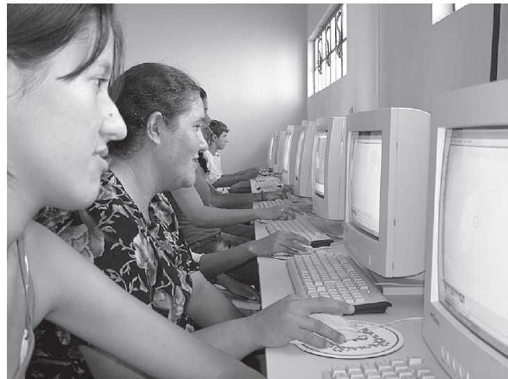
Curso de informática gratuito para a população, principalmente para trabalhadores rurais e curso técnico no Senai e estágio para os jovens e legionários