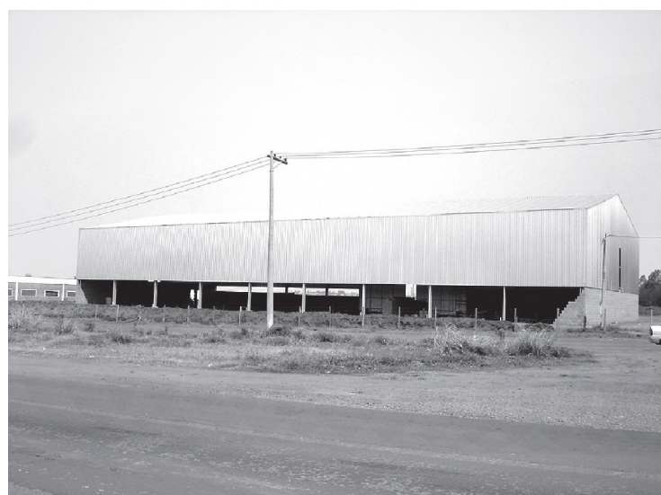
Instalação de empresa de solda, caldeiraria e carrocceria: geração de emprego no Município de Areiópolis

Instalação de duas estufas de verduras no bairro CDHU 2 e uma no Nosso Teto, atendendo cerca de 16 famílias carentes: um dos primeiros projetos desenvolvidos no governo Peixeiro