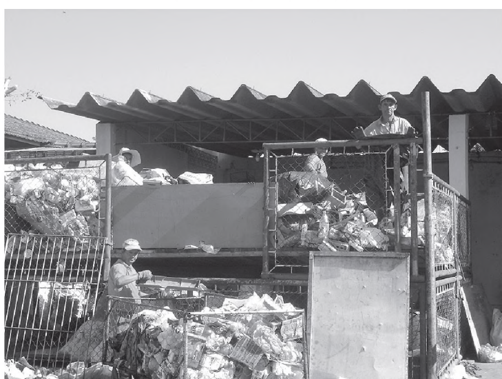
Implantação do Projeto Reciclar: melhorias no meio ambiente e assistência à famílias carentes da cidade