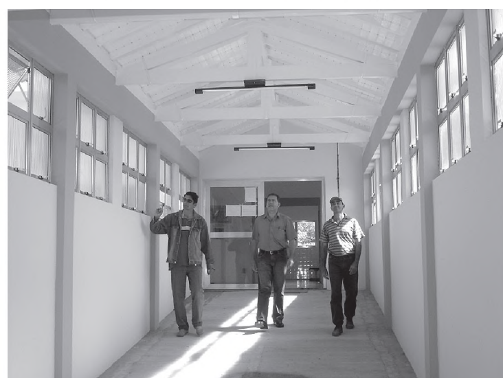
Interligação de um bloco para outro na Unidade Mista de Saúde, obra que aumenta agilidade na Saúde