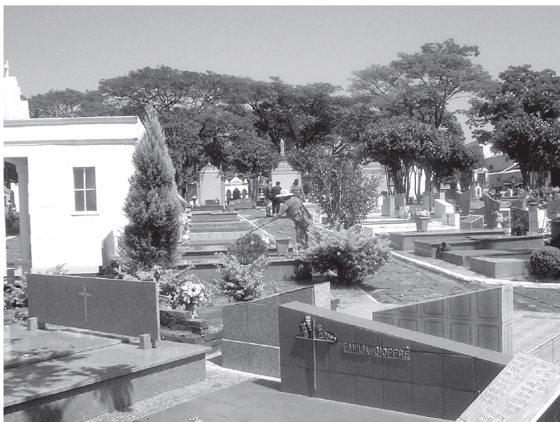
Cerca de 4 mil pessoas devem visitar o Cemitério no feriado de Finados

O serviço de coleta de lixo será suspenso no dia 2. Creches municipais e as demais repartições internas e externas da Prefeitura também não funcionam no Dia de Finados. Todos os setores voltam a funcionar normalmente na quinta-feira, dia 3. A vigilância patrimonial e o setor de obras, e a coleta de esgoto sanitário e a Estação de Tratamento de Água (ETA), do SAAE, manterão equipes de plantão na quarta-feira.