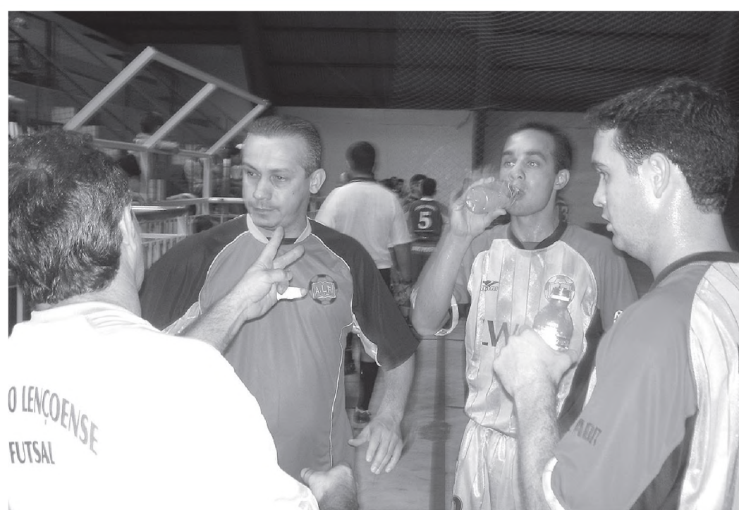
Mixirica, técnico da ALF conversa com jogadores durante intervalo da partida

Na classificação final, Lençóis ficou com a terceira colocação. O primeiro lugar foi conquistado por Franca, seguida de Mogi Guaçu, em quarto lugar ficou a equipe de Birigui.