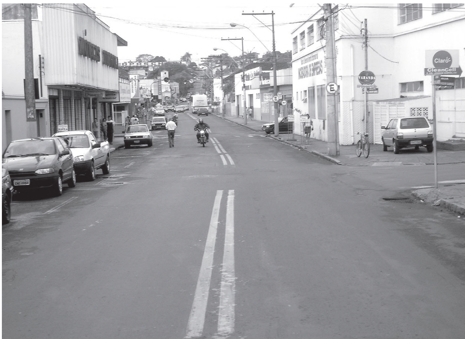
A Avenida 25 de Janeiro, um dos principais pontos de reclamações pode ter a velocidade controlada

Apesar do falatório das últimas sessões, a Câmara não convocou ninguém relacionado ao trânsito do Município para dar explicações ao Legislativo. No último encontro, os parlamentares aprovaram um requerimento pedindo informações sobre o setor. Mas o prefeito Marise se adiantou e disse que a Comutran está disposta a ir à Casa de Leis para responder as perguntas dos vereadores. "É só marcar a data", finaliza.