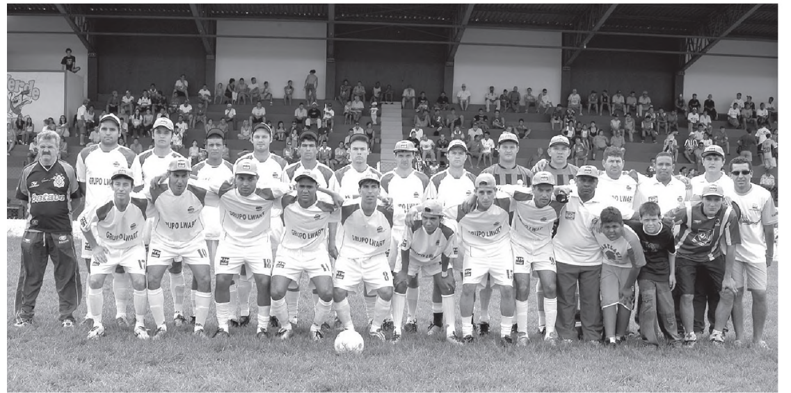
Jogadores e comissão técnica da equipe campeã