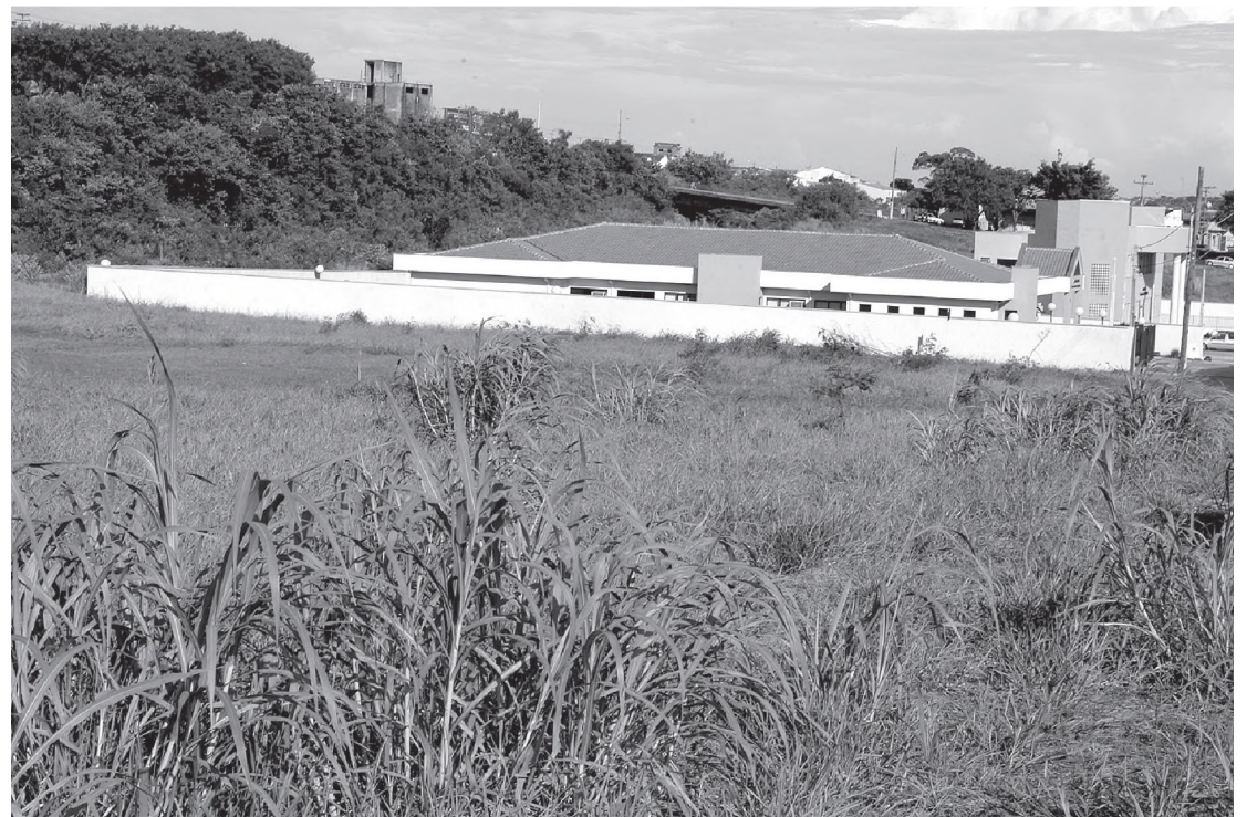
Sede própria do INSS será vizinha do prédio da Vara do Trabalho