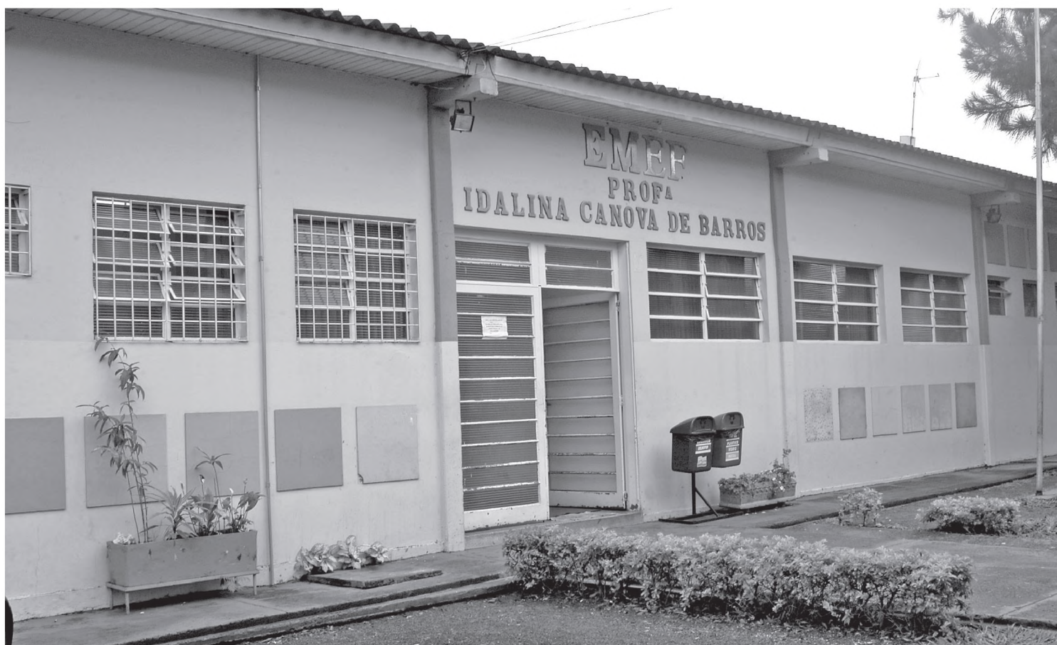
A Escola Idalina Canova de Barros foi uma das que recebeu o selo de Escola Solidária

O vereador protocolou ainda indicações onde pede ao Executivo que instale bebedouro no ginásio municipal Odécio Vieira Portes, colocação de duas travas na quadra de areia localizada no ginásio municipal de esportes, como também a capinação do mato e reparos na tela de proteção. Além da substituição do granito da escada da porta de acesso da escola EMEF “Mário de Barros Aranha” por piso antiderrapante. “Tenho observado que este granito oferece condições de risco de acidentes para os seus usuários. A escola possui alunos portadores de necessidades especiais”, comentou.