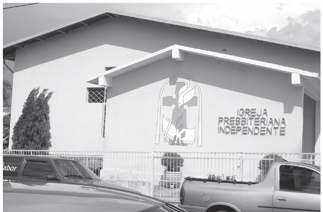
Igreja Presbiteriana Independente comemora 125 anos amanhã