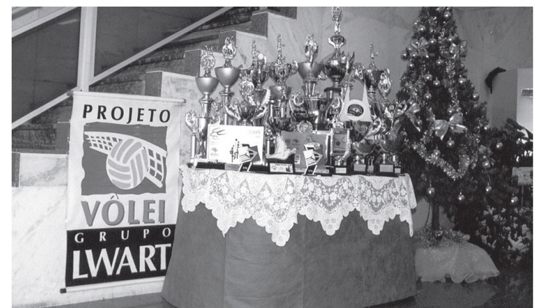
Os troféus do Projeto Vôlei podem ser vistos na agência do Banco do Brasil

O saguão da agência do Banco do Brasil de Lençóis Paulista está expondo os troféus conquistados no ano pelo Projeto Vôlei, desenvolvido em parceria pela prefeitura e empresas Lwart. Foi um ano vitorioso para as equipes do projeto, que encerraram as