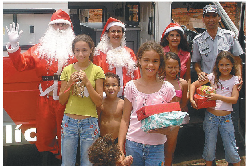
Os policiais da Base Comunitária de Lençóis distribuíram presentes de Natal para as crianças do bairro Cecap