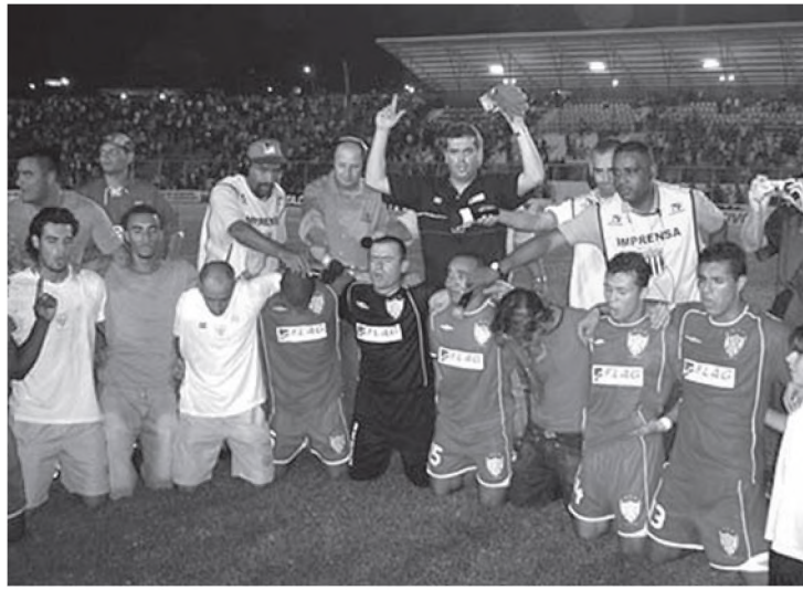
Jogadores do Noroeste de Bauru comemoram o acesso a primeira divisão do campeonato paulista

A competição será realizada em 19 partidas, em turno único, no sistema de pontos corridos, de forma contínua, onde todas as equipes jogarão entre si. A equipe que acumular o maior número de pontos ao término da última rodada, será considerada a