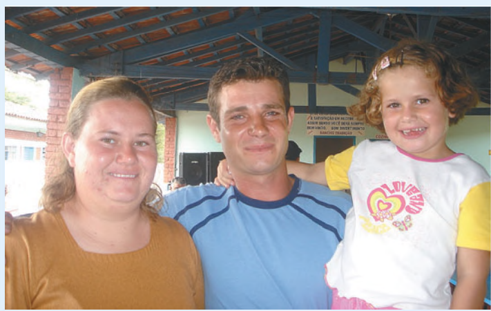
Família Comercial Futebol Clube reunida em momento de confraternização de final de ano, no domingo, dia 18, na chácara Langona