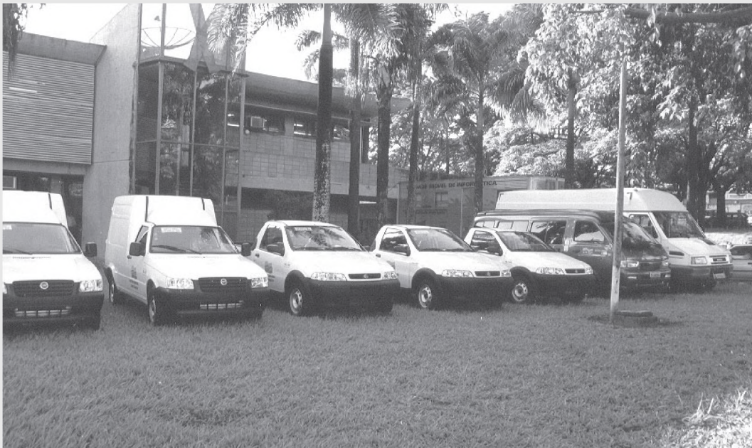
Neste final de ano, a Prefeitura aumentou sua frota em oito veículos

As Diretorias de Obras, Meio Ambiente e Educação receberão dois veículos (um Fiorino e uma Strada). O setor de Apoio e Motomecanização também receberá uma Strada para o desenvolvimento de suas atividades. Já os veículos modelo Besta são