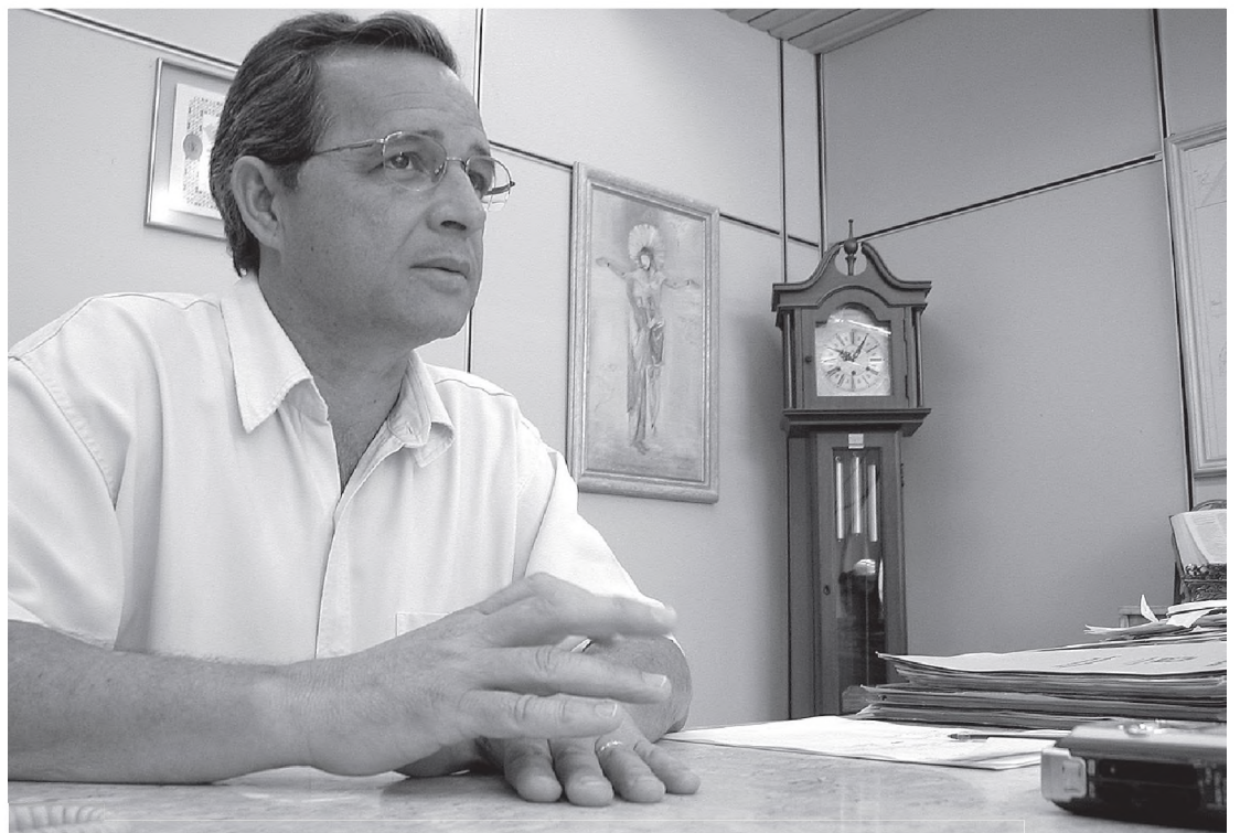
Para Marise, Governança Municipal e 'Cidade Limpa e Solidária' foram destaques em 2005

O projeto Cidade Limpa e Solidária começou em agosto de 2003. A base é o trabalho dos integrantes da Cooprelp (Cooperativa dos Recicladores de Lençóis Paulista), que atuam nas ruas da cidade e na separação de materiais recicláveis na Usina de Reciclagem e Compostagem da Prefeitura. Os cooperados substituíram os funcionários municipais na separação de