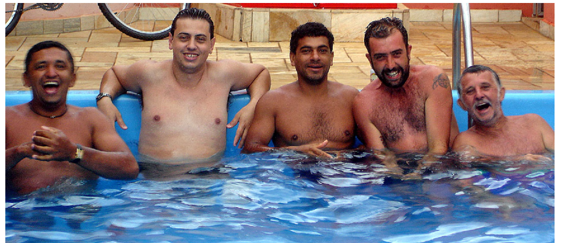
Galera da FACOL reunida em edícula no Jardim Monte Azul