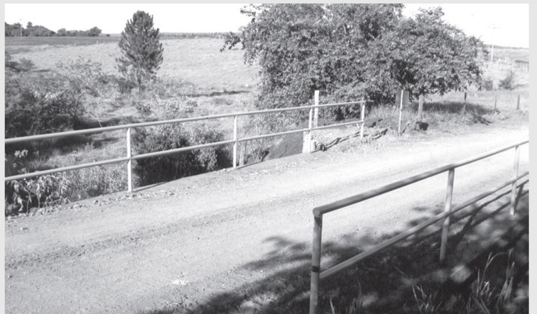
Ponte no Faxinal recebem dois corrimões e corrigiram erosões no local

A Prefeitura finalizou na semana passada, a reforma da ponte existente na estrada municipal Wilson Petenazzi (LEP 050), que dá acesso ao bairro Faxinal. Além de interligar Lençóis Paulista e Borebi, a estrada é muito usada para o escoamento da produção agrícola da região e para o