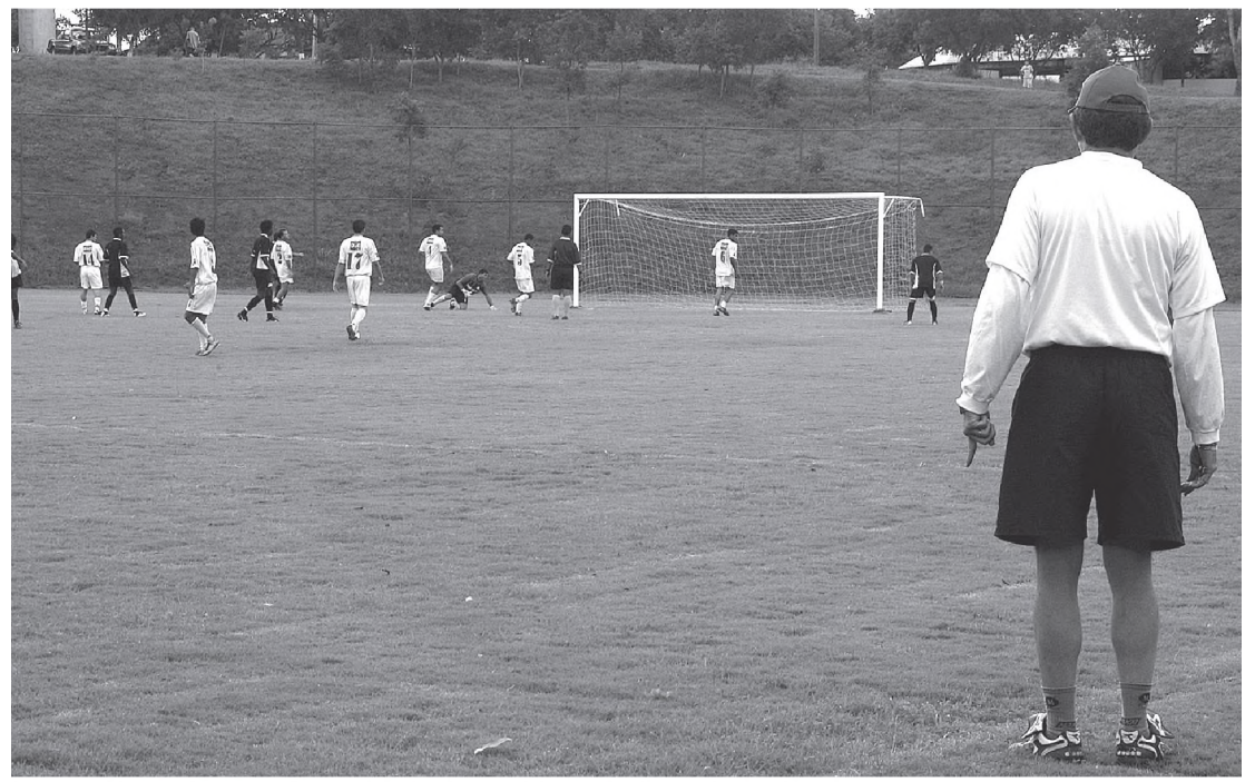
Lance da partida onde o Cal goleou o Grêmio Lwart por 5 a 1

A diretoria do CAL promove na próxima terça-feira, dia 3, um coquetel de abertura da 37ª Copa São Paulo de Futebol Junior. O evento que contará com a participação das equipes que disputarão os jogos em Lençóis, representantes da FPF (Federação Paulista de Futebol) e autoridades acontece às 20h, na Locomotive Club.