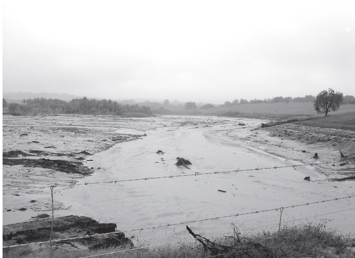
Represa J. Raposo se rompeu por volta da 0h de segunda-feira, segundo informações de moradores