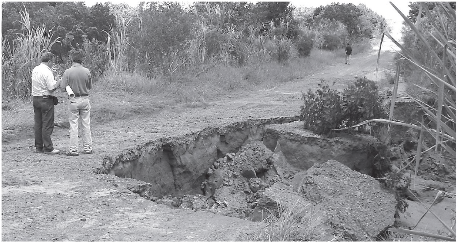
Técnicos do DAEE avaliam uma das represas do Garrido que corriam o risco de se romper na tarde de terça-feira

Após vistoriar as represas do Garrido e a J. Raposo, os técnicos do DAEE e diretores da Prefeitura Municipal de Lençóis Paulista seguiram para a represa da Noiva da Colina, a primeira a se romper no início da madrugada de segunda-feira.