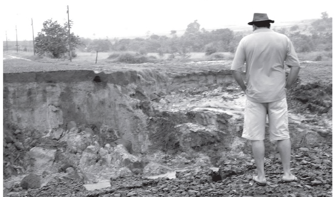
Morador observa estrada destruída pela força das águas da represa J. Raposo, em Borebi

O problema, constatado posteriormente pelos diretores de Obras, e Meio Ambiente de Lençóis Paulista, e técnicos do Departamento de Água e Energia Elétrica do Estado de São Paulo (DAEE), teve início em uma represa menor na Noiva da Colina.