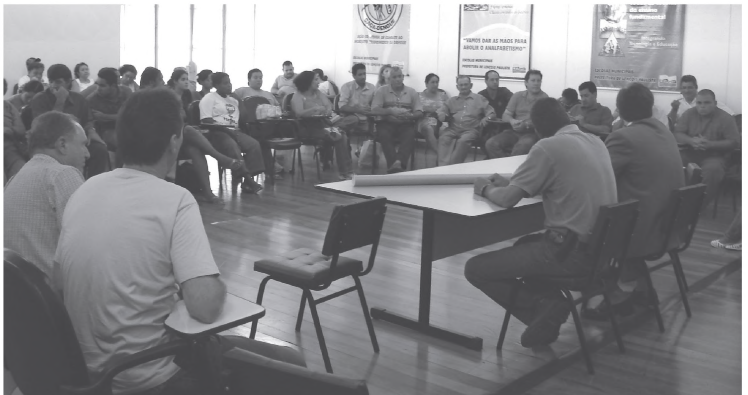
Vítimas das enchentes ocorridas na segunda-feira se reuniram com o diretor de Obras e com o Curador do Meio Ambiente