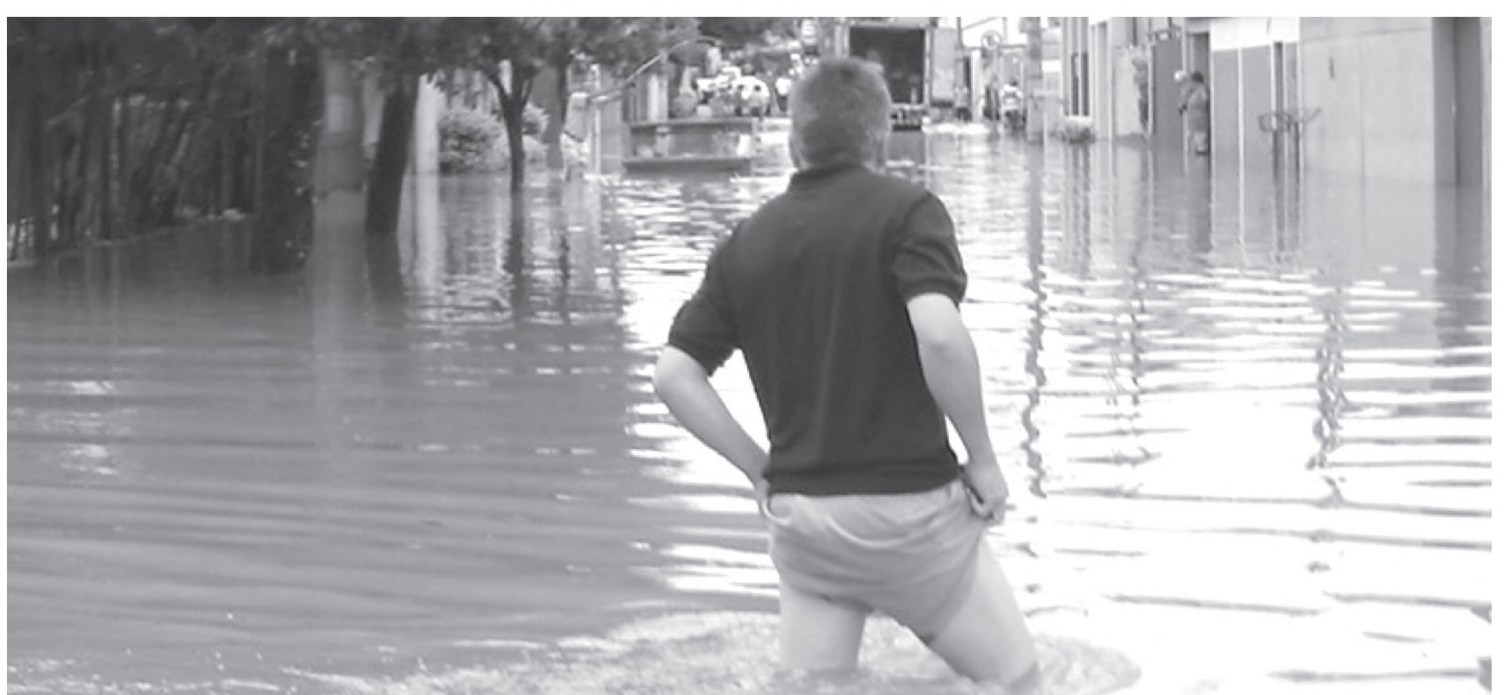
Morador enfrenta a água na Rua 15 de Novembro, proximidades do SAAE, uma das principais ruas do comércio lençoense

A chuva do último final de semana provocou danos em Bauru, Cabralia Paulista e Paulistânia. Em Cabralia Paulista, nem as pontes feitas de concreto suportaram a força