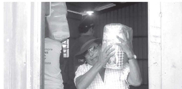
Morador carrega cesta de alimentos arrecada por vereadores