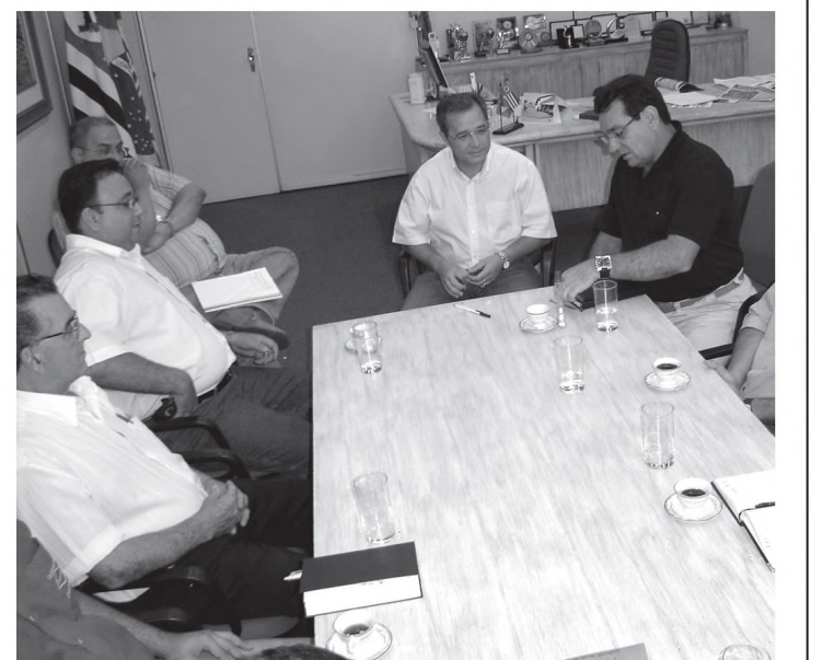
Marise ouve reivindicação de proprietários de supermercados

A substituição das cestas básicas por tickets foi amplamente debatida na Câmara Municipal no ano passado e o prefeito Mari-