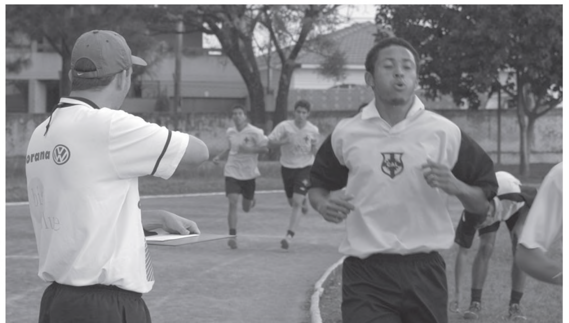
Comissão técnica intensifica treinamentos da equipe para disputa da Segunda Divisão