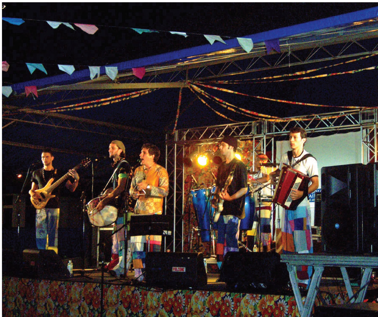
O grupo Tarralá apresenta as tradições da música e da poesia nordestinas; show acontece amanhã no Toniquinho, às 21h

Os seis garotos do interior não descendem de nordestinos, mas sempre amaram a geração de novos artistas originários de lá, como o maranhense Zeca Baleiro, o pernambucano Lenine, o paraibano Chico César, o falecido Chico Science e seu movimento mangue beat, além do cearense Fagner.