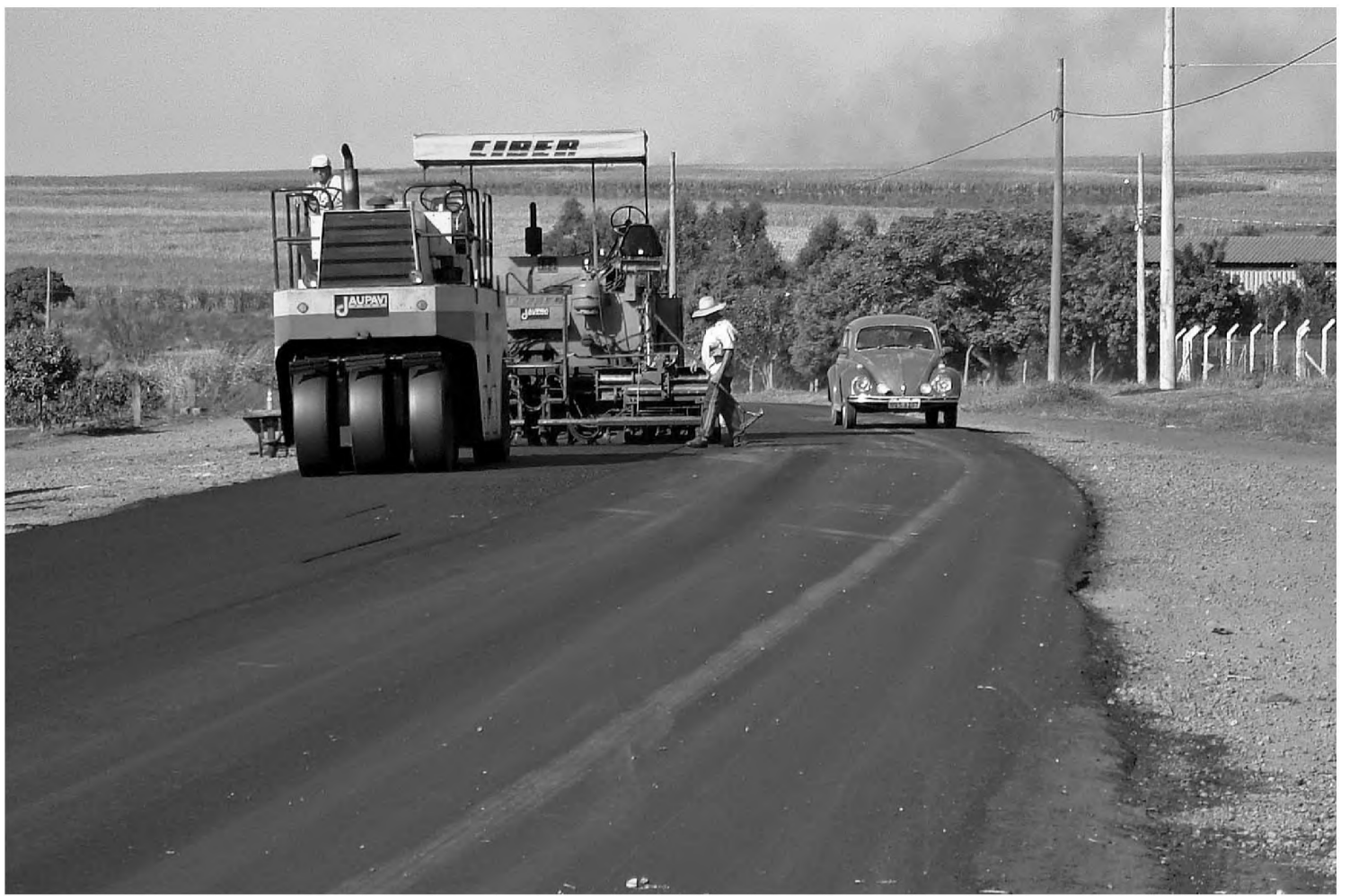
Máquinas trabalham no recapeamento da vicinal Lauro Perazoli, que está em péssimas condições; estrada nunca passou por recape

Coolidge diz que já verificou as possibilidades de ins-