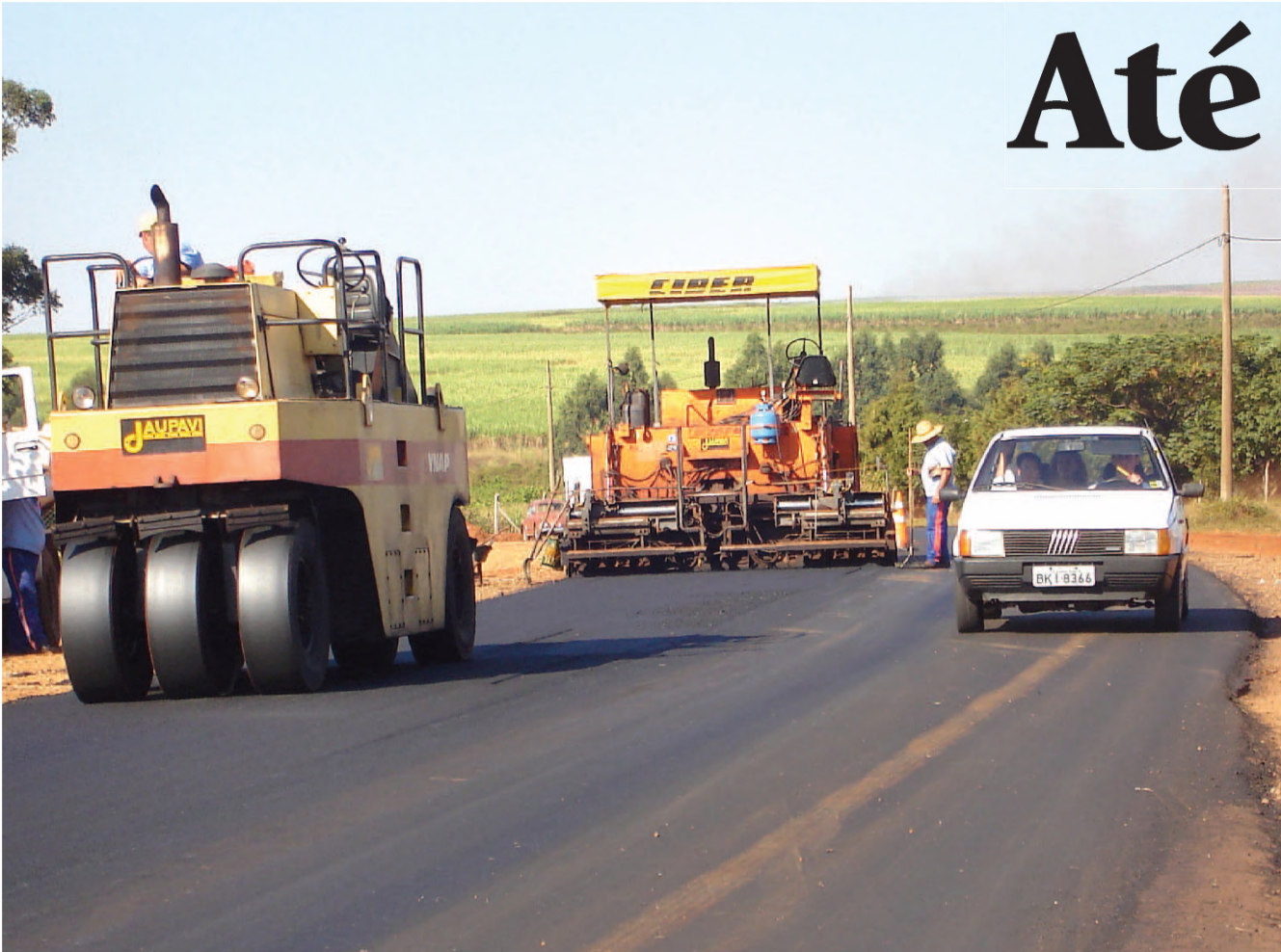
Começou na segunda-feira 19 o recape da vicinal Lauro Perazolli, no trecho que pertence para Macatuba