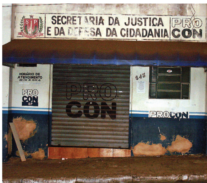
O Procon de Lençóis recebeu quatro denúncias em dois dias

O argumento de que a água não tem qualidade também não tem o menor cabimento. A água distribuída pelo SAAE tem a qualidade garantida por exames constantes, feitos tanto pelo próprio SAAE quando pelos órgãos de controle, como a Vigilância Sanitária e a Cetesb. (com assessoria de Comunicação)