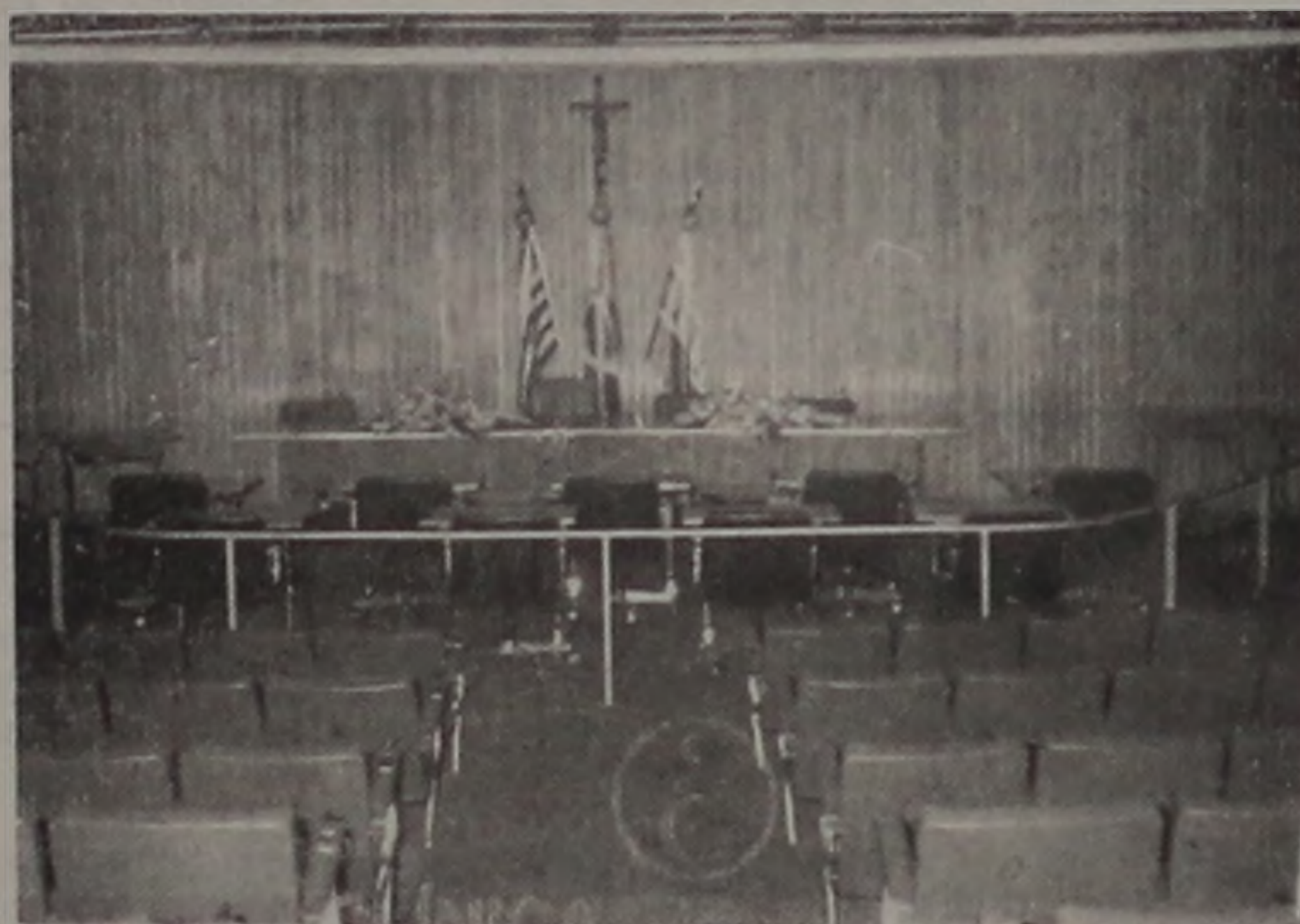
Nove dos vereadores eleitos terão assento no plenário pela primeira vez.