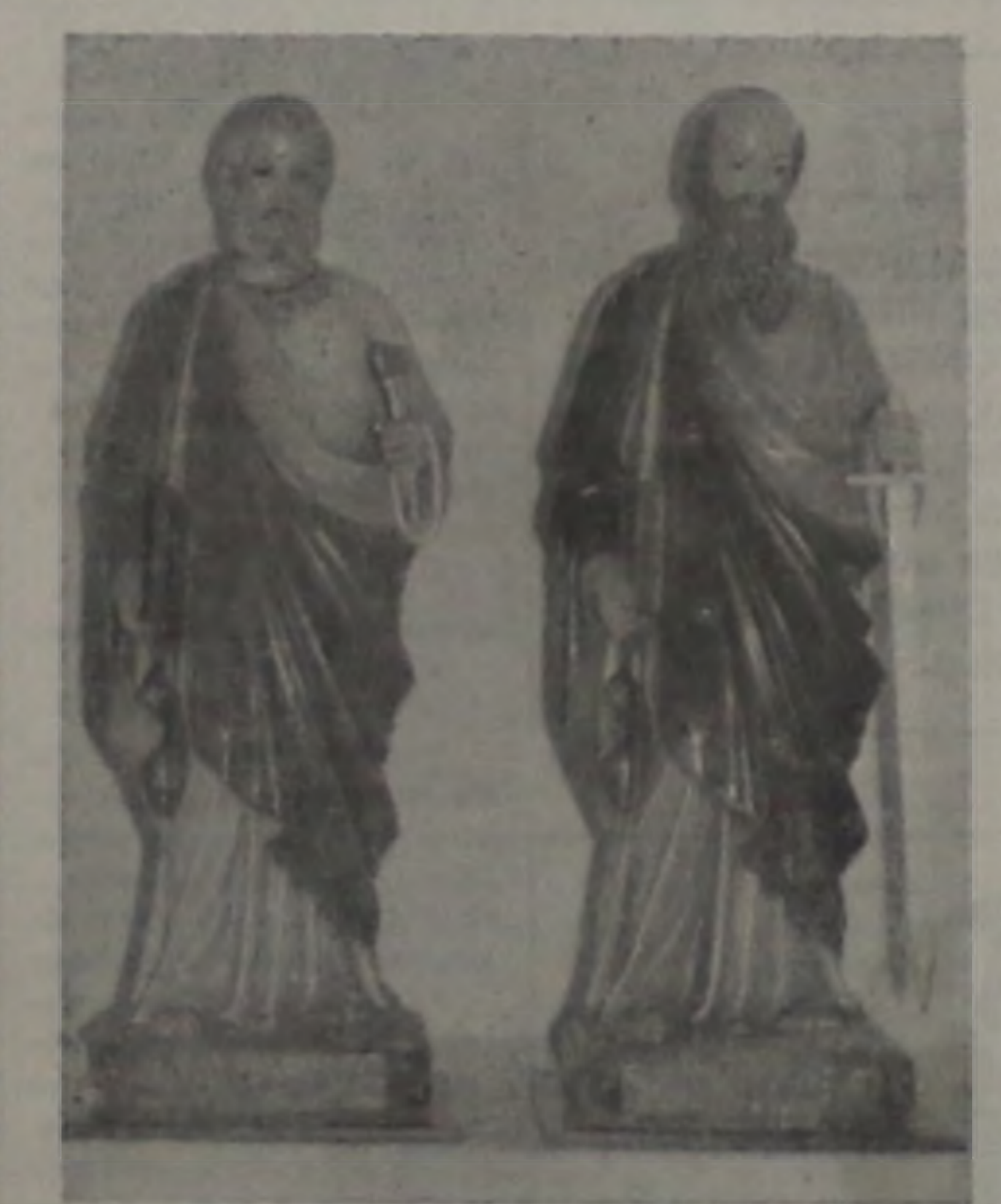
As imagens dos dois apóstolos fundamentais da Igreja Católica.