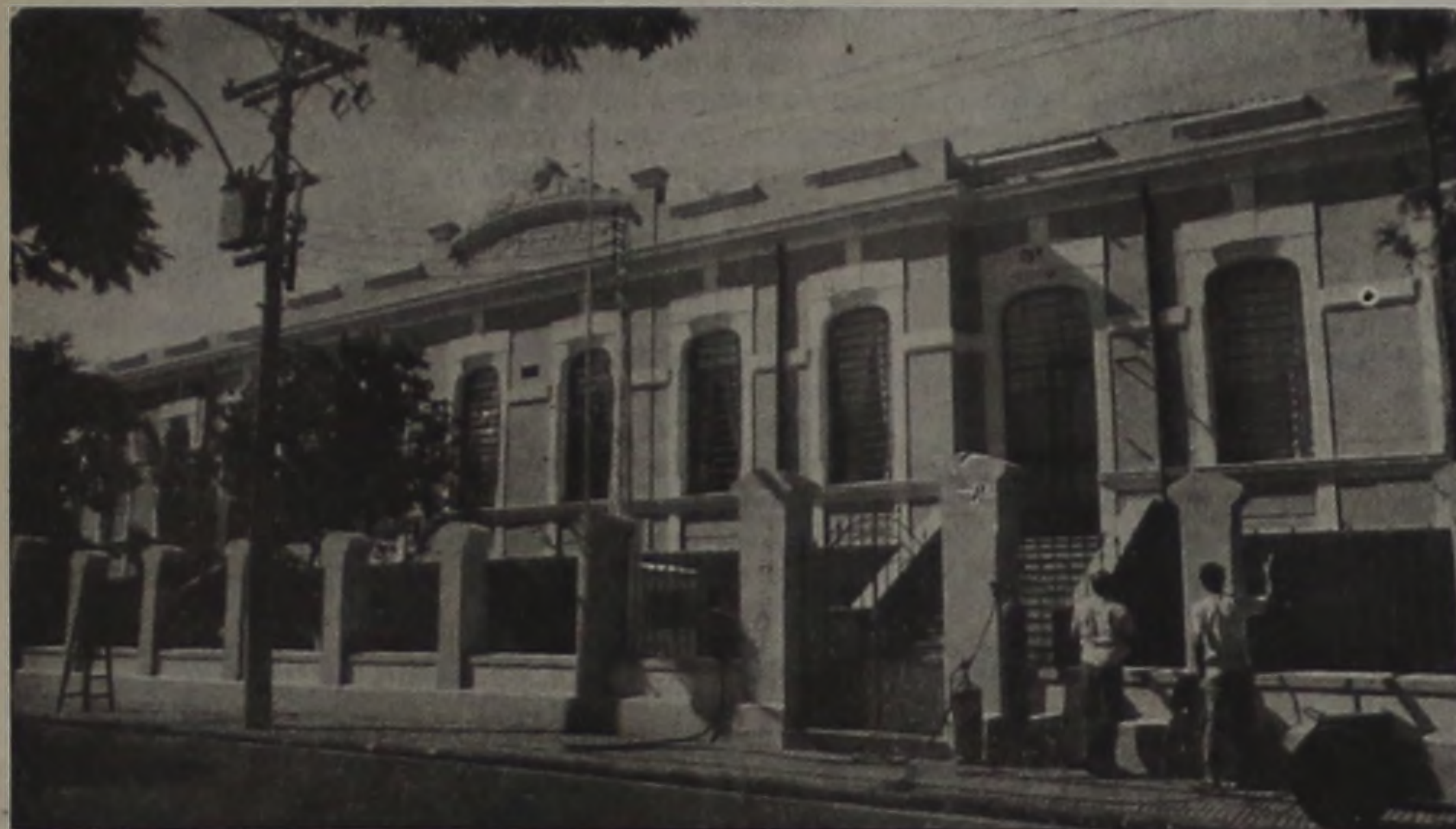
A EEPG "Esperança de Oliveira" é uma das duas escolas que ficaram ontem totalmente paralisadas.

A adesão dos professores da rede estadual à greve da categoria, em Lençóis Paulista começou na última quarta-feira e ontem já era total em duas escolas da cidade. Nos turnos da manhã e tarde, nenhum professor trabalhou na EEPG Esperança de Oliveira e na EEPG Antonieta Grassi Maltrasi. Nas demais escolas, deviam comparecer para aulas 243 professores, mas apenas 115 registraram frequên-