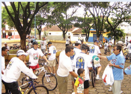
Ciclistas largam em frente ao Tonicão

A organização lembra que somente os participantes que estiveram com coletes