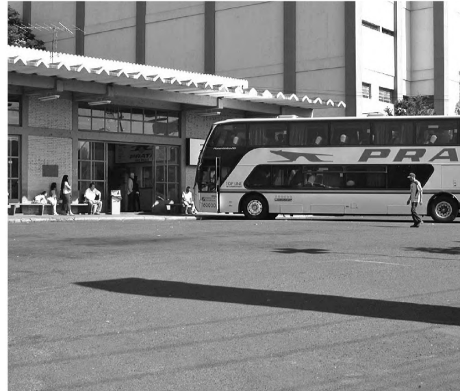
Vista geral do terminal rodoviário de Lençóis Paulista

O último aumento autorizado pela agência foi em fevereiro de 2005. Para o cálculo do reajuste das tarifas foram considerados os aumentos no preço do combustível, pneus, veículos e funcionários.