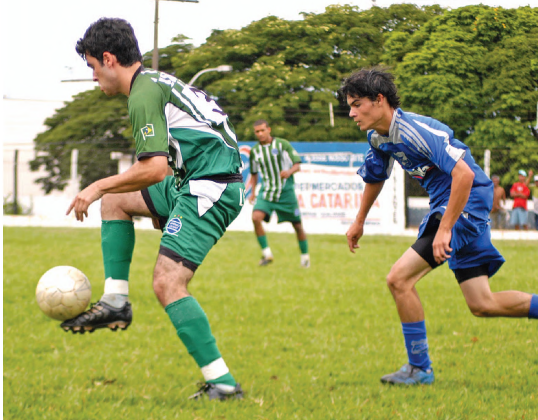
Lance da partida em que o Grêmio Lwart goleou o Porto de Areiópolis por 4 a 1 e garantiu vaga na final