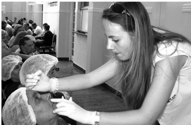
Vinte e sete pessoas foram operadas das cataratas no sábado