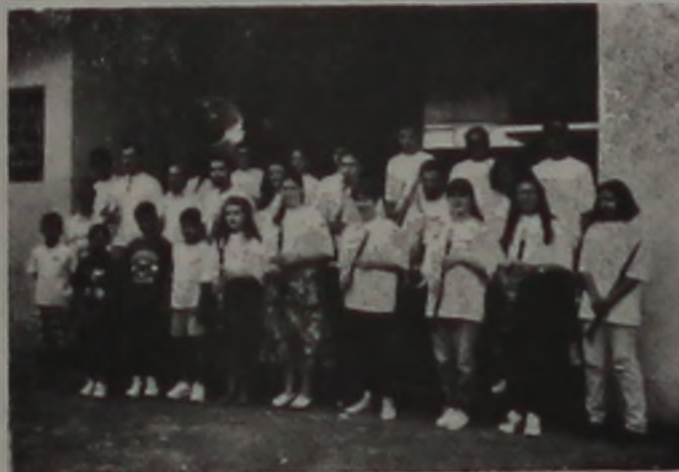
Componentes da Banda "Heitor Villa Lobos": missão de resgate do patrimônio musical municipal

Recém criada pela Casa da Cultura "Profa. Maria Bove Coneglian", a Banda "Heitor Villa Lobos", fará sua primeira apresentação em público no dia 13 de dezembro, a partir das 20h30 min. no palco montado na rua XV de Novembro. A apresentação faz parte da programação cultural natalina repleta de eventos que se encerram apenas no dia 22. Essa banda ainda se apresentará no dia 16, às 20h30 min, no Coreto da Praça Marcos Moretto, na Bela