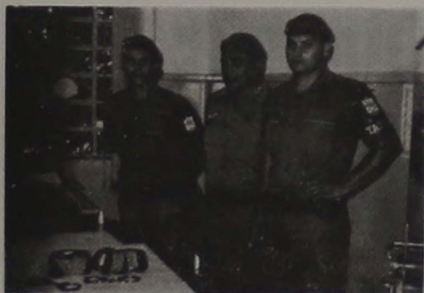
Os policiais do tático interceptaram o Opala e encontraram a droga.